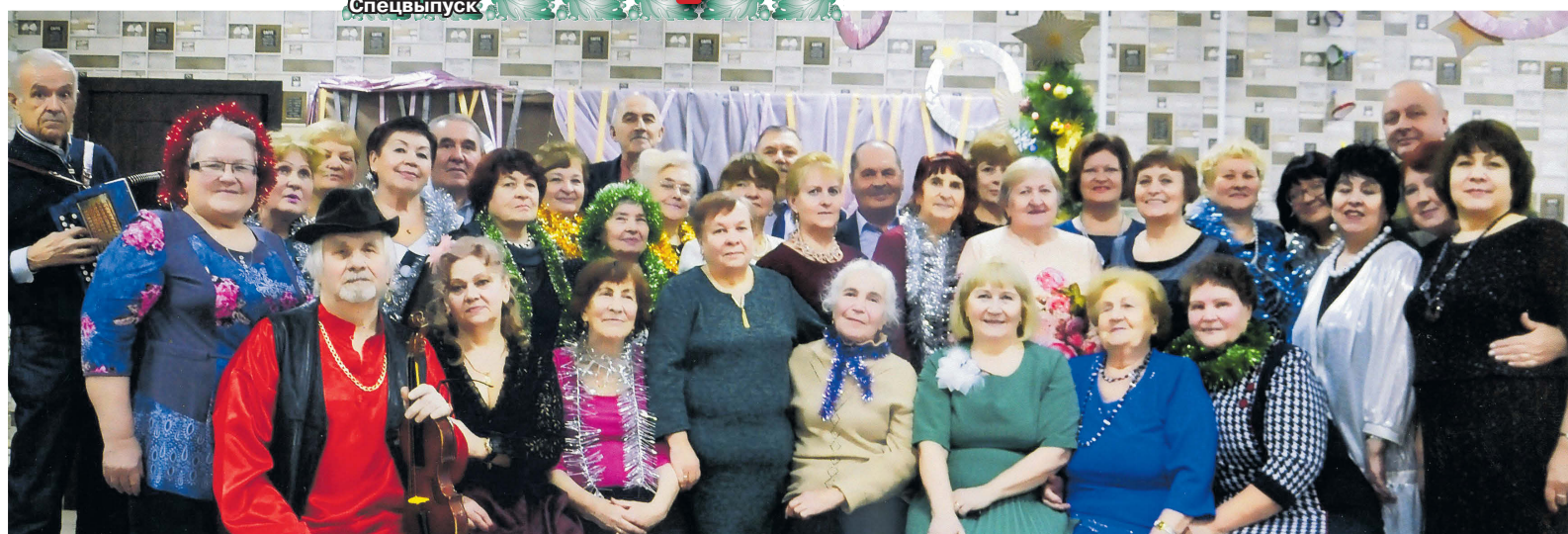
▲ Ветеранская организация АМЗ на встрече Нового года

Многое можно рассказать о нашей ветеранской организации, если кому-то интересно. Для металлургов, которые всегда были как единый мощный кулак, одним словом, коллектив, наступившее время ограничений самое худшее.