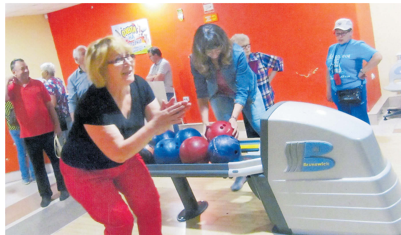
▲ Азартная игра в боулинг

Большая работа всегда ведется к 9 Мая. Это уточнение списка ветеранов-участников Великой Отечественной войны и тружеников тыла – кто из них сможет принять участие в митингах, праздничных мероприятиях. У кого мы будем посещать на дому, в больнице. О ком можно будет написать в местных га-