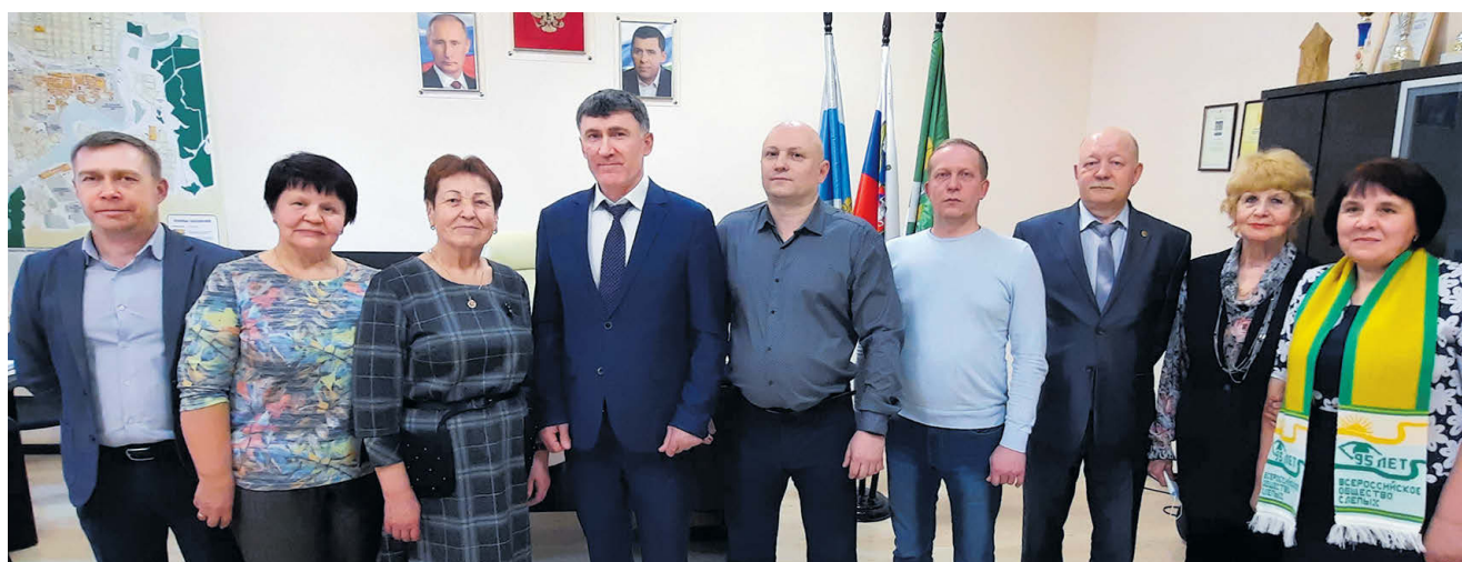
▲ Участники встречи

Как уже сообщалось, на прошлой неделе в администрации города состоялась деловая встреча с представителями Свердловской областной организации инвалидов по зрению