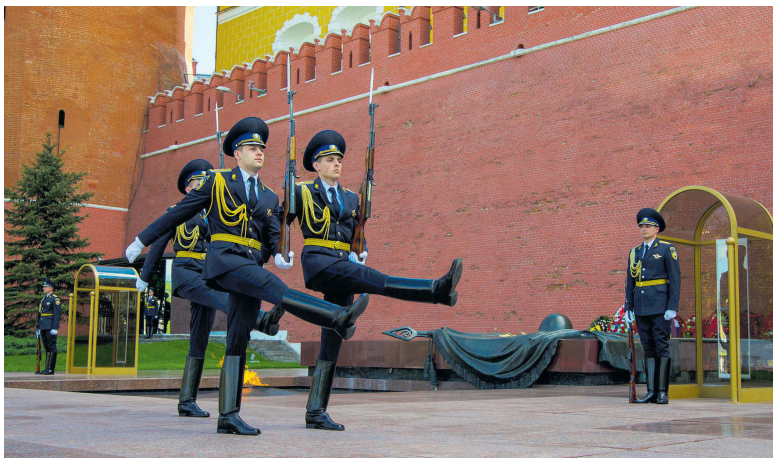
▲ Смена караула у Могилы Неизвестного Солдата

Послаблений в призывной кампании в связи с некоторым улучшением ситуации с COVID-19 у нас нет. По-прежнему остаётся масочный режим, ведётся контроль температурного режима. На призывных пунктах проводится обработка. Все средства для этого имеются. Налажен жесткий повседневный контроль. И областной сборный пункт будет помогать. При этом мы даём направление на вакцинирование, но оно носит рекомендательный характер. Кто не желает, тот оформляет письменное заявление и вакцинироваться будет, скорее всего, уже в рядах Во-