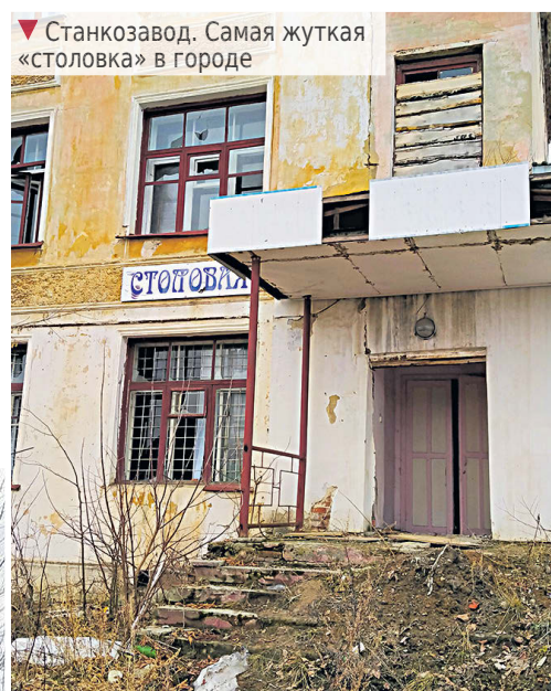
▼ Станкозавод. Самая жуткая «столовка» в городе