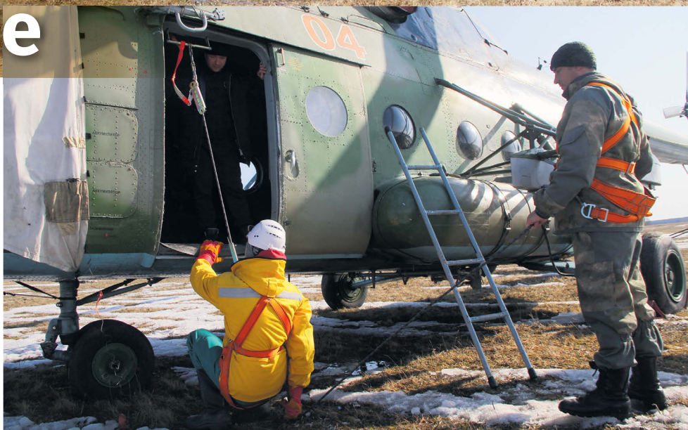
▲ Вертолёт на земле. Выполнение упражнения «Имитация спуска»