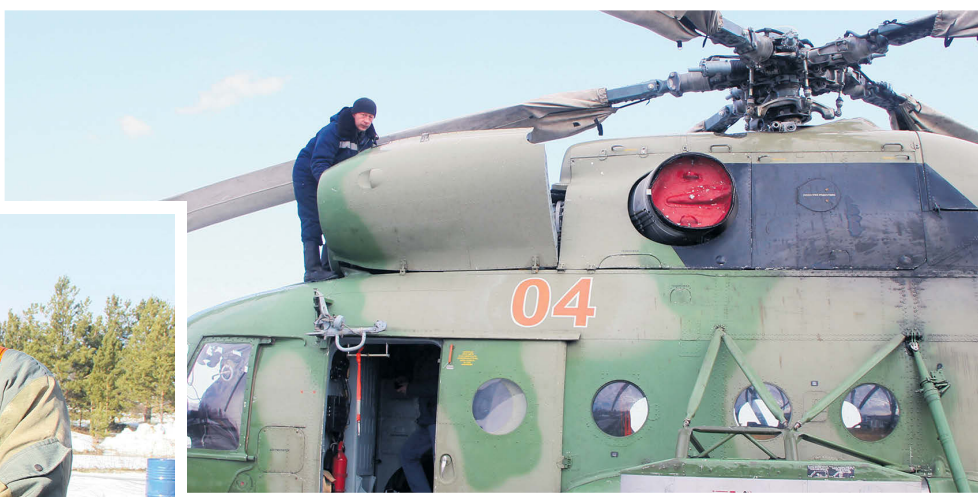
▲ Подготовка Ми-8 к взлёту