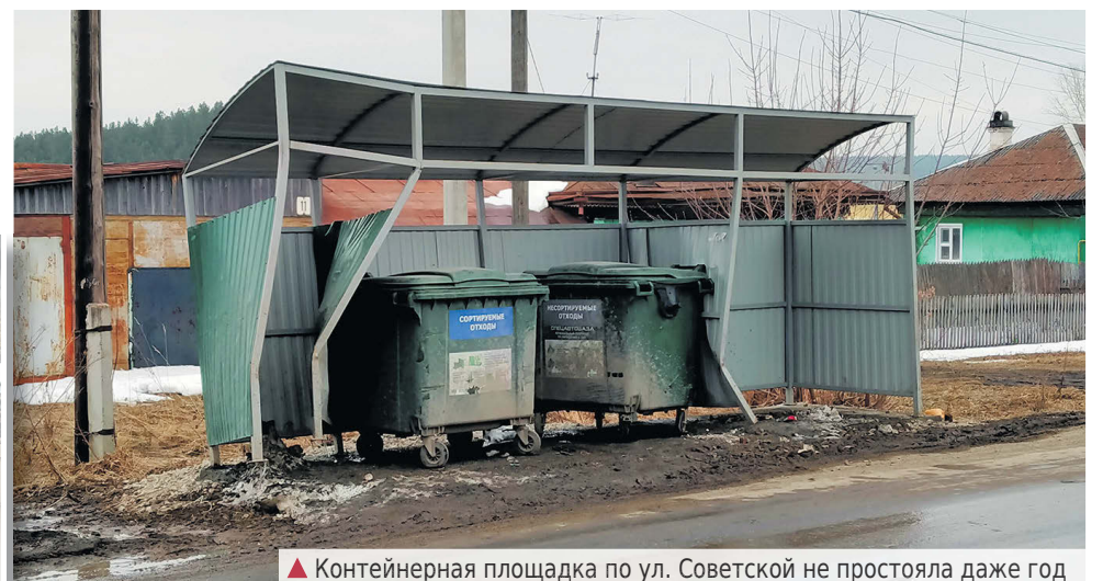
▲ Контейнерная площадка по ул. Советской не простояла даже год