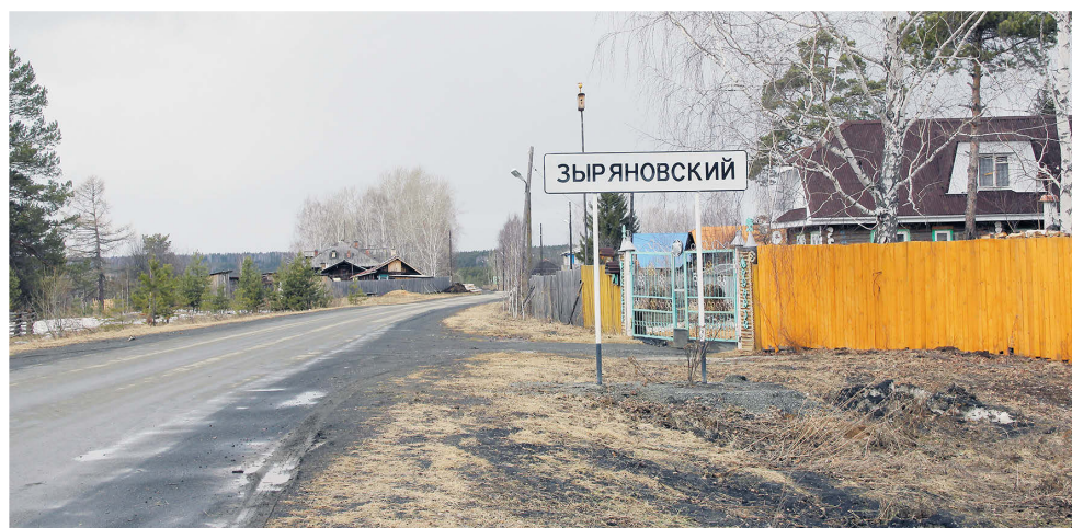
▲ Въезд в Зырянковский