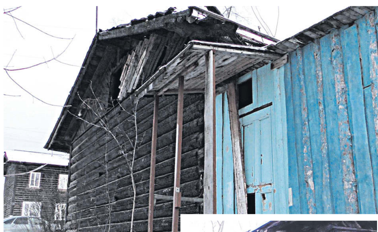
▲ Пока депутаты выясняют личные отношения, жители аварийных домов ждут решений городской думы