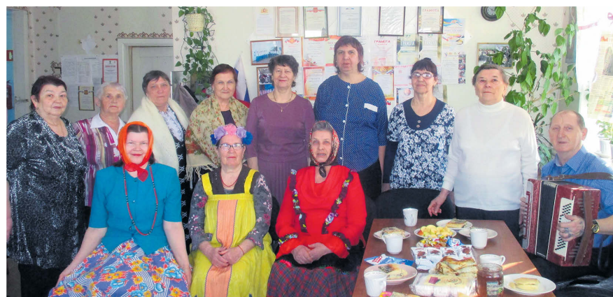
▲ Фото на память после очередного мероприятия