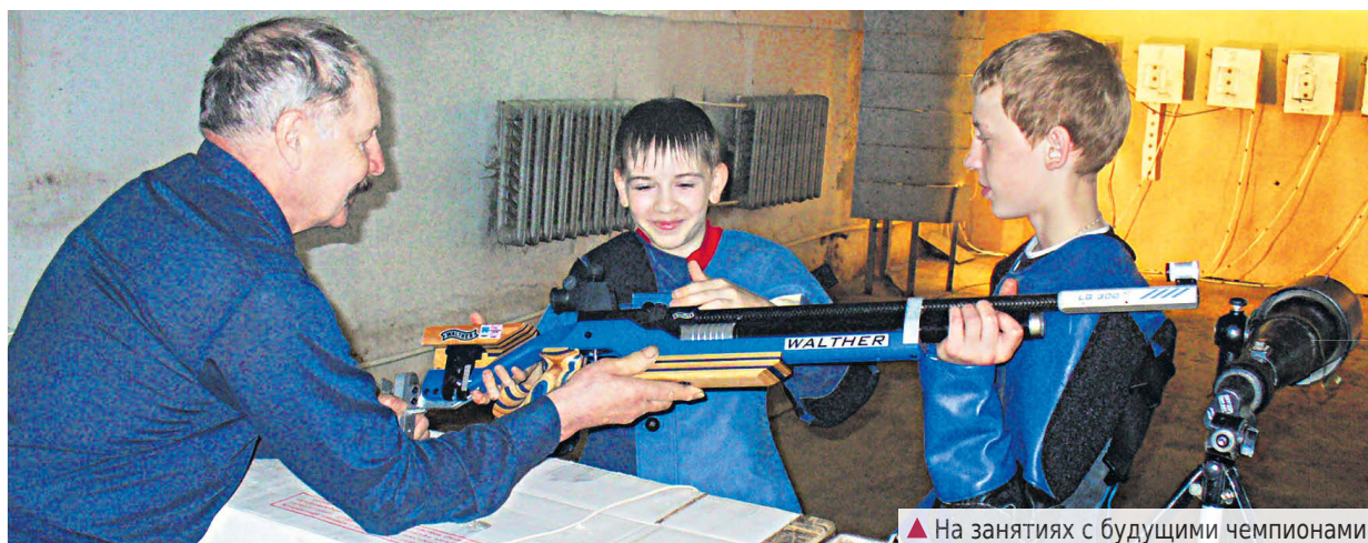
▲ На занятиях с будущими чемпионами