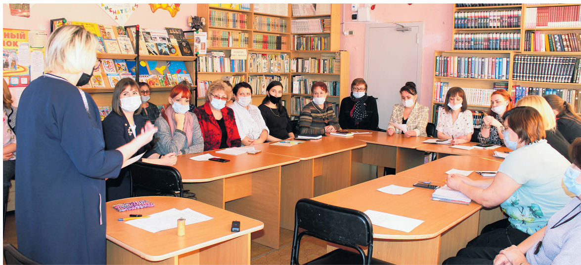
▲ Участники круглого стола

– Современная семья, какая она? Представления о ней бывают самые разные, – отметила Светлана Борисовна. – Для одного это наивысшая ценность, для другого – пустой звук. Ячейка общества, островок безопасности, пережиток прошлого или предел мечтаний – каждый из нас по-своему понимает, что такое семья. Кто-то включает в нее себя и мужа, кто-то гражданского партнера и собаку. Для кого-то она невозможна без родителей и детей. А кто-то видит себя как члена большого рода. В 20 веке классическая семья представляла собой мужчину и женщину в официальном браке, с детьми и общим хозяйством. Сегодня же бывает по-разному. Как понять, семья ли перед нами? Единственный критерий – мнение людей, из которых она состоит. Сложности