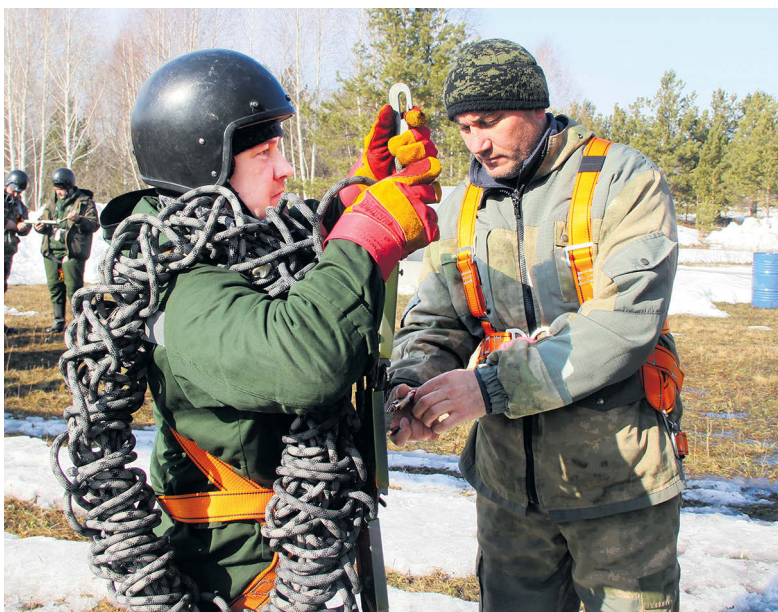
▲ Осмотр десантника на стартовой площадке, проверка запасовки шнура

и курсанты других областных авиаотделений. Конечно, спуск на шнуре (на СУ-Р) из вертолёта МИ-8 – это не прыжок из самолёта АН-2: высота другая, но и здесь каждый спуск – это особый случай. Это проверка себя, своей профессиональной готовности и, если хотите, психологической устойчивости. Молодые ребята не показывают вида, не выказывают своего волнения, но никто не знает, что творится у них в душе, когда курсант подходит к открытой двери и через мгновение спускается