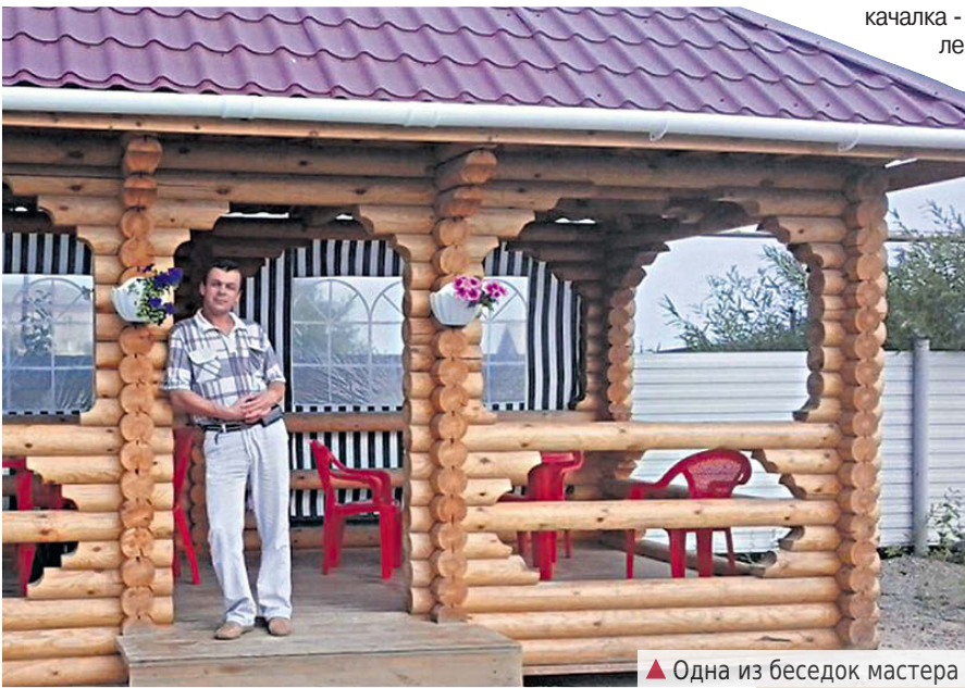
▲ Одна из беседок мастера

Светлана НИКОНОВА