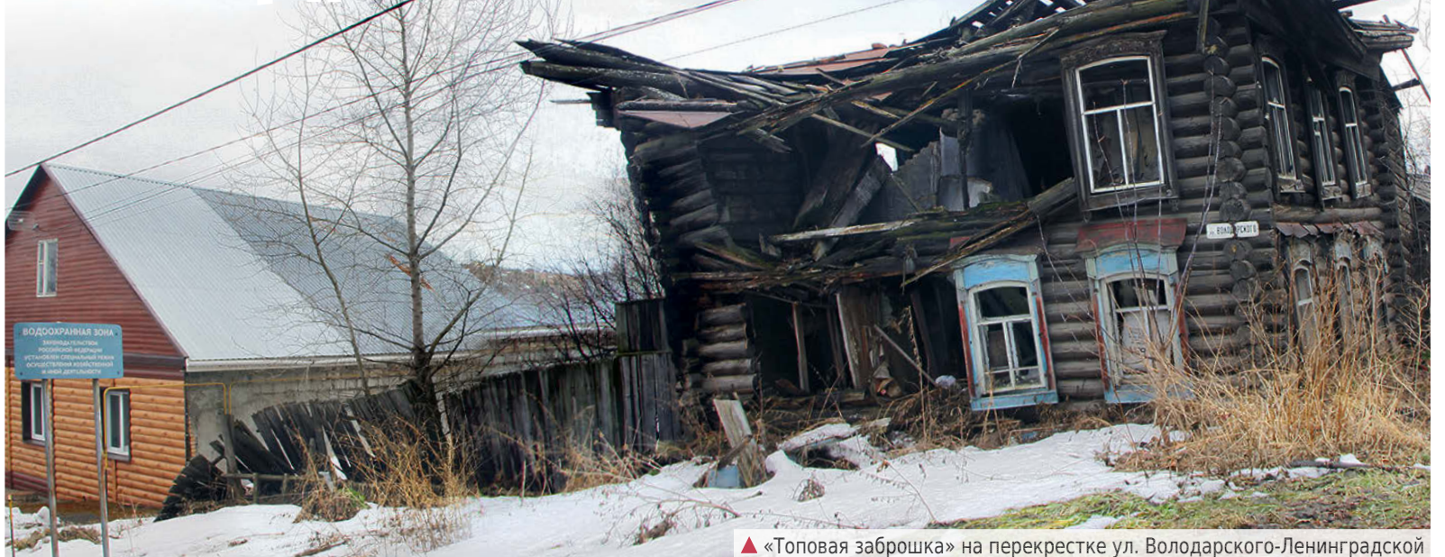
▲ «Топовая заброшка» на перекрестке ул. Володарского-Ленинградской

Есть руины на улицах нашего города, которые десятилетиями мозолят глаз жителям. Например, нет алапаевца, который бы не видел брошенные дома на улице III Интернационала, неподалеку от школы №2. Такие «архитектурные формы» у всех на виду, к ним за последние 30-40 лет все привыкли.