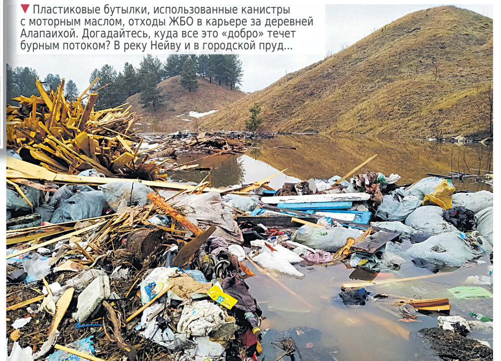
▼ Пластиковые бутылки, использованные канистры с моторным маслом, отходы ЖБО в карьере за деревней Алапахой. Догадываетесь, куда все это «добро» течет бурным потоком? В реку Нейву и в городской пруд...