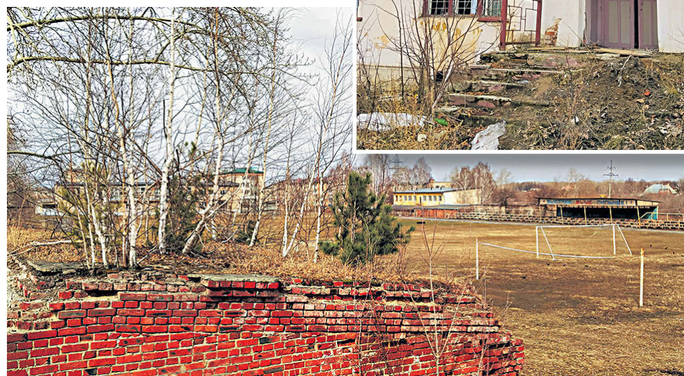
▲ Станкозавод. Вид на поле спорткомплекса ДЮСШ. Пока в Екатеринбурге ударными темпами идет строительство объектов для XXXII Всемирных студенческих игр, десятки спортивных объектов на Урале, которые недофинансировались много лет, нуждаются в реконструкции. Это, пожалуй, не столько экономическая, сколько этическая проблема