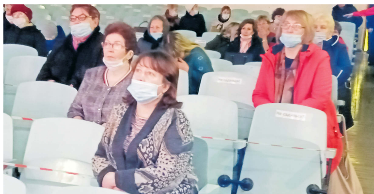
▲ Участники отчётного собрания из посёлка Зырянновский

Пожарной безопасностью на территории управления занимается 76 ПЧ. Зафиксировано за отчётный год возгорание на территории авторемонтного завода и автошколы. Пожаров в посёлке в 2020 году не было зарегистрировано. В целях обеспечения пожарной безопасности посёлка территориальным управлением регулярно проводятся работы по созданию минерализованной полосы в деревне Устьянчики. И каждый год углубляется береговая часть на пирсе со стороны деревни Устьянчики с целью заправки здесь пожарных машин.