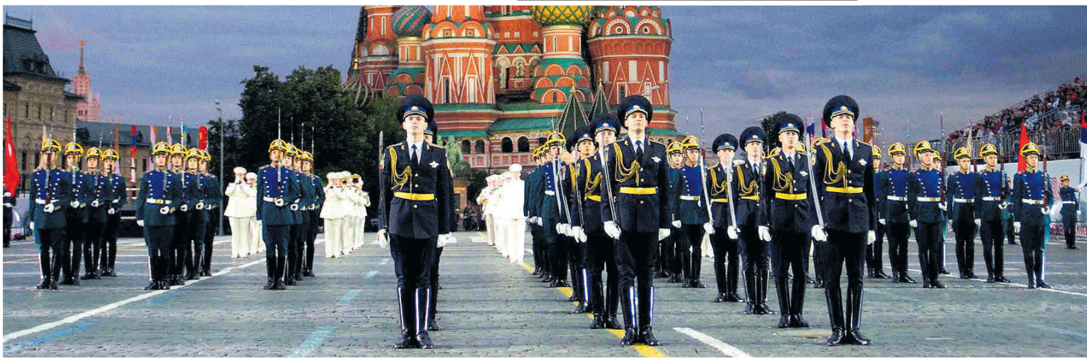
▲ Президентский полк Московского Кремля