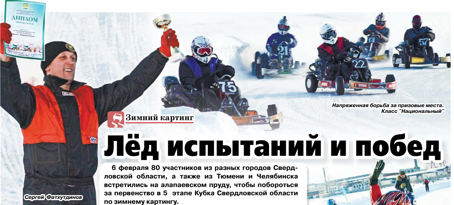
Напряженная борьба за призовые места. Класс "Национальный"