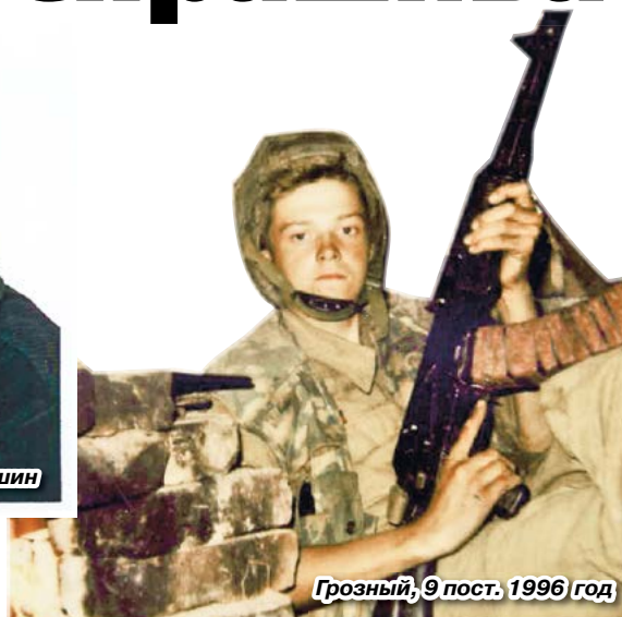
Грозный, 9 пост. 1996 год

В ворота КПП города Ханкалы не пустили, сославшись на отсутствие разрешительных документов. Предупредили, что в 20.00 начинается комендантский час. Любое шевеление – открывают огонь. Урчащие голодом желудки забыли про еду. К счастью, через некоторое время ворота были от-