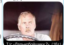
Т/с «Дальнобойщики 2». (16+)