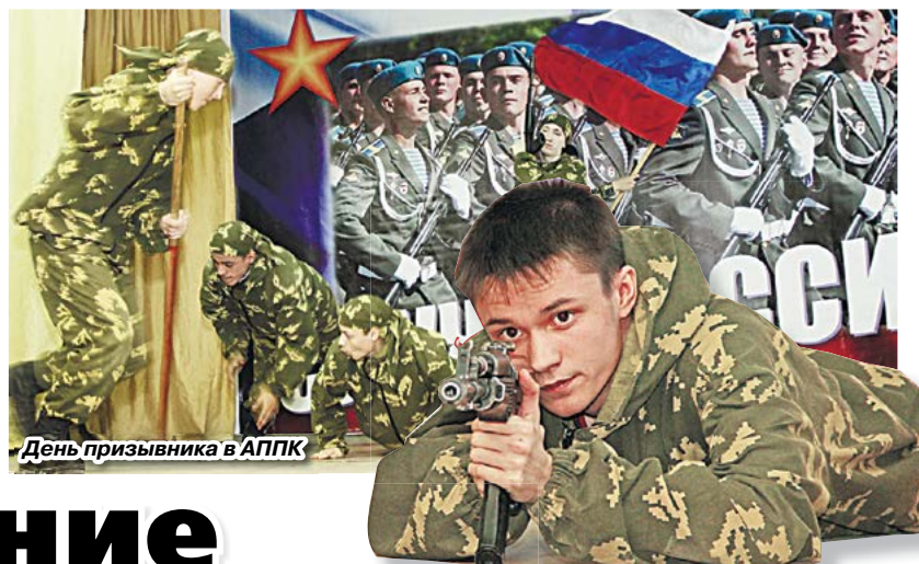
День призвания в АППК