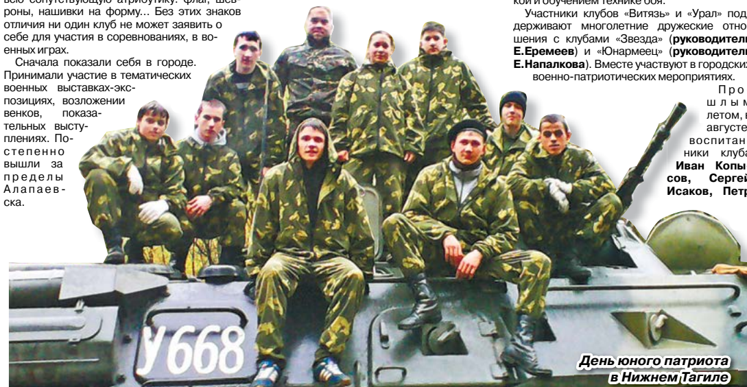
День юного патриота в Нижнем Тагиле