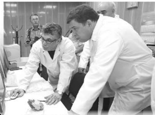
Львиная доля в новом бюджете губернатором Евгением Куйвашевым отводится проблемам медицины и увеличения продолжительности жизни уральцев.

Ожидается, что налоговые и неналоговые доходы областного бюджета в 2014 году составят 166,5 млрд. рублей. Расходы областной казны планируются в сумме 192 млрд. рублей. Дефицит бюджета на-