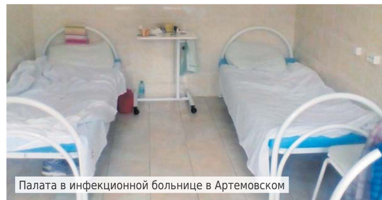
Палата в инфекционной больнице в Артемовском

23 октября вместе с другими пациентами я прибыл в Липовку. Оформление, кардиограмма, размещение. Верхняя одежда – в склад. Осмотр врачом, трехразовое измерение давления, кис-