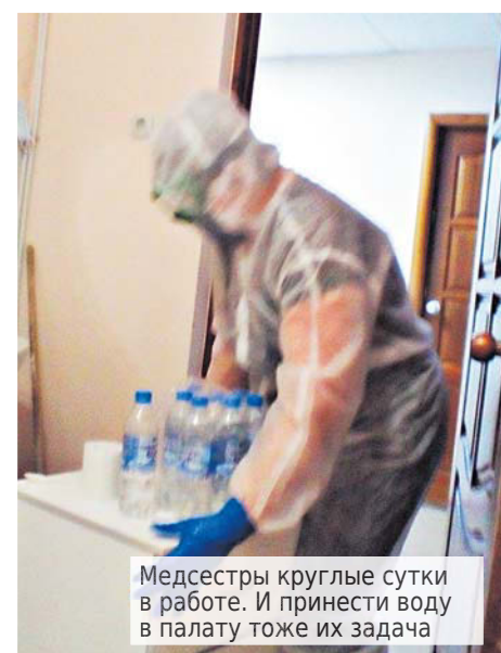
Медсестры круглые сутки в работе. И принести воду в палату тоже их задача

лорода в крови, температуры, трехразовое питание. По общей оценке пациентов, просто отличное.