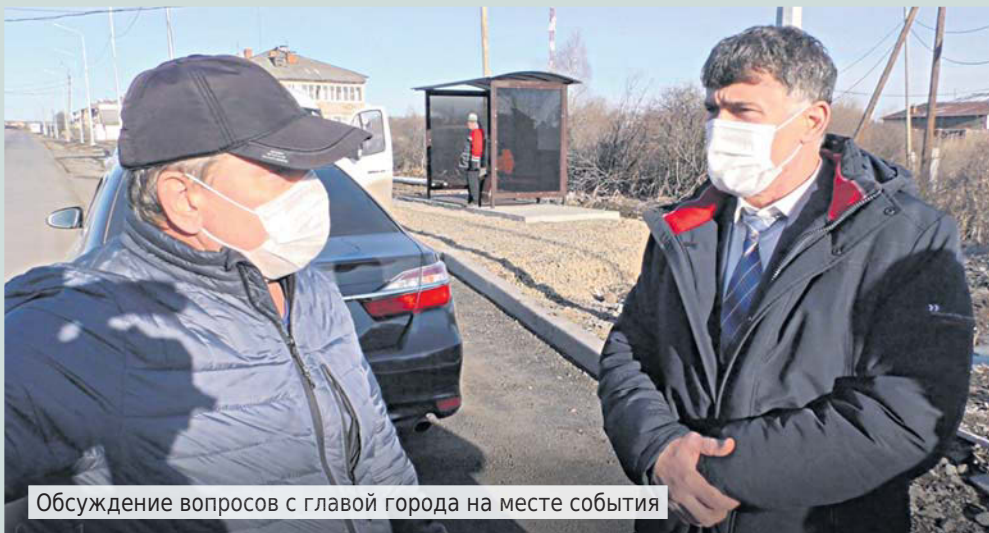
Обсуждение вопросов с главой города на месте события

Дорожное полотно протяженностью 1250 метров, тротуар, современные автобусные павильоны и уличное освещение по периметру улицы. Капитальный ремонт дороги по ул. 3.Космодемьянской в микрорайоне Октябрьский стал самым масштабным проектом этого года, на который из бюджета было выделено 44,6 миллиона рублей.