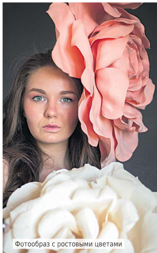
Фотообраз с ростовыми цветами

– Идеи берутся... Часть фото – это социальные темы, например, о вреде курения, о карантине (в связи с событиями этого года). Другая часть фото – это отражение моих увлечений. Например, фото с кораблем на плече, который плывет на этом фото, – это впечатление от театрального фестиваля «Белый парус». Это мой первый спектакль, моя первая серьезная роль, моя первая награда в коллективе. Вместе с этим кораблем мы поплывём дальше – в новые роли, в новую жизнь.