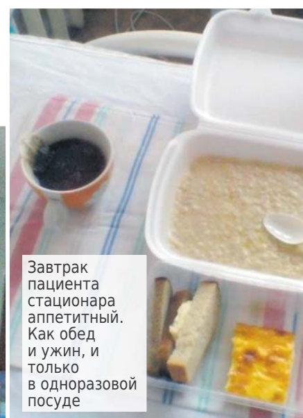
Завтрак пациента стационара аппетитный. Как обед и ужин, и только в одноразовой посуде