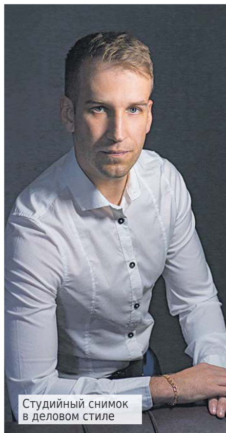
Студийный снимок в деловом стиле