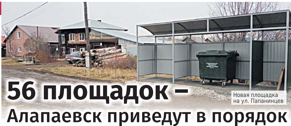
Новая площадка на ул. Папанинцев

Бетонное основание, стационарное металлическое ограждение, спроектированные по всем современным нормам и правилам – на сегодняшний день в Алапаевске установлено уже около сорока новых контейнерных площадок. На выполнение работ по обустройству мест накопления твердых коммунальных отходов в октябре месяце