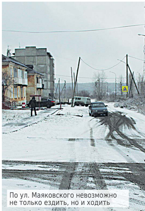
По ул. Маяковского невозможно не только ездить, но и ходить

маршрутам движения общественного пассажирского транспорта. Что касается второстепенных дорог, то здесь, к сожалению, приходится руководствоваться остаточным принципом, поскольку средств на всё и сразу - на ремонт и благоустройство дорог - в местном бюджете недостаточно. И пока эти работы выполняются только на самых проблемных участках. Что касается вопроса ремонта дороги по улицам Маяковского и Бр. Останиных, то обращения взяты на контроль.