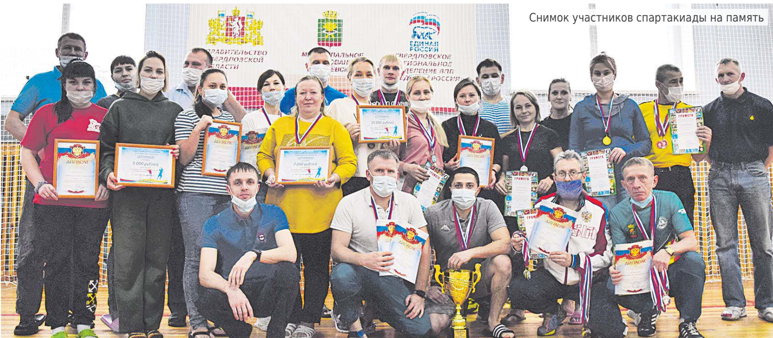
Снимок участников спартакиады на память

Н. БАЙДОСОВА, инструктор-методист УФКС МО Алапаевское