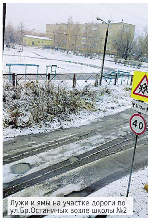
Лужи и ямы на участке дороги по ул. Бр. Останиных возле школы №2

Очень волнует выгул больших собак под окнами домов и на детских площадках. Когда приучат хозяев собак