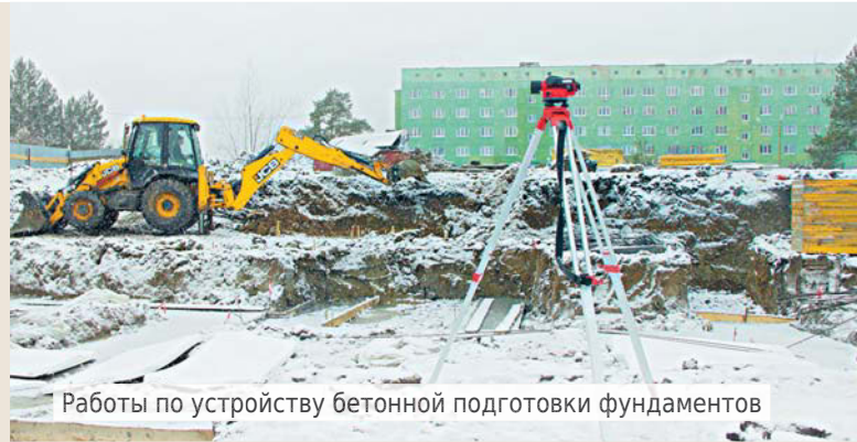
Работы по устройству бетонной подготовки фундаментов

Дом на 45 квартир подрядной организацией планируется построить до ноября будущего года.