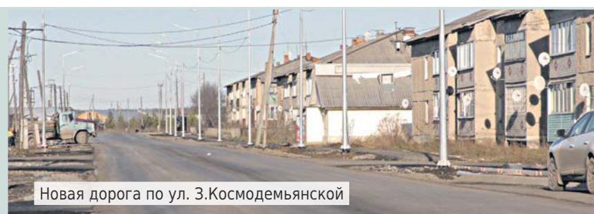
Новая дорога по ул. 3.Космодемьянской

живает стройконтроль согласно муниципальному контракту. Для определения ответственности качества организация берет пробы асфальта и других материалов для лабораторных исследований. Все заме-