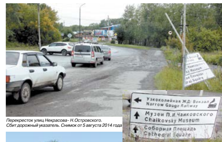
Перекресток улиц Некрасова - Н.Островского. Сбит дорожный указатель. Снимок от 5 августа 2014 года