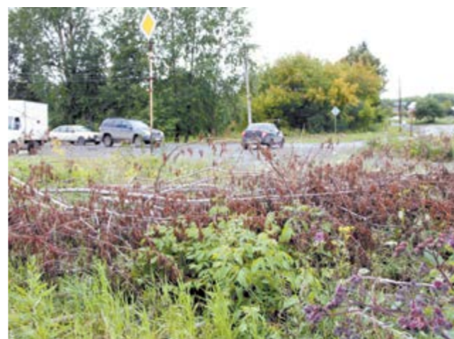
... и на перекрестке улиц Некрасова - Н.Островского