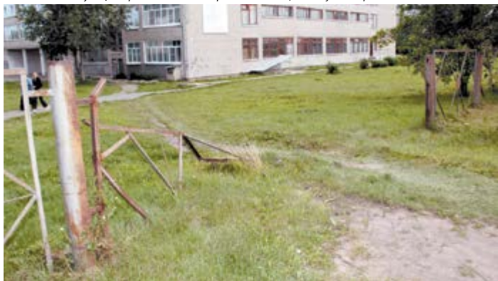
Лихач сломал ограду у школы №2. Кто восстановит?