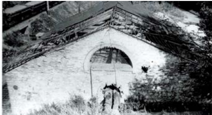
«Молотовая фабрика» в 1970-е годы