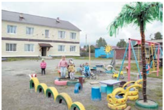
Эту детскую площадку те, кто живет в доме по ул. Школьной, 28, сделали сами. Детям нравится!