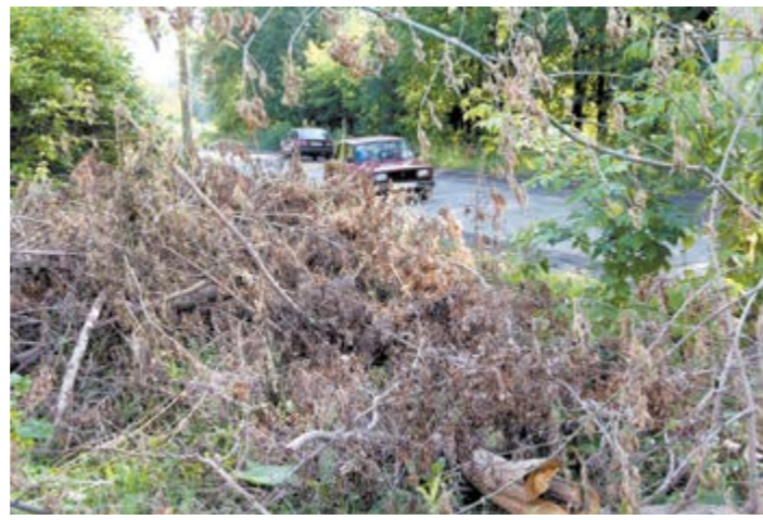
Аналогичная ситуация на улице Береговой...