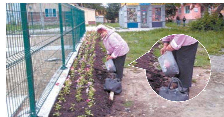
Площадь Победы. Одни цветы сажают, другие выкапывают...