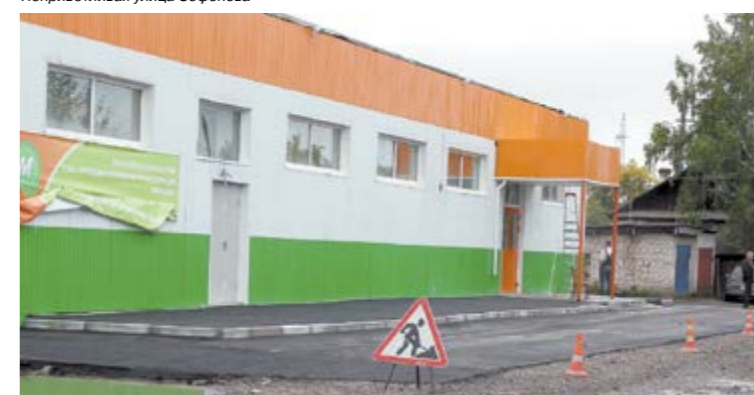
Долгожданная парковка для автомобилей у магазина «Монетка» на улице Говырина