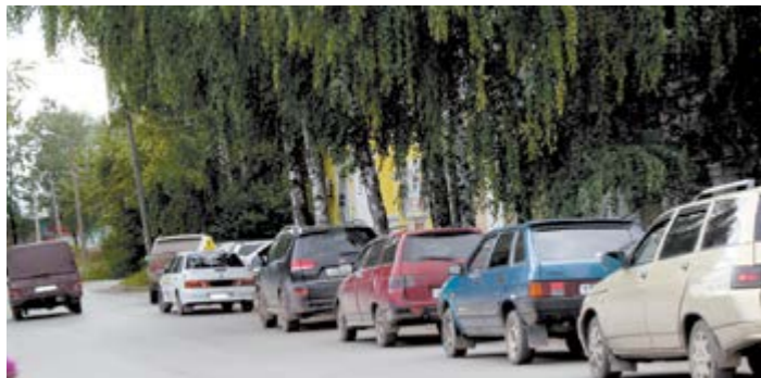
Разъехаться на улице Береговой весьма проблематично, потому как парковки нет

Не за горами празднование юбилейного дня рождения Алапаевска. Все ли готово к празднику? Все ли прибрано и готово к встрече гостей и приветствованию своих родных земляков?