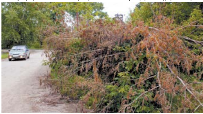
На перекрестке улиц Тюрикова и Бочкарева деревья спилили, а увезти забыли