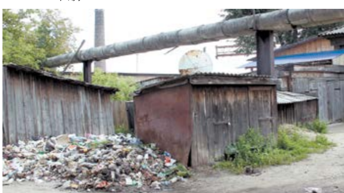
Начало улицы Бр. Останиных. Несанкционированная свалка скоро перерастет надворные постройки