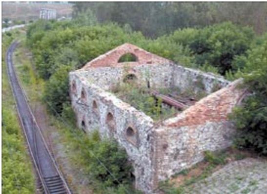
Таким было здание около 6 лет назад

Производительность доменного производства резко возросла: выплавка чугуна в 1725 году достигла 57 тысяч пудов.