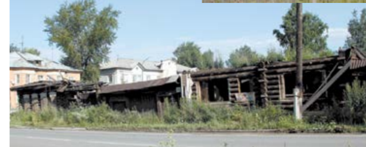
Неприветливая улица Софонова