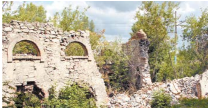
... и нынешнее состояние памятника промышленной архитектуре