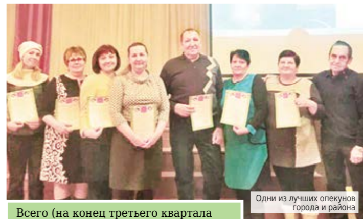
Одни из лучших опекунов города и района

30 ноября в актовом зале школы №4 состоялось традиционное ежегодное собрание опекунов, организованное отделом опеки и попечительства Управления социальной политики по Алапаевску и Алапаевскому району.