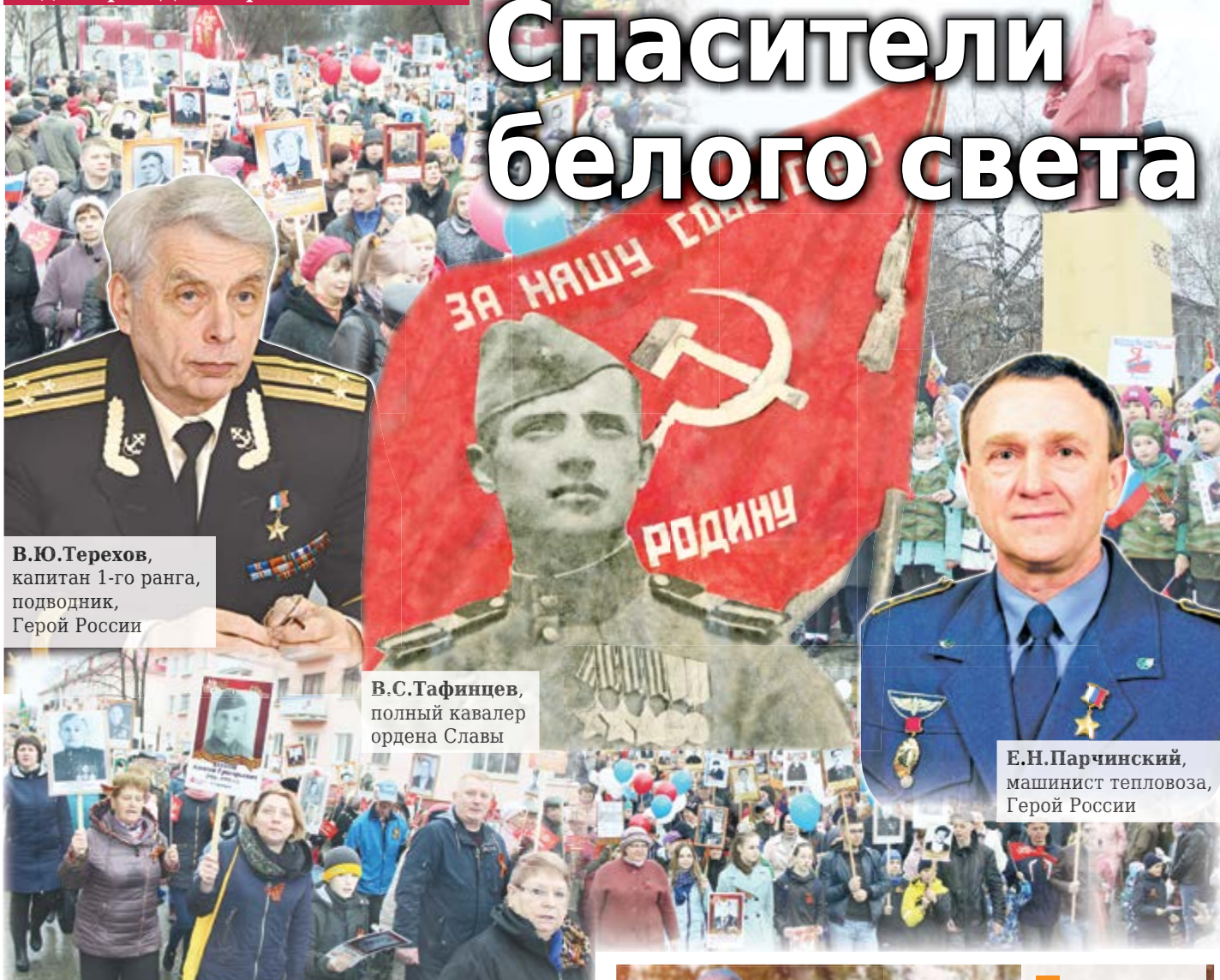
В.Ю.Терехов, капитан 1-го ранга, подводник, Герой России