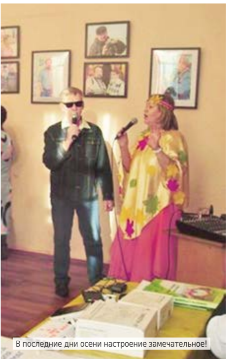
В последние дни осени настроение замечательно!