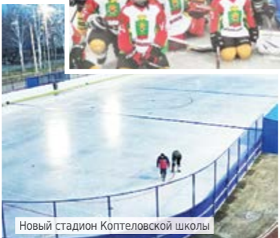
Новый стадион Коптеловской школы