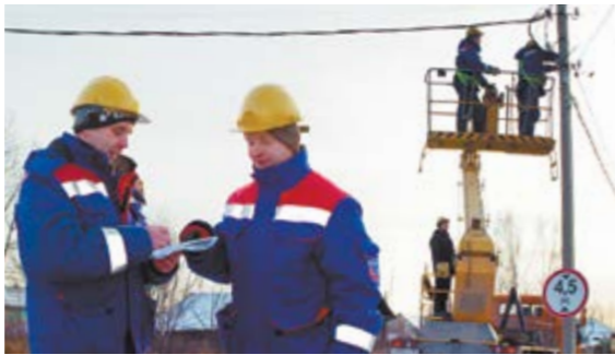
Надлежащем состоянии и замена вышедших из строя ламп. Специалисты МКУ «ДЕЗ» проводят выездные проверки функционирования уличного освещения, в том числе по обращениям жителей и предписаниям ГИБДД.

В марте 2018 года подано всего 175 заявок, выполнено 76, 7, 14 и 21 ноября специалисты выезжали на проверку функционирования уличного освещения, в том числе по обращениям жителей и предписаниям ГИБДД.