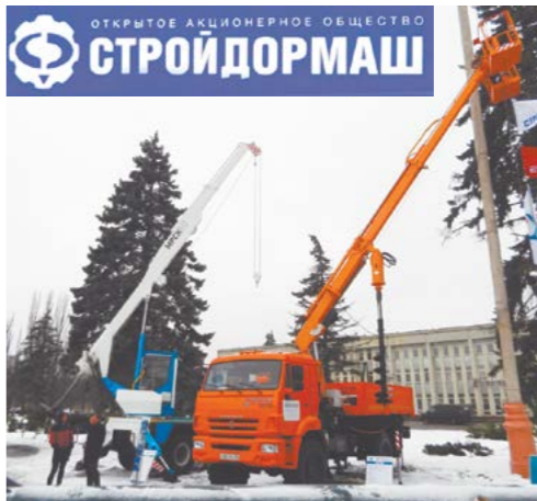
Техника ОАО «Стройдормаш» МКМ-200К и МРСК-512

Усилено организационное начало, в том числе назначен директор по направлению выпуска машин для геологической отрасли. И по сравнению с 2012 годом тут есть некоторое увеличение объема продаж, но опять-таки решающего значения это пока не имеет. Да, геология - особая отрасль, и ей придется в стране освоить знание, но пока никаких инвестиций не вкладывается. У нас были переговоры с представителями названной отрасли. Например, мы вышли на компанию "Приморгеология". По их заявке поставили одну машину. По заверению руководства этой компании, ими планируются достаточно большие закупки продукции Стройдормаша. И опыт должен показать, насколько наша продукция будет востребована. Но это перспектива 2014 года.