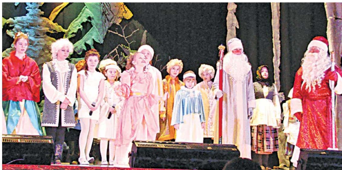
Вот и сказочке конец... Эстафету праздника принимает Дед Мороз