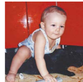
Кот Маркиз из семьи Подойниковых