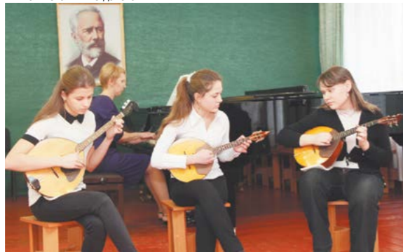
Трио домр: "В краю березовом"