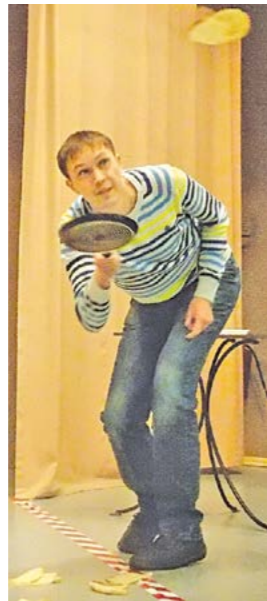
Кто-то ловил блины...