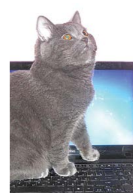
Кот Маркиз из семьи Подойниковых

Победители конкурса "Мой любимец" приглашаются в редакцию "Алапаевской газеты" 23 января в 16.00 по адресу: ул. Пушкина, 66.