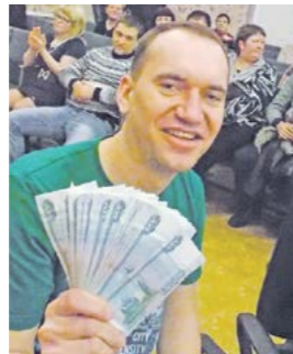
А кто-то считал деньги!