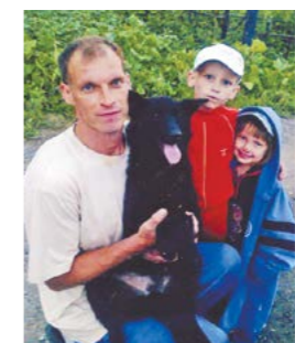
Из стенгазеты «У меня есть лучший друг» ребят из детского сада №38

Конкурсы подготовили С.НИКОНОВА, О.БЕЛОУСОВ