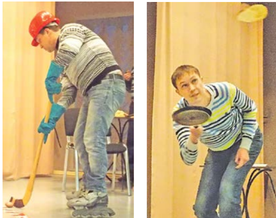
Кто-то играл в хоккей картошкой...