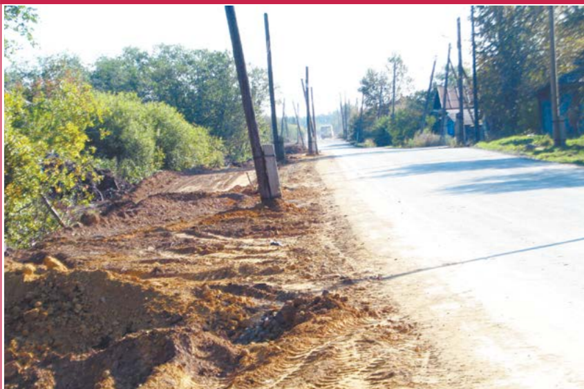
Падающие телеграфные столбы на улице Радищева