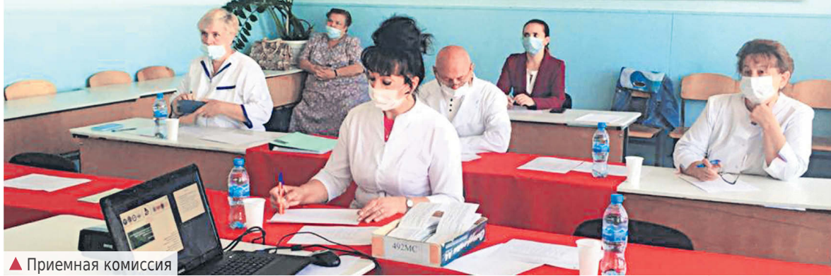
▲ Приемная комиссия