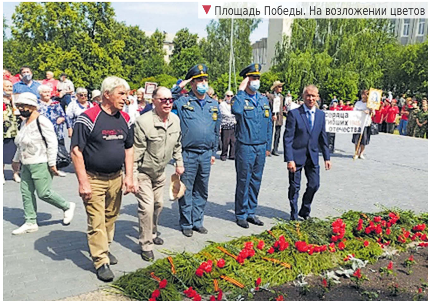
▼ Площадь Победы. На возложении цветов

22 июня 1941 года – одна из самых печальных дат в истории России, начало Великой Отечественной войны. В этом году исполнилось 80 лет с начала той страшной, кровопролитной войны.