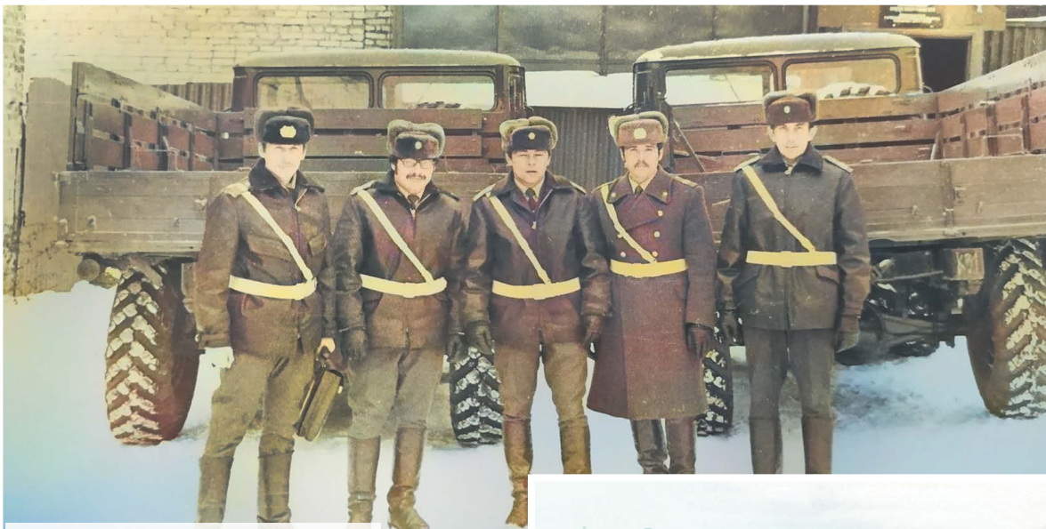
▲ Ветераны ГИБДД города Алапаевска