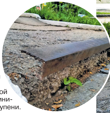
▲ Старые ступени у детской поликлиники давно требовали ремонта. Торчавшая из бетона арматура представляла угрозу для пешеходов с детьми