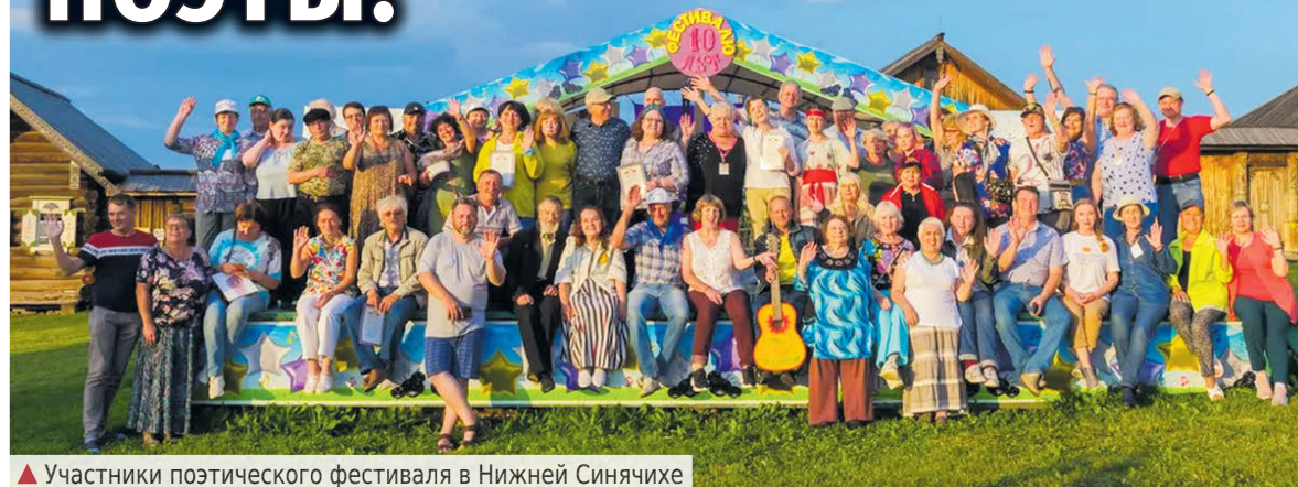
▲ Участники поэтического фестиваля в Нижней Синячихе

Кургана. Алапаевскую территорию представляли поэты из Алапаевска, Алапаевского района и посёлка Махнёво.