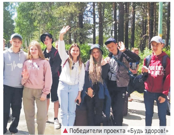
▲ Победители проекта «Будь здоров!»