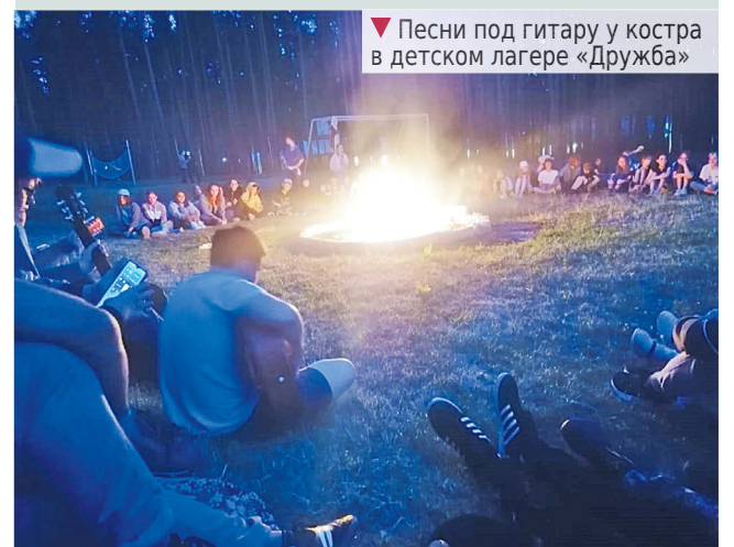
▼ Песни под гитару у костра в детском лагере «Дружба»

Раиса СЕМЕНОВА Снимки предоставлены автором