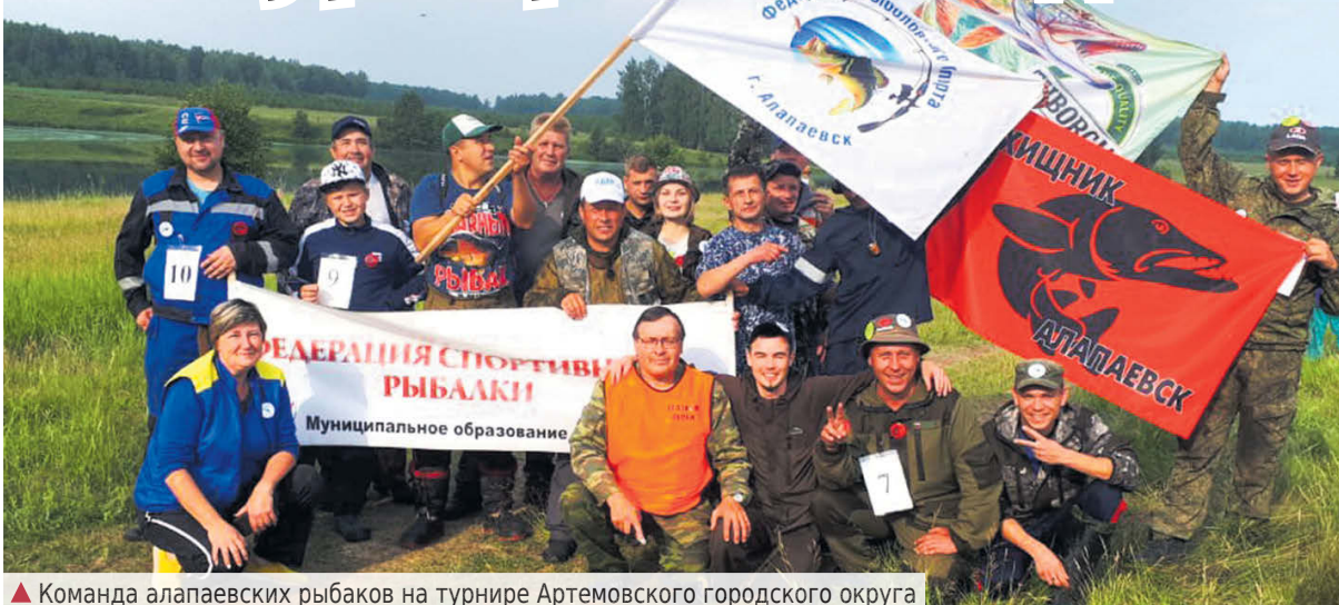
▲ Команда алапаевских рыбаков на турнире Артемовского городского округа

26 июня на традиционный турнир по спортивной ловле Артемовского городского округа выехала команда из 15 алапаевских рыбаков. В турнире принимали участие спортсмены-рыбаки со всей области: из Екатеринбурга, Нижнего Тагила, Артемовского, Ревды и других населенных пунктов.