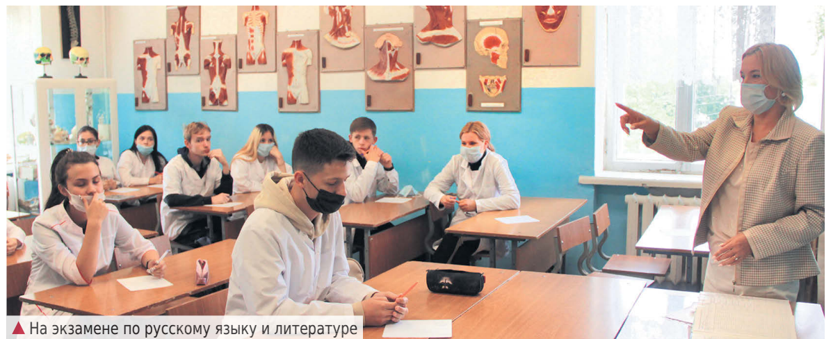
▲ На экзамене по русскому языку и литературе

фикационных работ, а также актуальность рассмотренных тем, которые вызвали живой интерес у присутствующих.