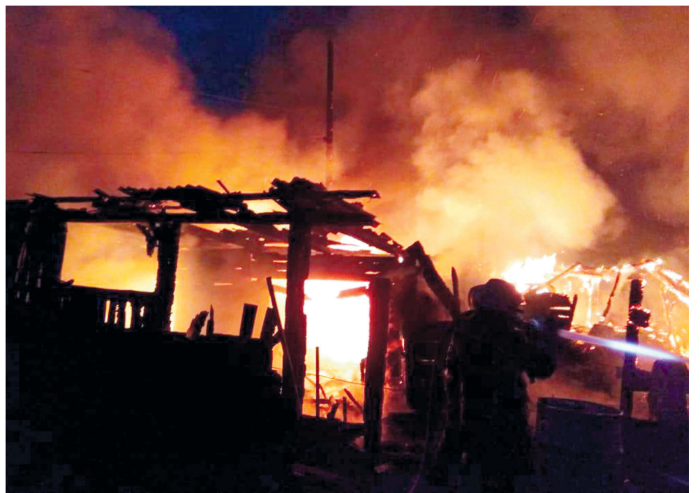
▲ Пожар на улице 123 километр