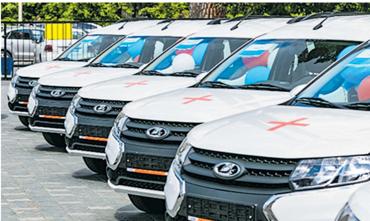
▲ Новые автомобили для врачей 29 муниципалитетов Свердловской области