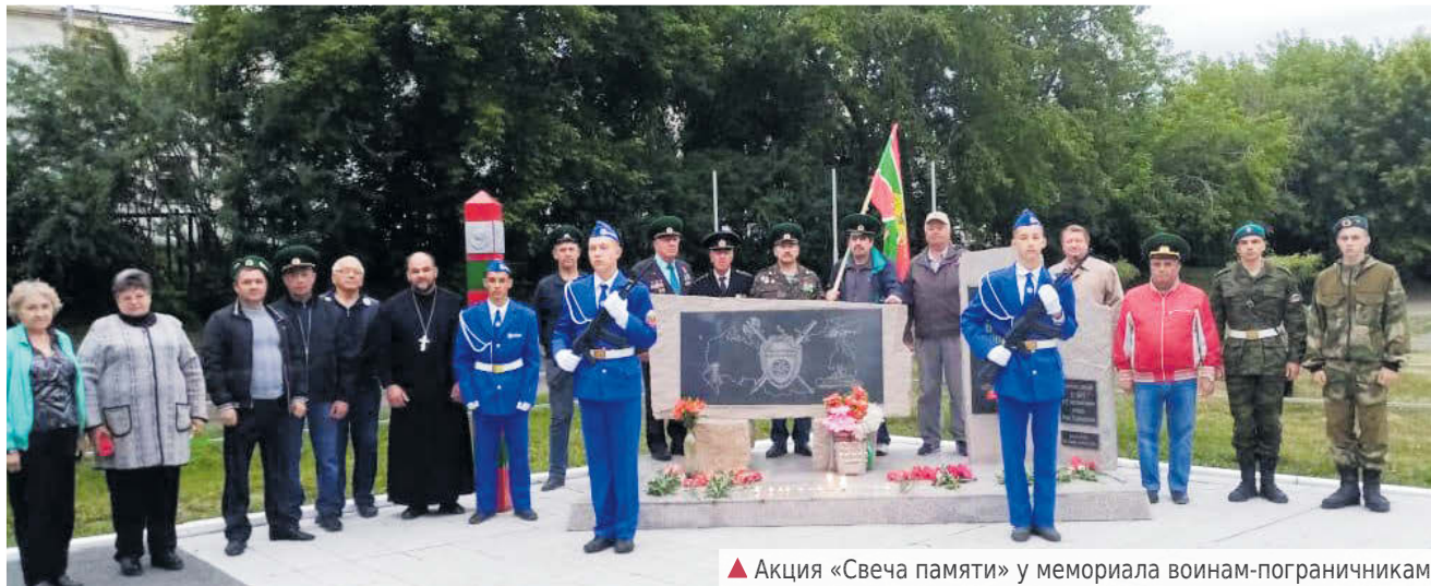
▲ Акция «Свеча памяти» у мемориала воинам-пограничникам