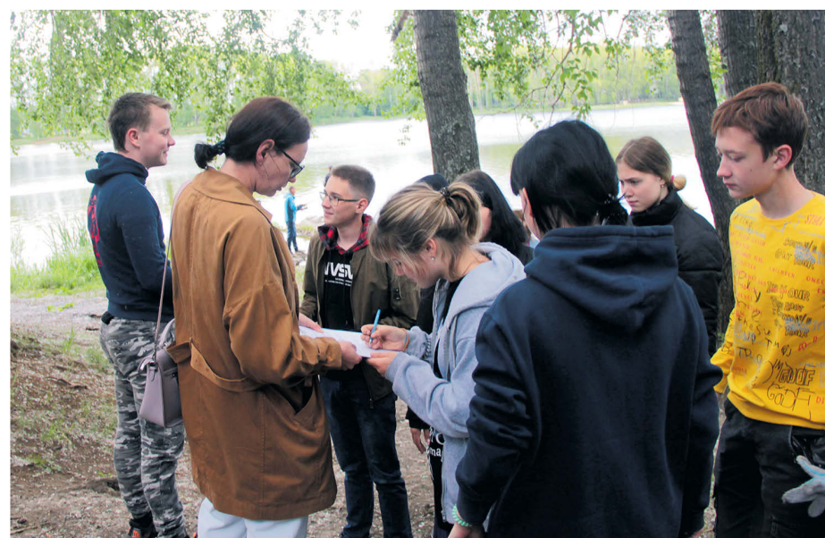
▲ На регистрации бригады