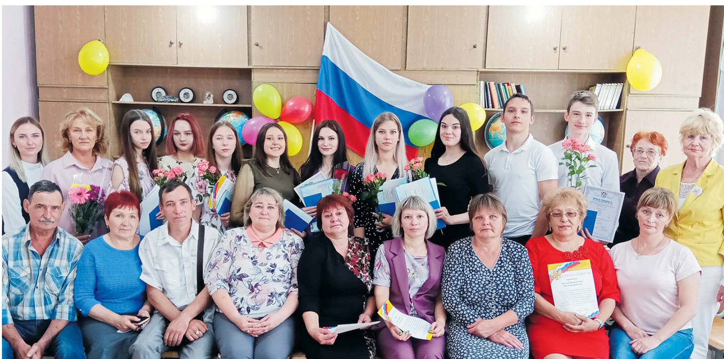
▲ Выпускники школы №5 и их родители