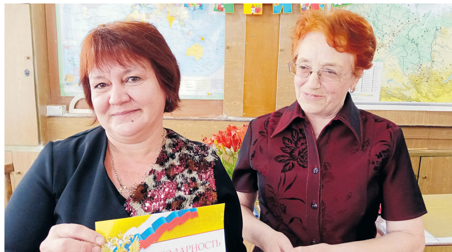
▲ Благодарственное письмо С.М. Дорогастиной

Нина ПЕРЕВОЗЧИКОВА, пресс-центр администрации города