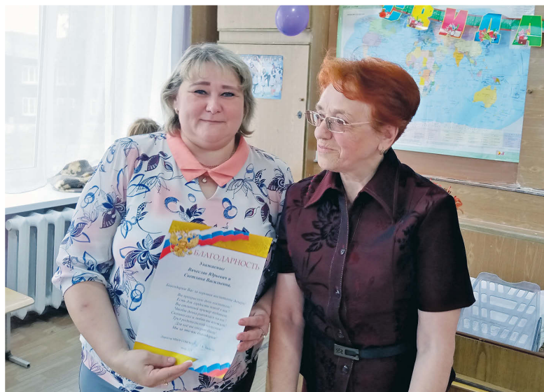
▲ Благодарственное письмо С.В. Белянкиной