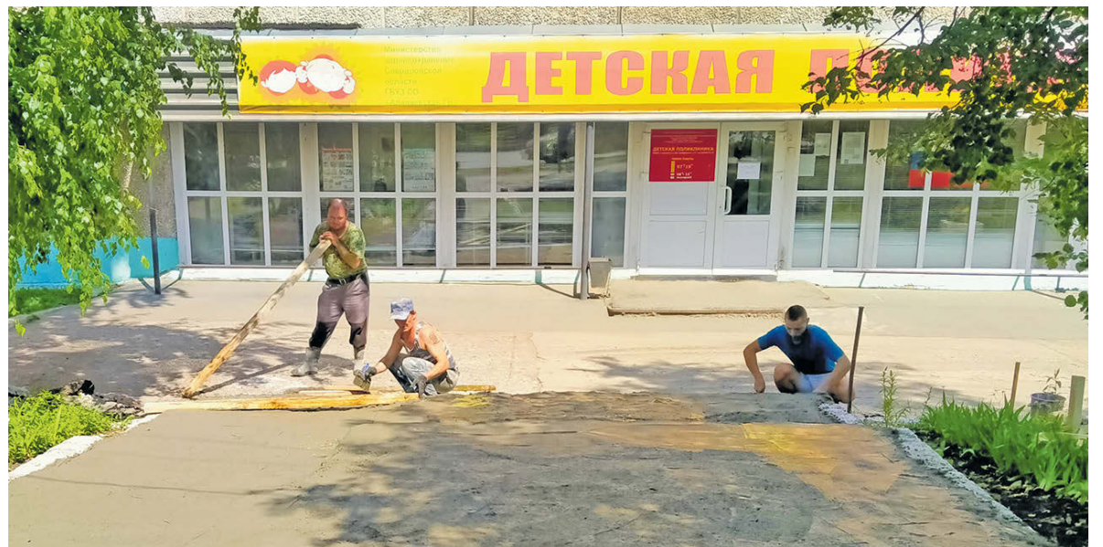
▲ Финальный этап работ