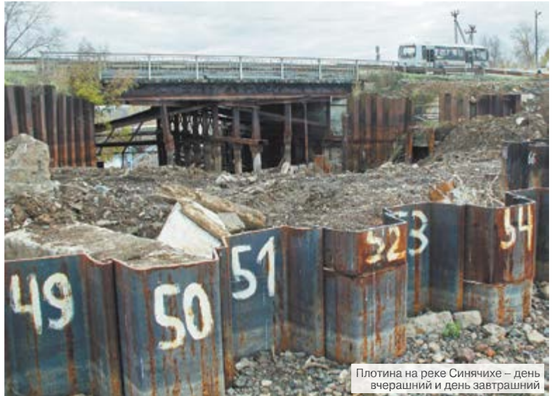
Плотина на реке Синячихе – день вчерашний и день завтрашний

5 октября на плотине проведено выездное заседание, в котором приняли участие представитель Министерства природных ресурсов и экологии РФ О.В. Гетманская , от профильного министерства Свердлов-