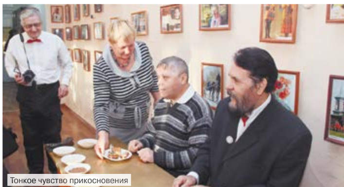
Тонкое чувство прикосновения