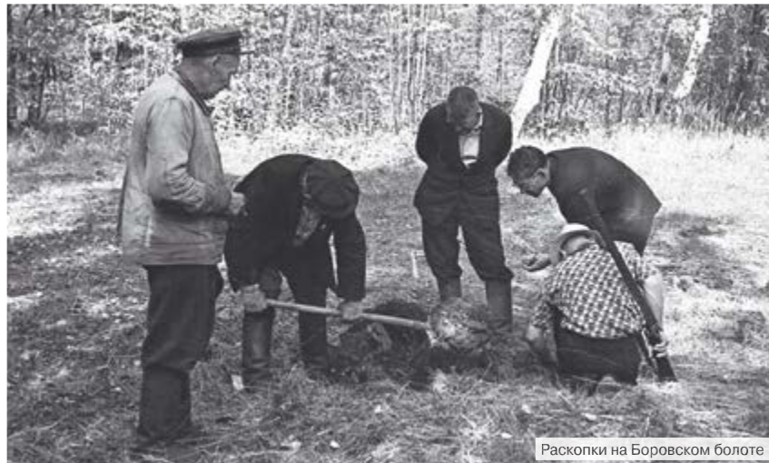
Раскопки на Боровском болоте

Подготовил к публикации О. БЕЛУОСОВ