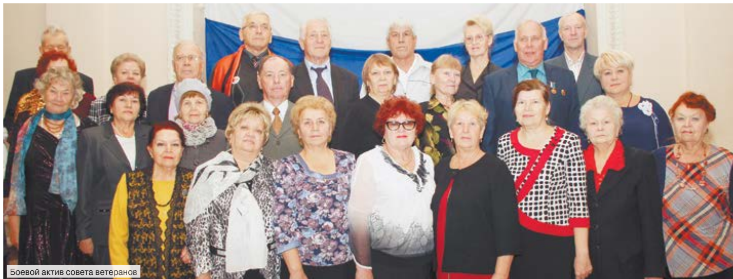
Боевой актив совета ветеранов

Надежда БОРИСИХИНА