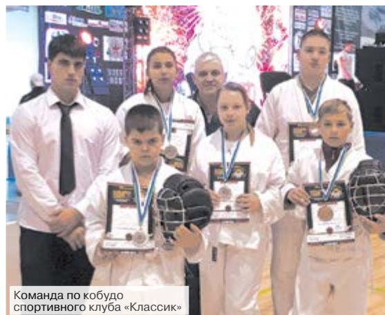
Команда по кобудо спортивного клуба «Классик»