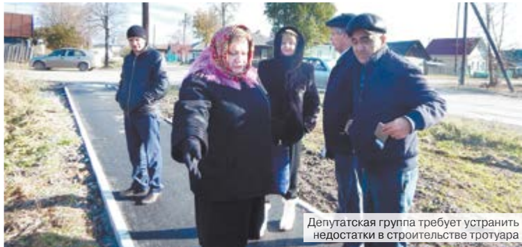
Депутатская группа требует устранить недостатки в строительстве тротуара

В результате этой встречи уже непосредственно на строительстве объекта родился акт предварительной приемки ремонта тротуара по ул.Л.Толстого на участке от ул.Лермонтова до железнодорожного переезда.