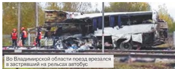
Во Владимирской области поезд врезался в застрявший на рельсах автобус

PS: Пока готовился этот материал, подрядная организация провела благоустроительные работы вдоль всего реконструированного участка тротуара. Но чувство неудовлетворенности работой от проекта до окончания ремонта осталось. Члены рабочей депутатской группы считают недопустимым в дальнейшем со стороны специалистов дирекции единого заказчика планировать ремонт полуфабрикаты. Готовить проекты по ремонту дорог, тротуаров и дворовых территорий следует с учетом всего, что необходимо сделать в полном объеме.