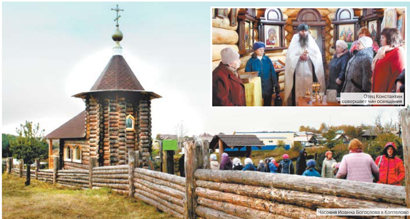
Отец Константин совершает чин освящения