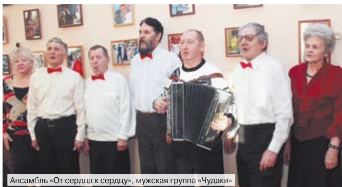
Ансамбль «От сердца к сердцу», мужская группа «Чудаки»