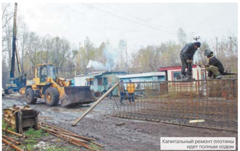
Капитальный ремонт плотины идет полным ходом