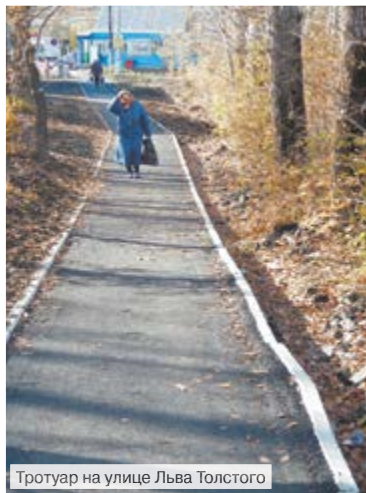
Тротуар на улице Льва Толстого