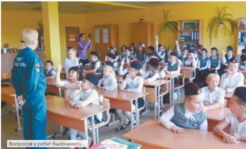
Вопросов у ребят было много...

76 ПСЧ 54 ОФПС по Свердловской области