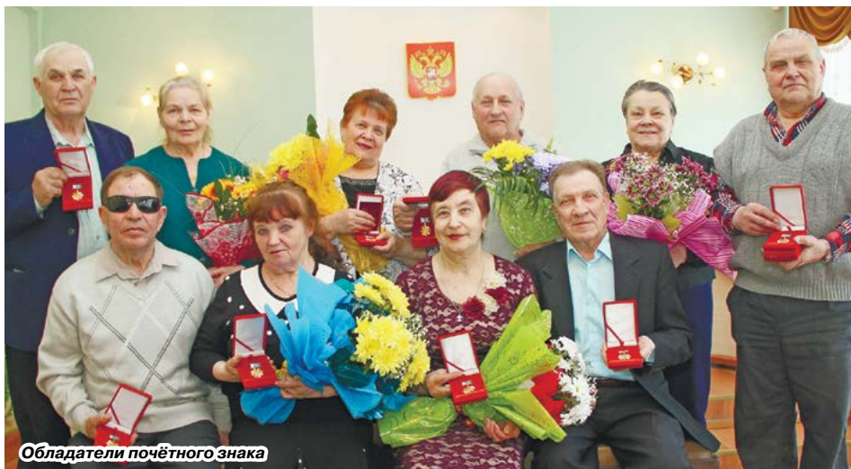
Обладатели почётного знака

С 2007 года 63 женщины, проживающие на территории МО г. Алапаевск, за достойное воспитание своих детей награждены знаком отличия «Материнская доблесть» I степени (10 и более детей), II степени (8-9 детей) и III степени (5-7 детей).