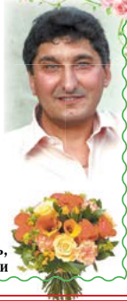
Жена, дочь, зять, внучки

У тебя не просто день рождения - У тебя сегодня юбилей. Ты всегда улыбчивый, весенний. И имеешь множество друзей. Ты всегда достоин уважения. Светлый ум твой поражает взгляд. Пусть же будет радость и веселье, Пусть твои глаза всегда горят.