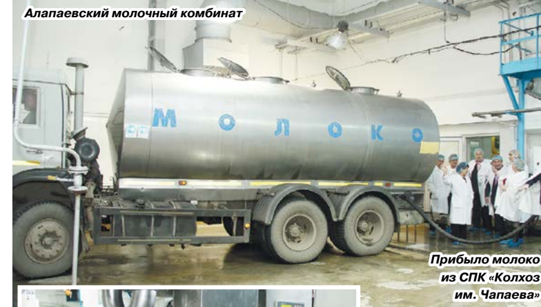
Алапаевский молочный комбинат

Несколько иная ситуация с переработкой молока. Возможно, волею случая Алапаевский молочный комбинат не только сохранен, но активно модернизируется. В результате он сегодня производит высококонкурентную продукцию как по цене, так и по качеству. Молкомбинат готов увеличить объемы переработки практически на 50%, т.е. перерабатывать все производимое на территории Алапаевского района молоко (т.е. порядка 80 т в день). А это