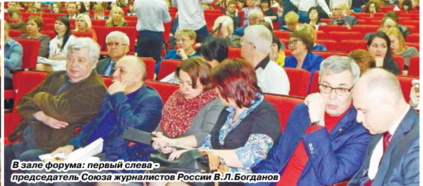
В зале форума: первый слева - председатель Союза журналистов России В.Л.Богданов