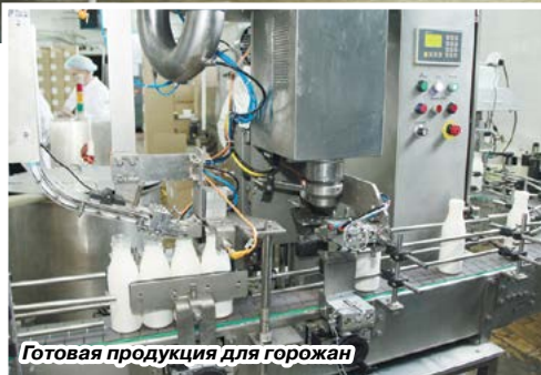
Готовая продукция для горожан

не просто увеличение производства в полтора раза. Это увеличение количества хорошо оплачиваемых рабочих мест (а значит, сокращение безработицы, увеличение покупательской способности населения). Это увеличение отчислений, в первую очередь, в местный бюджет (а это дополнительные деньги на решение наших социальных проблем, коих у нас выше крыши). Это и выгода хозяйствам – чем меньше молкомбинат тратит средств на транспортировку молока, тем больше у него возможностей повысить цену на закупаемое молоко (деньги, получаемые молзаводами от торговли, не резиновые, а работать себе в убыток молкомбинат просто не может).