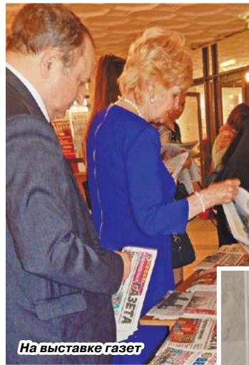
На выставке газет