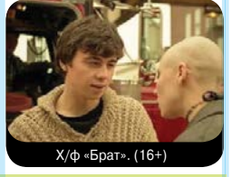
Х/ф «Брат». (16+)