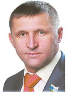
Е.П.Артох, депутат Законодательного Собрания Свердловской области, доверенное лицо Президента РФ

ДОРОГИЕ ЗЕМЛЯКИ! ОТ ВСЕЙ ДУШИ ПОЗДРАВЛЯЮ ВАС С ПРАЗДНИКОМ ВЕСНЫ И ТРУДА!