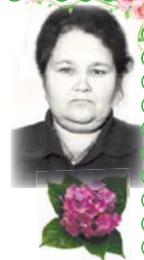
Сыновья, снохи, внуки, родные

Восемьдесят весен за плечами, Восемьдесят славных лет и зим. Мы Вас с юбилеем поздравляем, Пожелать здоровья Вам хотим! Желаем счастья и заботы близких, Пусть в душе царит покой и свет. Спасибо Вам за все, поклон Вам низкий! Желаем долгих и счастливых лет!