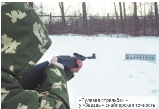
«Пулевая стрельба» – у «Звезды» снайперская точность

Надежда БОРИСИХИНА