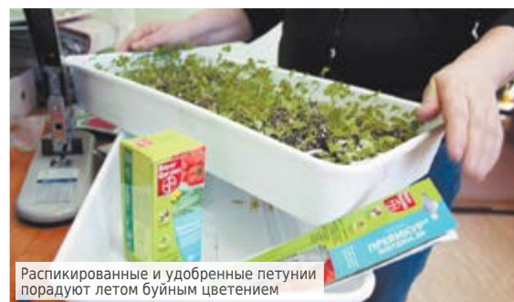
Распикированные и удобренные петунии поражают летом буйным цветением

развивался корень. Подкармливаю рассаду слабым раствором «Фертика люкс» с расчетом одна столовая ложка на ведро. Через месяц после второй пикировки получаем готовую рассаду для открытого грунта.