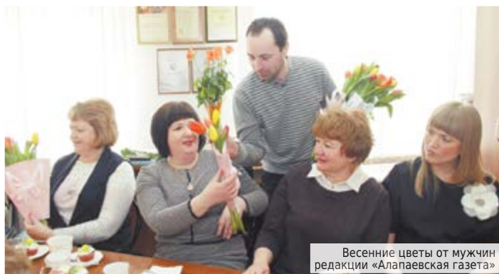
Весенние цветы от мужчин редакции «Алапаевская газета»