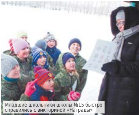
Младшие школьники школы №15 быстро справились с викториной «Награды»