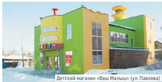
Детский магазин «Ваш Малыш» (ул. Павлова)