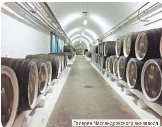
Галерея Массандровского винзавода

Ах, если бы птицей весь Крым облететь, Но времени мало, всего не успеть. А значит, опять я вернусь, чтобы где-то В горах снова праздновать крымское лето.