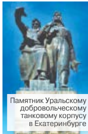
Памятник Уральскому добровольческому танковому корпусу в Екатеринбурге

Поздравляем вас с праздником! Через несколько дней мы отметим 75-ю годовщину создания Уральского добровольческого танкового корпуса, который является примером народного подвига уральцев и золотыми буквами вписаны в историю.