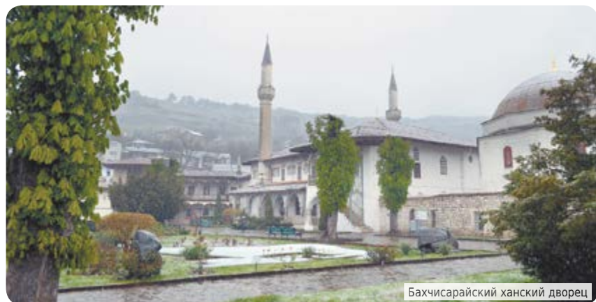
Бахчисарайский ханский дворец