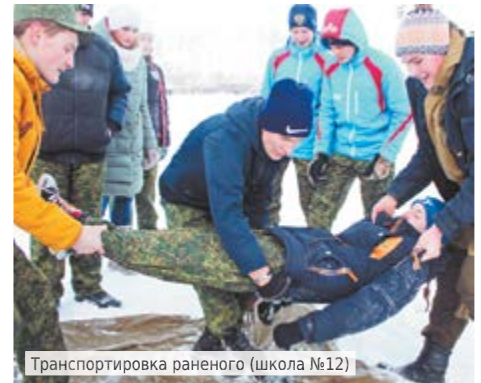
Транспортировка раненого (школа №12)