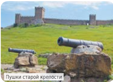
Пушки старой крепости