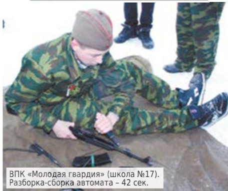
ВПК «Молодая гвардия» (школа №17). Разборка-сборка автомата – 42 сек.