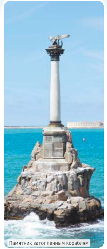
Памятник затопленным кораблям

решились: погода была немножко прохладная. Зато увидели лебедя, который в одиночестве плавал около берега. Лебедь совершенно не боялся нас и с удовольствием подплыл в ожидании угощения.