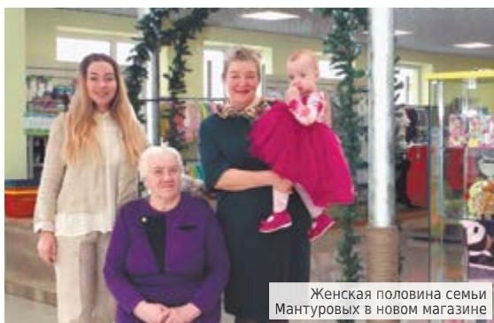
Женская половина семьи Мантуровых в новом магазине

Мечтаю открыть развивающую студию выходного дня в новом магазине. Пусть у родителей будет хотя бы два часа свободного времени в выходной день, а у детей возможность получить полезные знания, развить творческие способности. Хочу поставить детские аттракционы, чтобы получился целый торговоразвлекательный комплекс для детей. Я сама мама и бабушка и сталкивалась с проблемой, чем развлечь детей в выходной день. Проблема детского досуга в городе актуальна, и мы будем работать в этом направлении. У дочери трое ребятишек: старшему 13 лет, а младшим близнецам чуть больше года. Все свободное время я посвящаю своим внукам. Поэтому про-