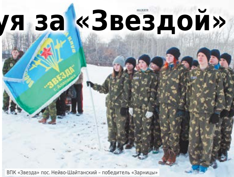
ВПК «Звезда» пос. Нейво-Шайтанский – победитель «Зарницы»

21 февраля на стадионе «Центральный» состоялась военно-спортивная игра «Зарница». В соревновании приняло участие 13 школьных команд Алапаевского отделения Всероссийского военно-патриотического движения «Юнармия»