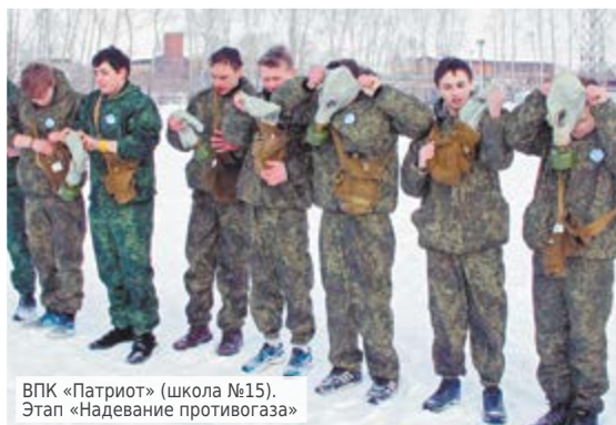
ВПК «Патриот» (школа №15). Этап «Надевание противогаза»