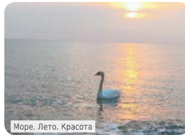
Море. Лето. Красота