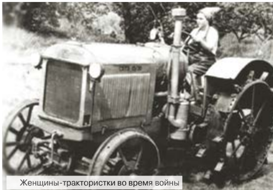
Женщины-трактористки во время войны