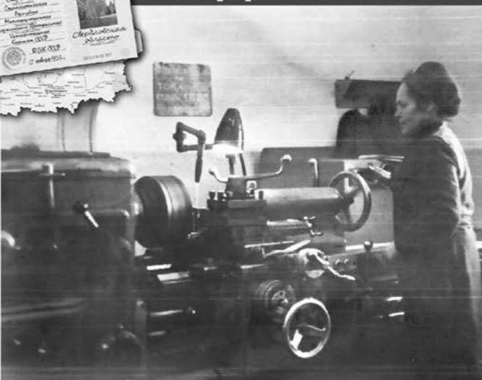
В дремучести человек догадался, что кусок дерева или кости можно усовершенствовать, среза лишнюю часть. Другой работник вращал ось с закрепленной заготовкой. И лишь в начале XVIII века был изобретен оригинальный токарный станок. В 70-80 годах XX века А.М.Федоровских работала вот на таком станке - свидетельствует фотография тех лет.