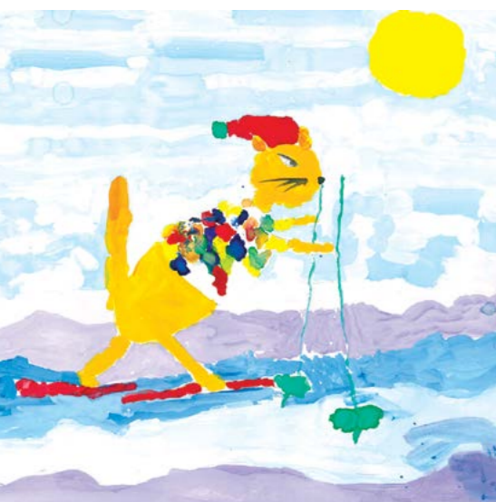
Материалы подготовила Т.ХАБИУЛОВА