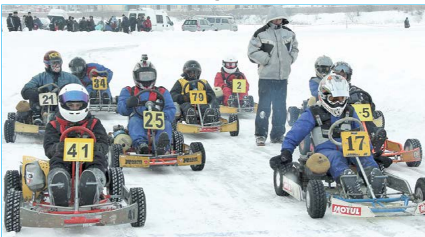
Эти отважные ребята на маленьких автомобильчиках...

18 января, лед алапаевского пруда. Веер снежной крошки накрывает болельщиков с головами до ног, пробирается во все складки одежды. Окресав борт трассы, натужно ревущий юркий карт вновь набирает скорость. Это четвертый этап открытого межрегионального кубка Свердловской области по зимнему картингу.