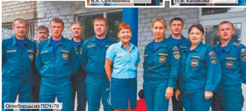
Огнеборцы из ПЧ-76