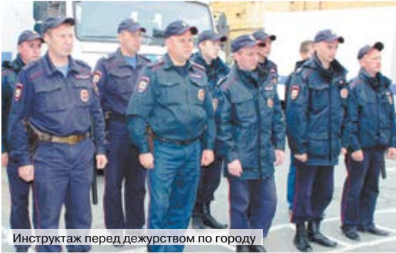
Инструктаж перед дежурством по городу