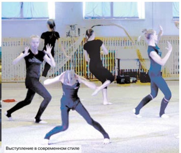
Выступление в современном стиле