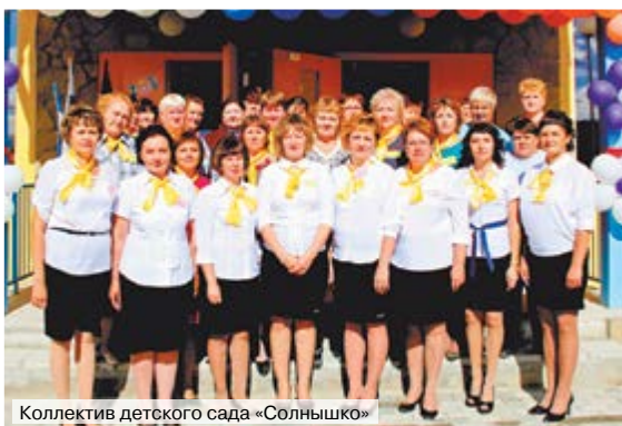
Коллектив детского сада «Солнышко»