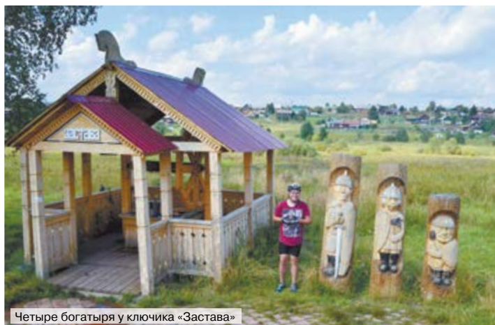
Четыре богатыря у ключика «Застава»