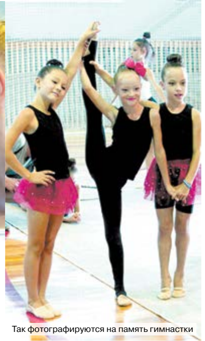
Так фотографируются на память гимнастки