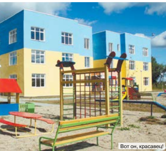
Вот он, красавец!

А ведь ещё полтора года назад, как сказал перед тем, как вручить