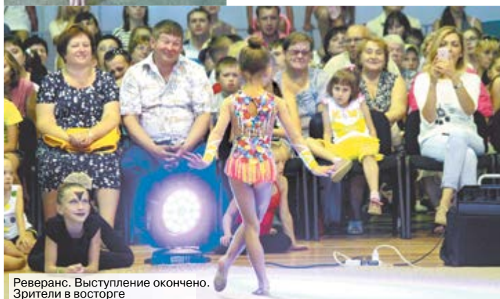
Реверанс. Выступление окончено. Зрители в восторге