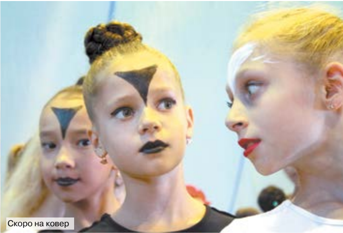
Скоро на ковер