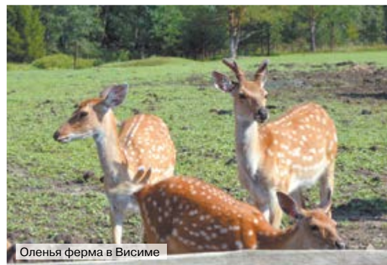
Оленья ферма в Висиме