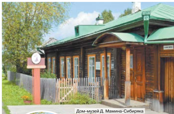
Дом-музей Д. Мамина-Сибиряка