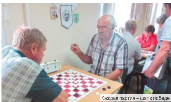
Каждая партия – шаг к победе