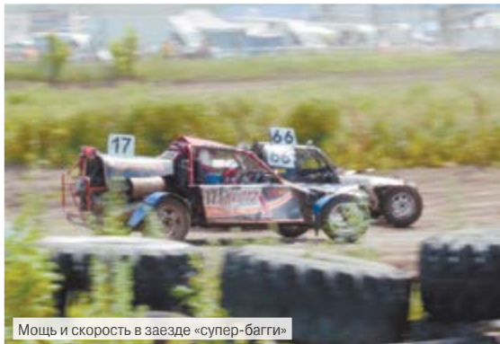
Мощь и скорость в заезде «супер-багги»

По отзывам участников, членов судейской коллегии и официальных гостей гонок, соревнования прошли на высоком организационном и профессиональном уровне. Необходимо отметить, что судейство было честное и беспристрастное, так как в составе судейской коллегии были мастера спорта международного класса, чемпионы России прошлых лет – представители различных городов России, не представлявших на данных соревнованиях своих участников. В группе официальных гостей был наблюдатель от Российской автомобильной фе-