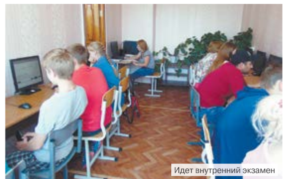
Идет внутренний экзамен

гашению задолженности по заработной плате.