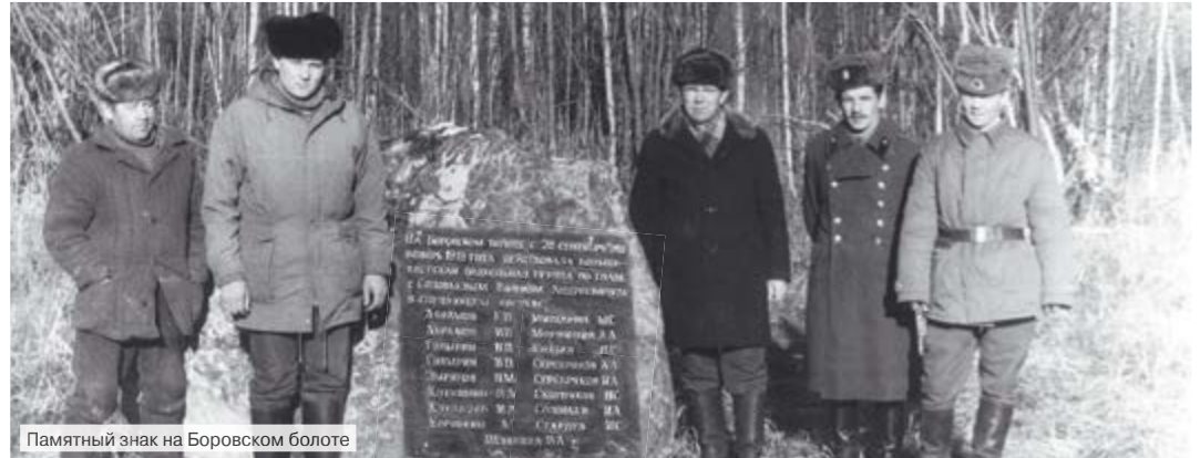
Памятный знак на Боровском болоте

Всё приготовленное имущество приходилось возить под брезентом, в основном, по вечерам и рано утром, вся окружающая обстановка заставляла быть начеку, приходилось основательно маскировать перевозку, маскироваться и самим. Следует отметить один случай, который относится к самому