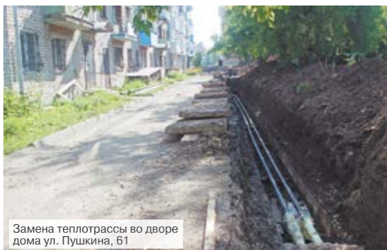
Замена теплотрассы во дворе дома ул. Пушкина, 61