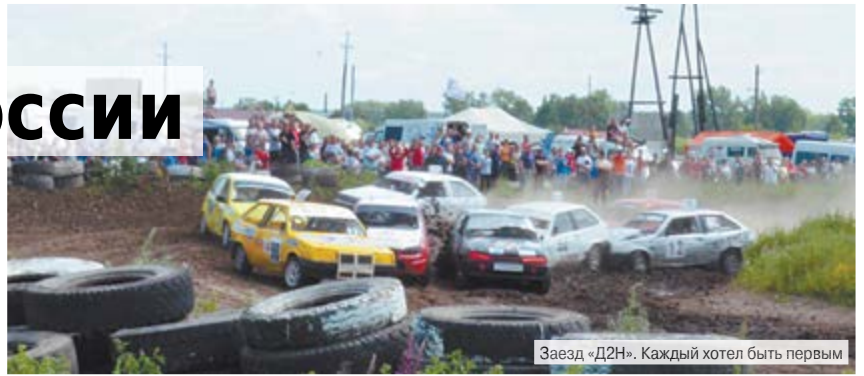
Заезд «Д2Н». Каждый хотел быть первым

Около шестидесяти профессиональных автогонщиков приняли участие в очередном этапе чемпионата России, проводимом на автомобильно-спортивной гоночной трассе Алапаевска.