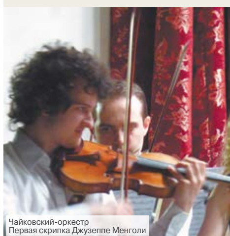
Чайковский-оркестр Первая скрипка Джузеппе Менголи

И по-другому уже не может быть. Ведь Алапаевск сейчас для всего музыкального мира – это город Чайковского.