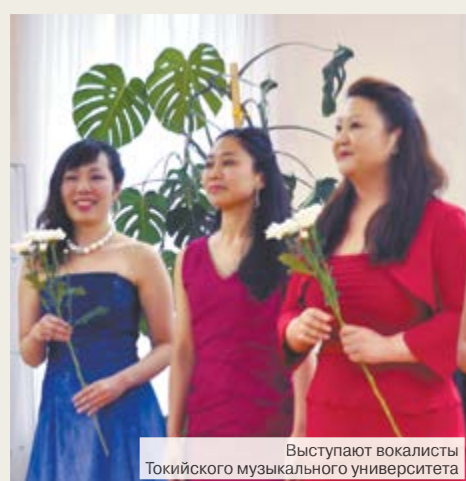
Выступают вокалисты Токийского музыкального университета

8 и 9 июля алапаевцы стали очевидцами музыкального чуда – концертов Чайковский-оркестра и выпускников-вокалистов Токийского музыкального университета.