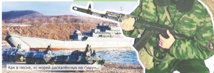
Как в песне, «с морей раскаленных на сушу»...