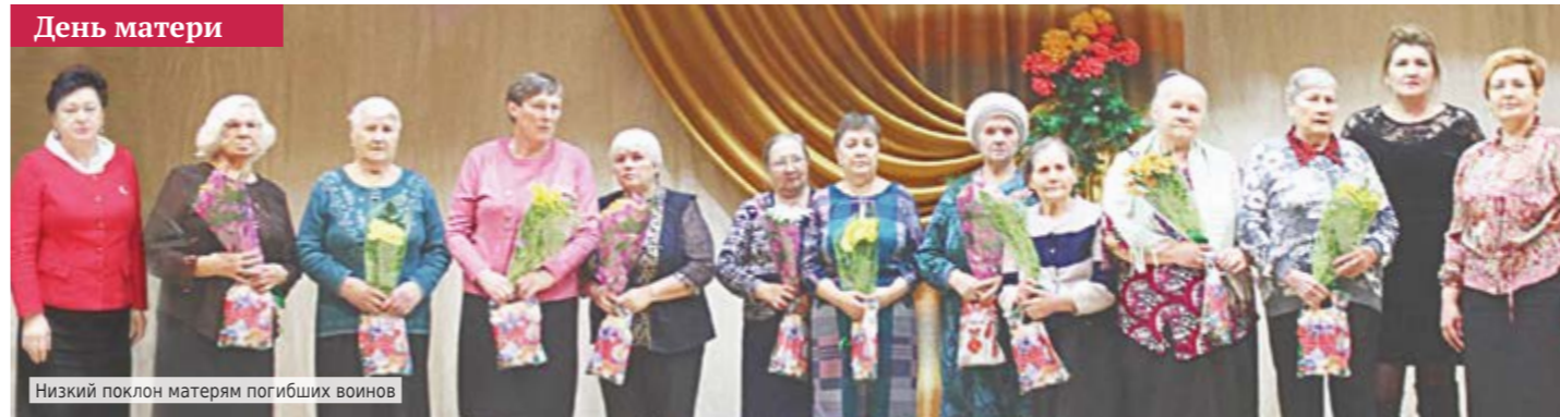
Низкий поклон матерям погибших воинов