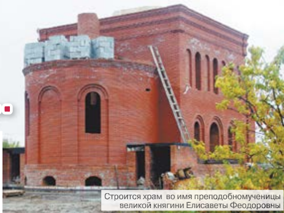
Строится храм во имя преподобномученицы великой княгини Елисаветы Феодоровны

– Когда я приехала сюда, мне предложили сделать ремонт за большую сумму денег. Но мне