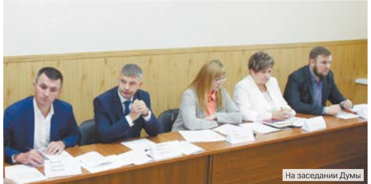
На заседании Думы