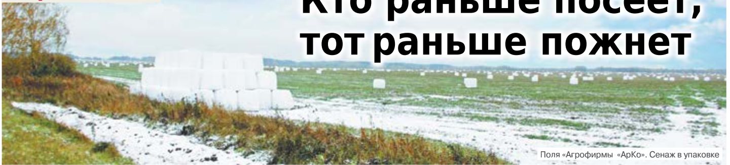
Поля «Агрофирмы «АрКо». Сенаж в упаковке