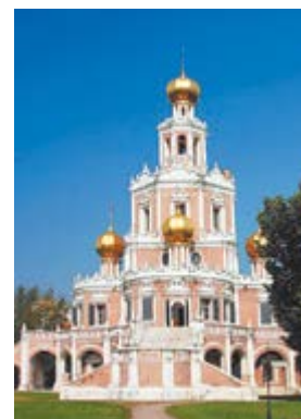
Храм Покрова в Филях