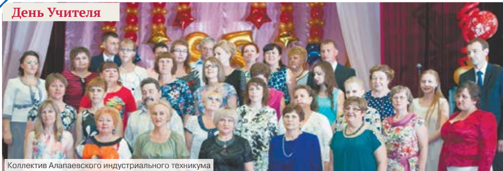
Коллектив Алапаевского индустриального техникума