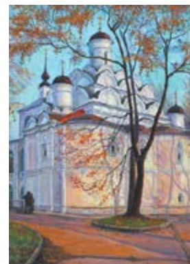
Храм Покрова в Рубцове