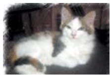
Кошечка. Возраст примерно 4 мес. Тел. 8-912-202-59-08