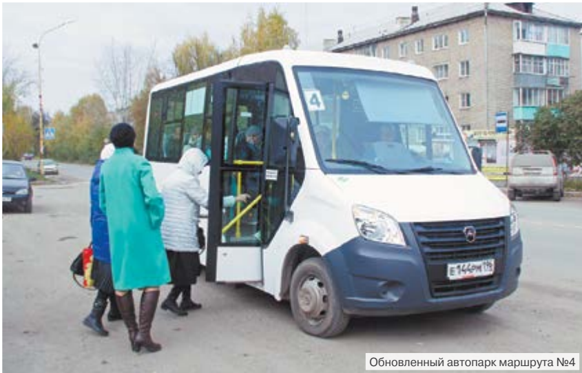
Обновленный автопарк маршрута №4

Алапаевцы, конечно же, обратили внимание на появление в городе новых, более комфортабельных, чем прежние маршрутки, отечественных автомобилей ГАЗель NEXT. В черте города они ходят, например, по маршрутам №4 (Мужества – Сангородок) и №9 (АГБ – Сангородок) – с двух разных направлений по центру города.