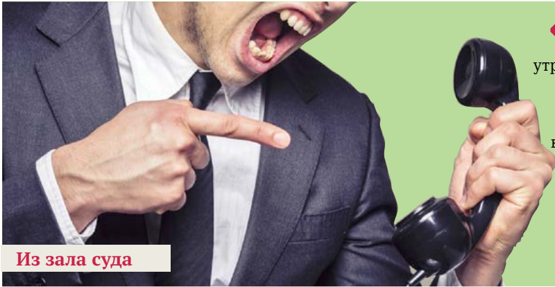
Из зала суда

« Должник был вынужден долго поправлять утраченное здоровье вследствие травм. Он также был лишен автомобиля и документов: паспорта, военного билета, водительского удостоверения, паспорта на транспортное средство, страхового полиса ОСАГО и т.д. Всем незаконно завладел Шариков... »