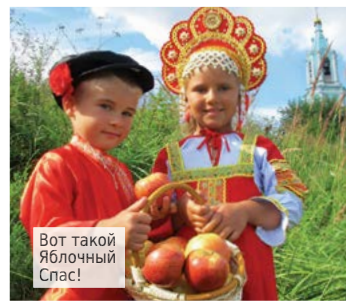
Вот такой Яблочный Спас!

Праздник получился очень весёлым, атмосферным и даже немного сказочным.