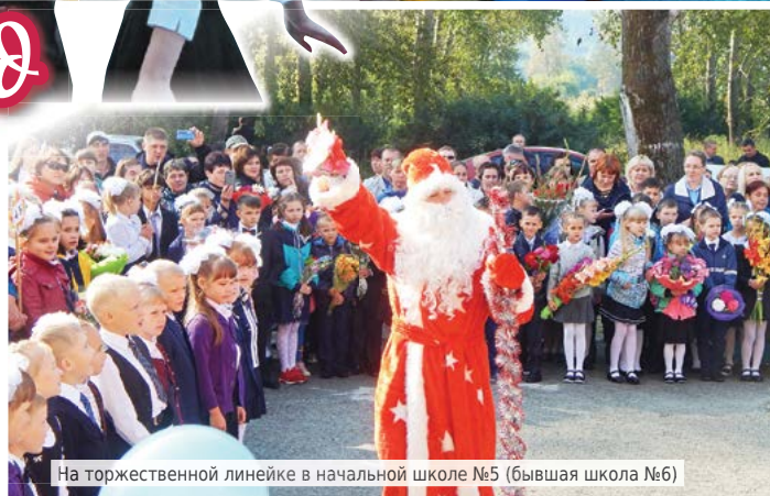
На торжественной линейке в начальной школе №5 (бывшая школа №6)