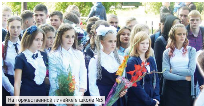
На торжественной линейке в школе №5