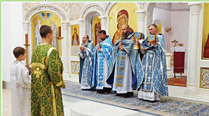
29 августа в мужском монастыре Новомучеников и исповедников Церкви Русской в храме в честь Федоровской иконы Божией Матери состоялся первый престольный праздник.

Праздники сентября: 11 СЕНТЯБРЯ - Усекновение главы пророка, предтечи и крестителя Господня Иоанна (великий праздник); 12 СЕНТЯБРЯ - Перенесение мощей блгв. кн. Александра Невского; 18 СЕНТЯБРЯ - Пророка Захарии и прав. Елисаветы, родителей Иоанна Предтечи. (День ангела прмц. Елисаветы Феодоровны); 21 СЕНТЯБРЯ - Рождество Пресвятой Богородицы (двунадесятый праздник); 27 СЕНТЯБРЯ - Воздвижение Честного и Животворящего Креста Господня (двунадесятый праздник); 30 СЕНТЯБРЯ - День мучениц Веры, Надежды, Любви и матери их Софии.