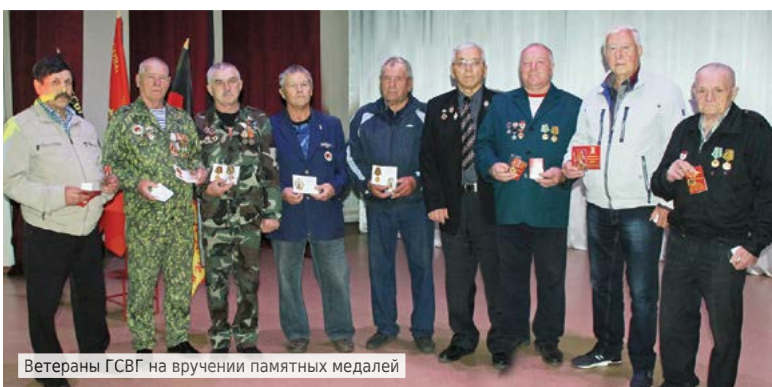
Ветераны ГСВГ на вручении памятных медалей