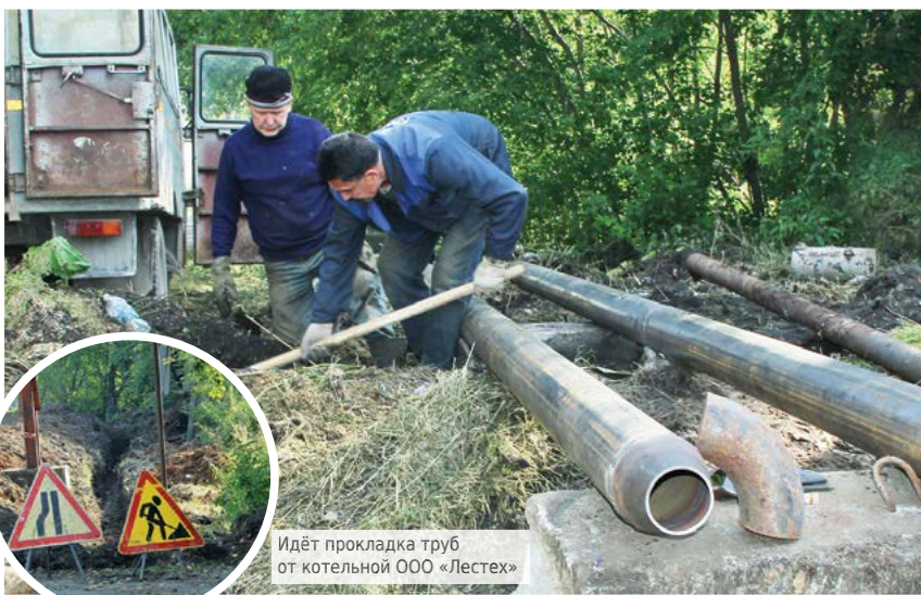
Идёт прокладка труб от котельной ООО «Лестех»

По оперативным данным по состоянию на 28 августа 2018 года техническая готовность жилищно-коммунального хозяйства муниципального образования к работе в зимних условиях 2018-2019 года по основным показателям составляет: жилищный фонд – 90%; источники теплоснабжения – 88%; тепловые сети – 85%;