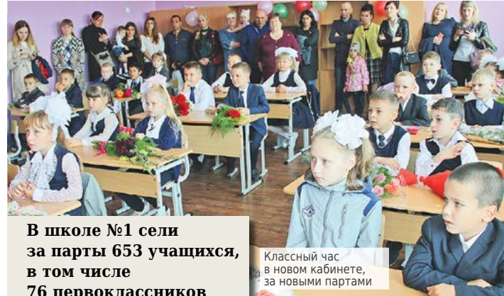
В школе №1 сели за парты 653 учащихся, в том числе 76 первоклассников