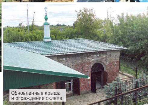
Обновленные крыша и ограждение склепа

годом эта благотворительная акция собирает всё больше участников – жителей города и района, а также многочисленных гостей, приехавших в Алапаевск. В этом году во время акции было собрано более трехсот тысяч рублей. Эти деньги переданы 25 многодетным семьям города и района.