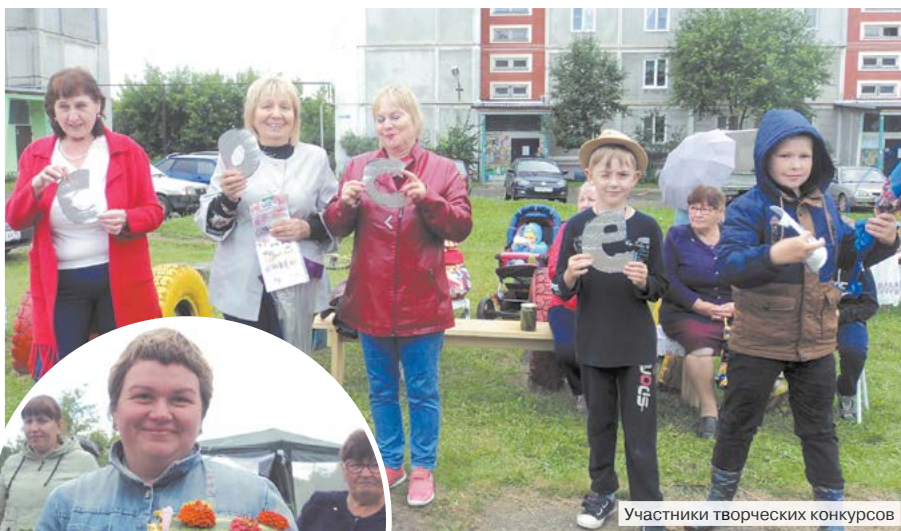
Участники творческих конкурсов

заваренными травами, кто-то пирог морковный, печенье, конфеты... Напились чаю, а расходиться не хочется. Значит –