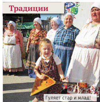
Гуляет стар и млад!