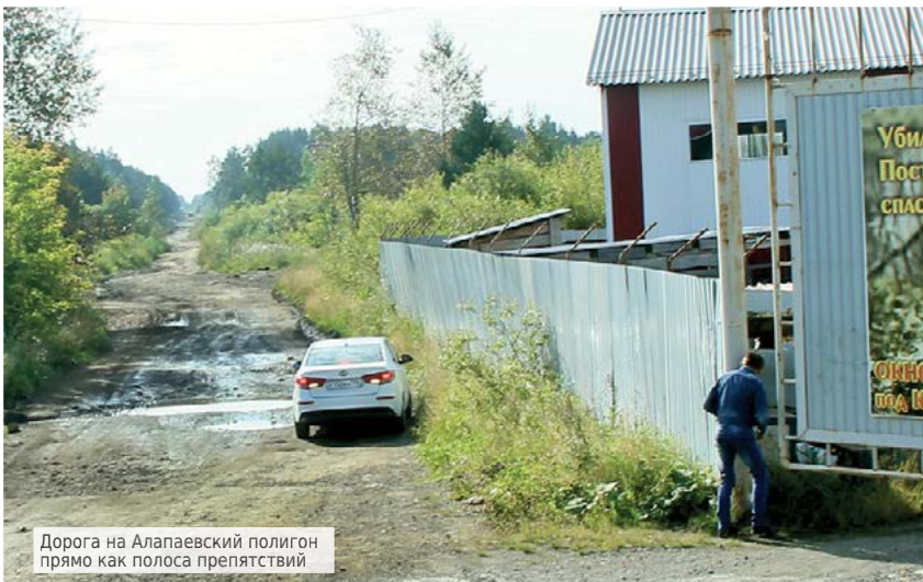
Дорога на Алапаевский полигон прямо как полоса препятствий