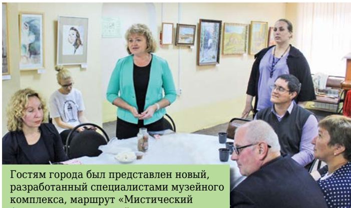
Гостям города был представлен новый, разработанный специалистами музейного комплекса, маршрут «Мистический Алапаевск», оказавшийся удачным и интересным экскурсом в прошлое.

Как говорят специалисты музейного комплекса, к сожалению, в городе и районе отмечается снижение туристического потока. Причина – недостаточная информированность населения области, страны. Во время встреч на различных выставках и презентациях алапаевские представители туристической индустрии поняли, что когда звучит имя Алапаевска, люди представляют только Дом-музей П.И.Чайковского и музей деревянного зодчества под открытым небом в Нижней Синячихе. Это замечательно. Но в городе и районе насчитывается более 20 различных музеев! И каждый музей – уникален. Без повторов, без подражаний. Есть алапаевцам что показать