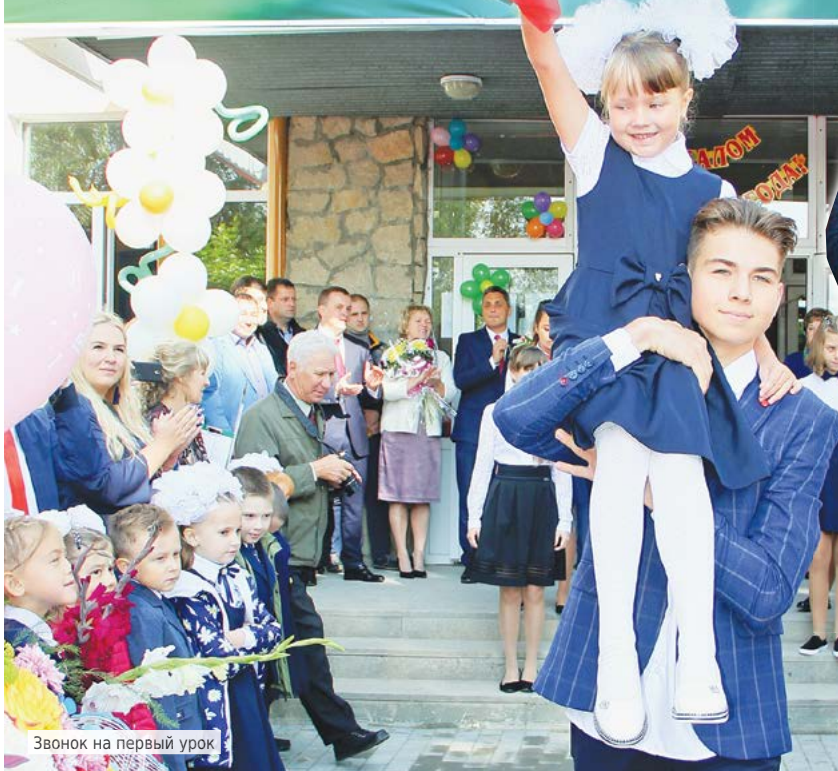
Звонок на первый урок