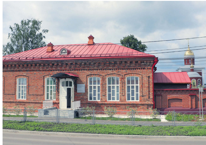
▲ Музей памяти представителей Российского Императорского Дома «Напольная школа в городе Алапаевске» | Снимок mnsh-al.ru