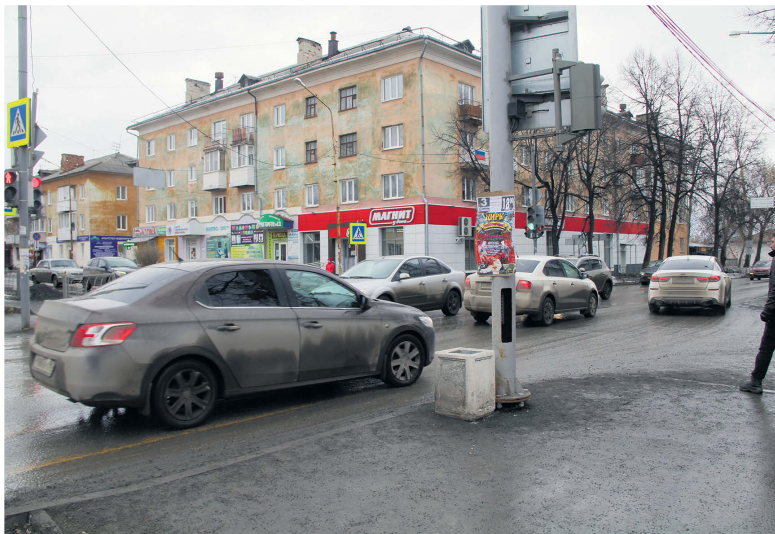
▲ Перекрёсток дорог улиц Ленина – Пушкина

Мнение большей части обратившихся: прежний режим работы светофора был более удобен. Приведение работы светофора к новому режиму позволило пешеходам переходить по всем направлениям, но теперь приходится долго ждать. А потом ждут водители. Адресуем вопрос к комиссии по безопасности дорожного движения города. И ждём квалифицированного ответа.