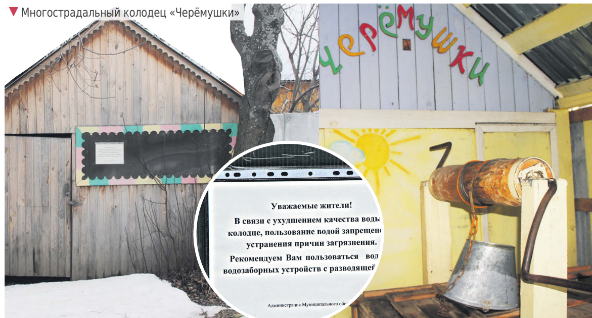
▼ Многострадальный колодец «Черёмушки»

Уважаемые жители! В связи с ухудшением качества воды в колодце, пользование водой запрещено до устранения причин загрязнения. Рекомендуем Вам пользоваться водозаборных устройств с разводящей