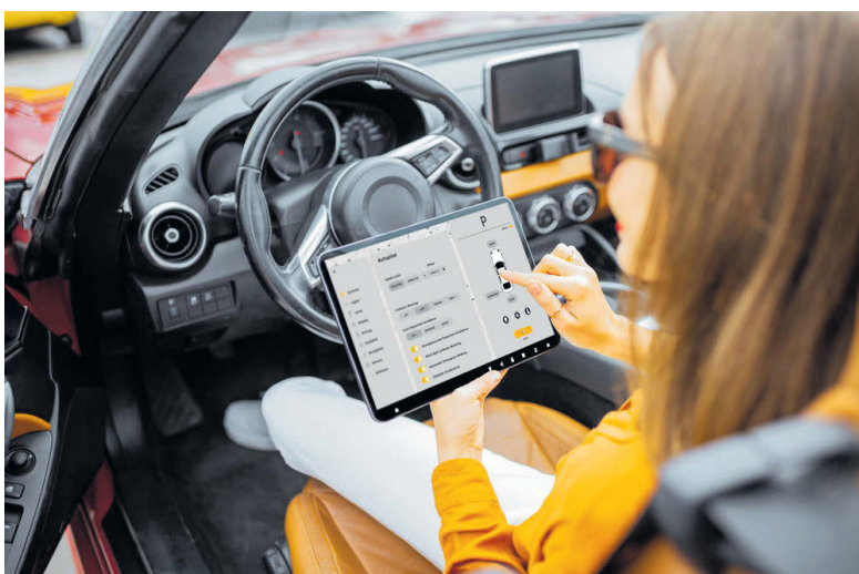
▲ Телематика позволяет не только определить манеру управления автомобилем. Аккуратным – скидка.

Эти устройства показывают, насколько водитель аккуратен за рулем – как часто он совершает резкие ускорения и торможения, резкие повороты – и считает скоринговые баллы. Чем выше балл, тем меньше шансов у водителя попасть в ДТП по собственной вине. А