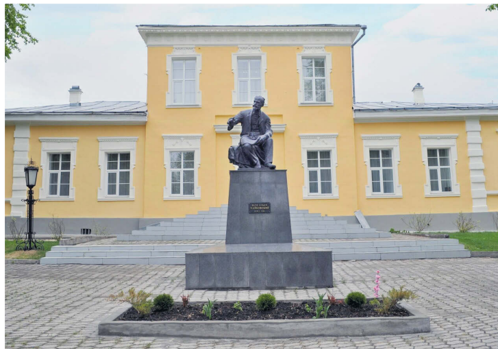
▲ Дом-музей П.И. Чайковского