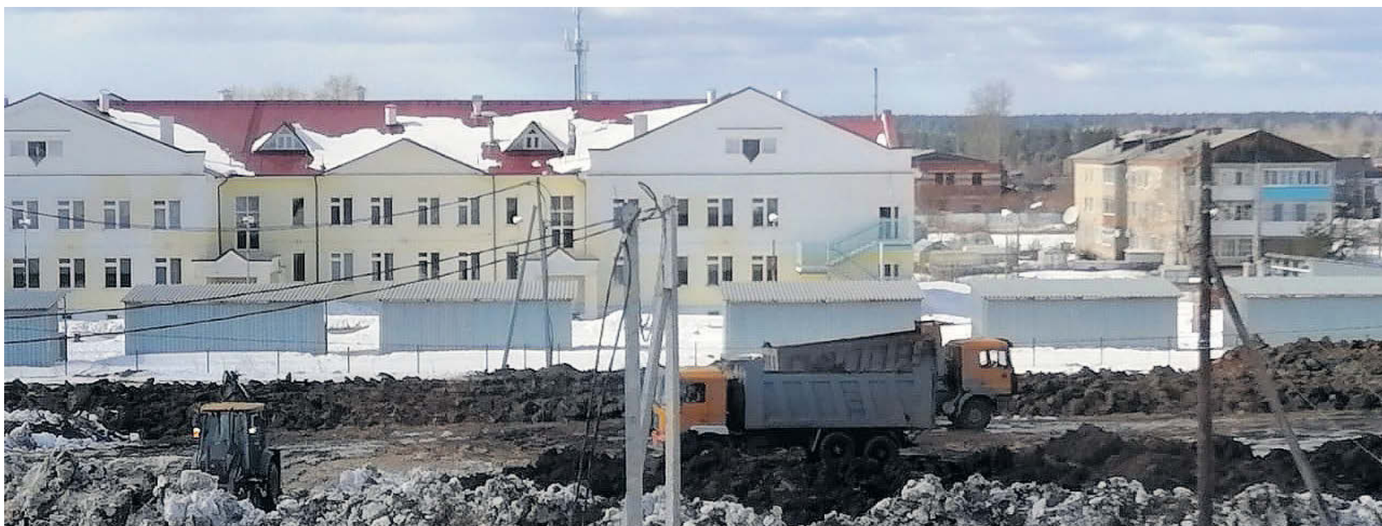
▲ Микрорайон Северный, дом будет построен рядом с новым детским садом