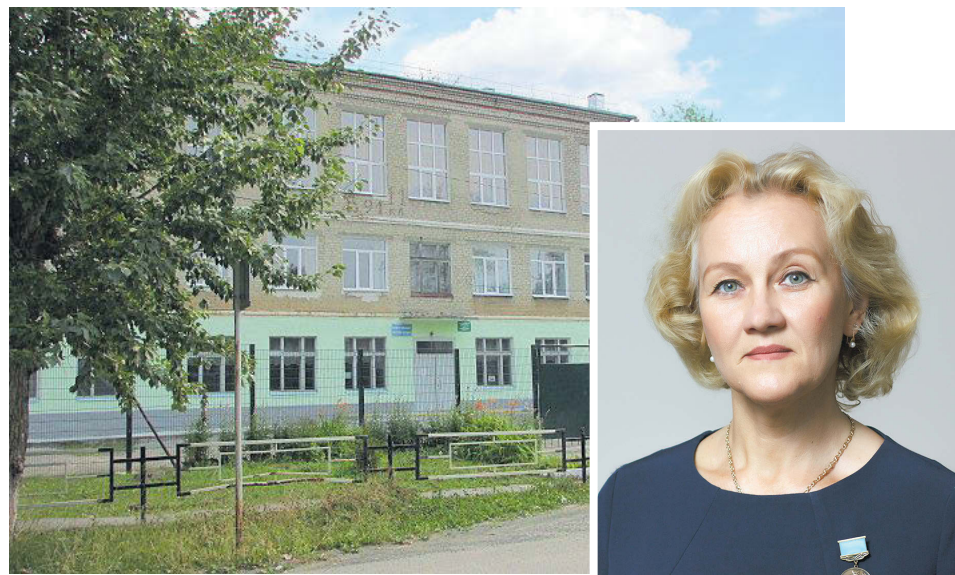
▲ Школа №5