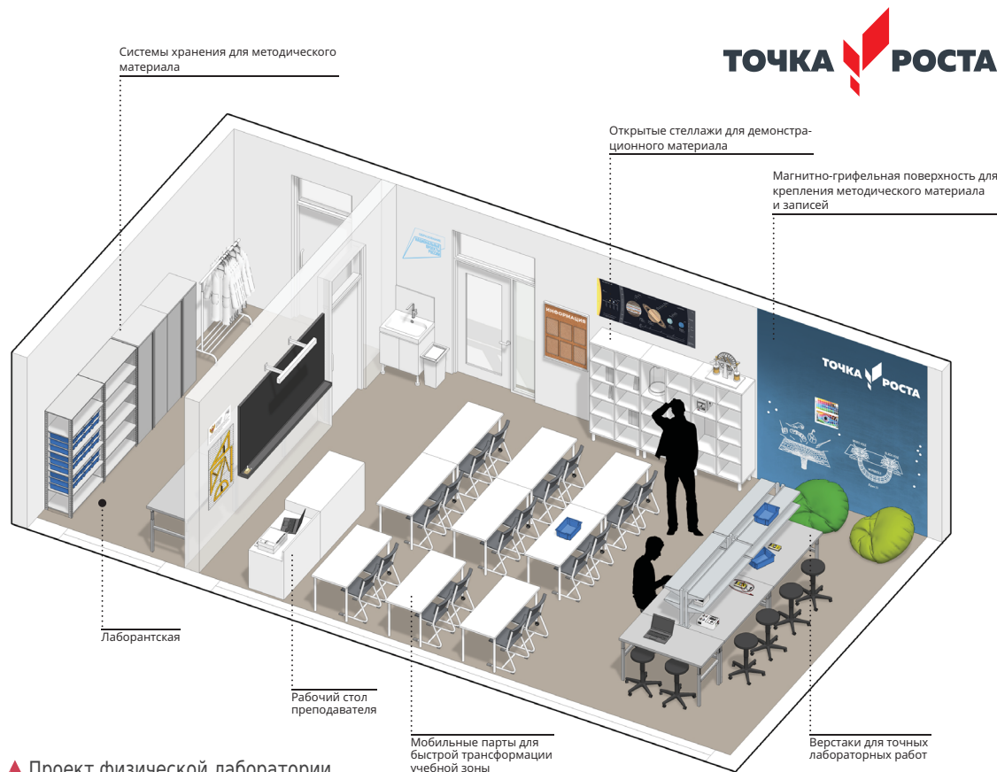
▲ Проект физической лаборатории

О том, как идет подготовка к созданию и открытию «Точки роста» в школах, рассказывают директора образовательных учреждений.