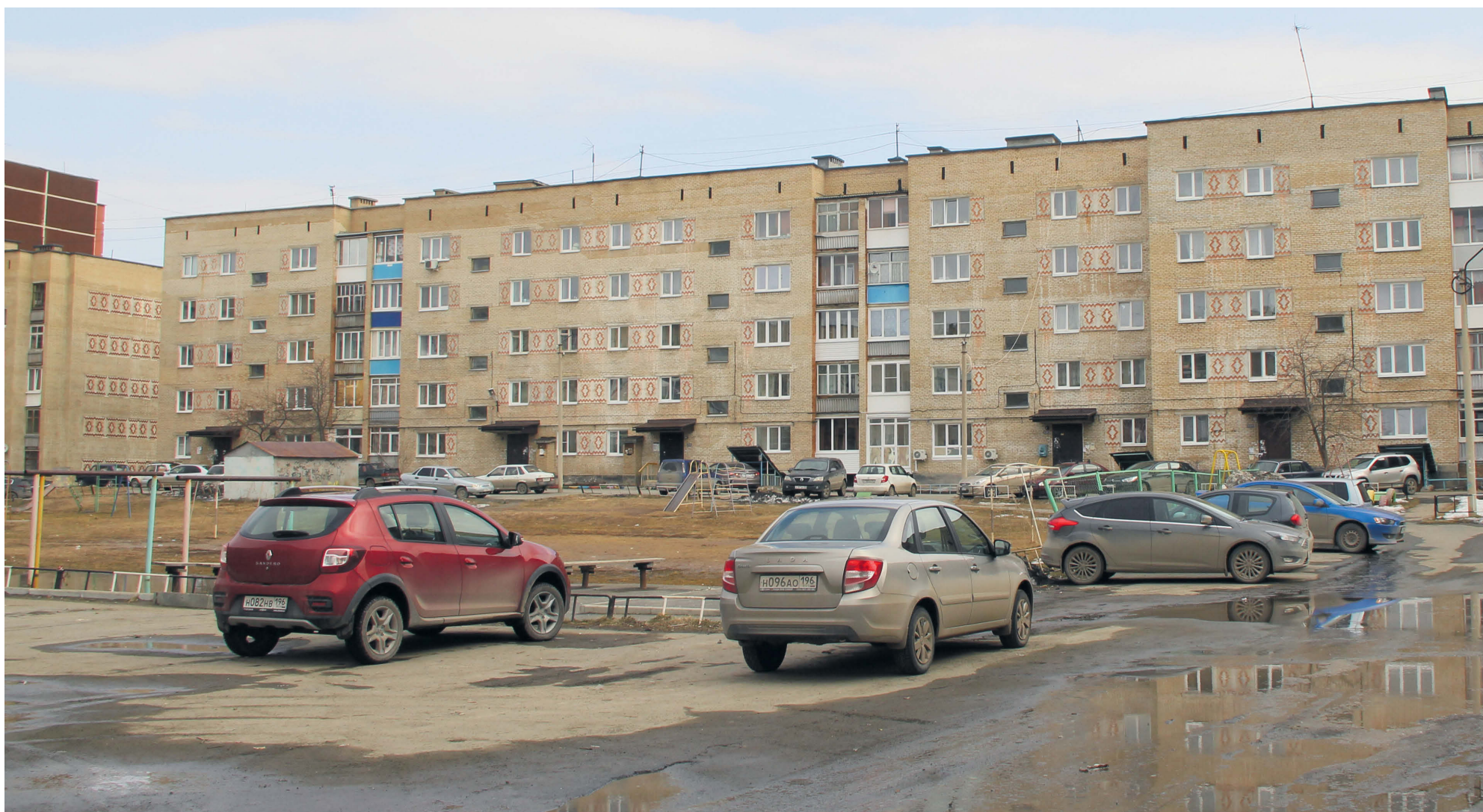
▲ Дом по улице Н. Островского, 12/2 станет одним из экспериментальных объектов по горячему водоснабжению в летний период