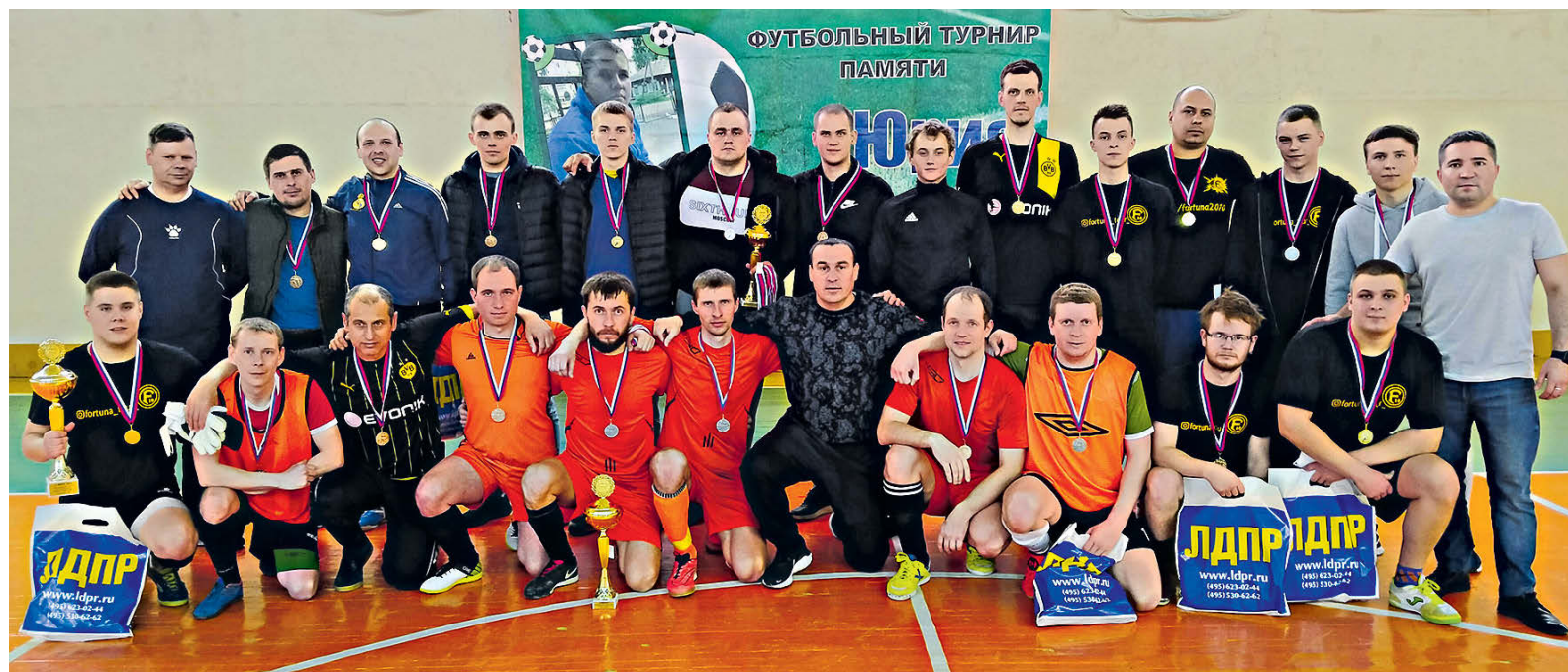
▲ Победитель турнира команда «Фортуна» с командами «Цезарь», «Станкозавод» и организаторами турнира

Основная борьба развернулась в полуфинальных и финальных матчах. Причем самым напряженным и зрелищным стал матч «Станкозавод» – «Цезарь». Какое-то время «Станкозавод» вел в счете – 3:1, но «Цезарь» постепенно взвинтил