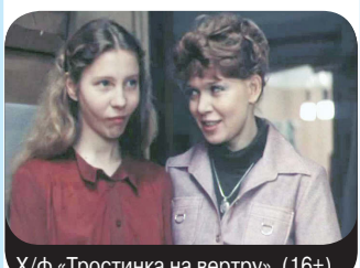
Х/ф «Тростинка на ветру». (16+)