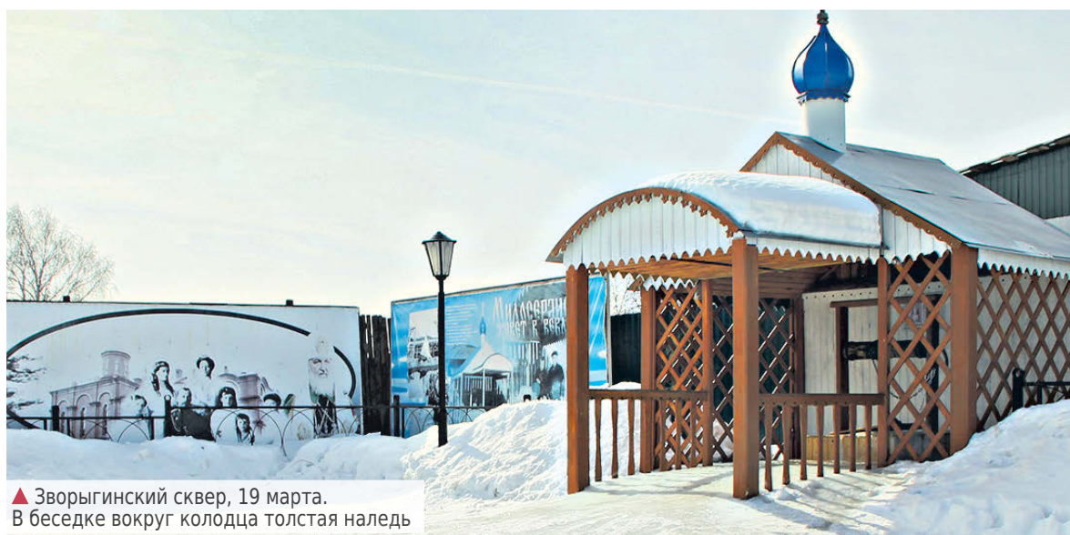
▲ Зворыгинский сквер, 19 марта. В беседке вокруг колодца толстая наледь

Такая вот складывается ситуация. Не берегут, не ценят почему-то у нас ни Зворыгинский колодец, ни здоровье людей. А напакостить – это легко, для этого много ума не надо!