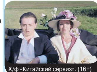
Х/ф «Китайский сервиз». (16+)