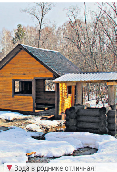
▼ Вода в роднике отличная!