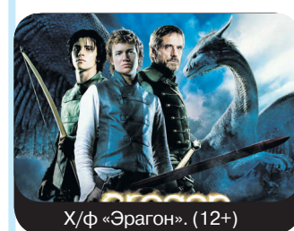
Х/ф «Эрагон». (12+)