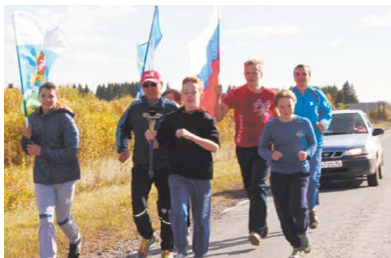
Дальше факел «Бега мира» понесли спортсмены из детско-юношеской школы МО Алапаевское