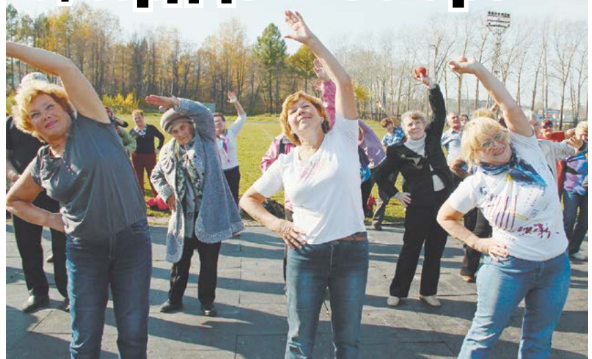
- Закаляйся, если хочешь быть здоров!

- Ездил милый на охоту, Убил рыжую лису... А с моей фигурой Надо чернобирую! Потом выстраиваются в очереди, с нетерпением ждут, а частушки – все забористее: - То не ветер-обормот