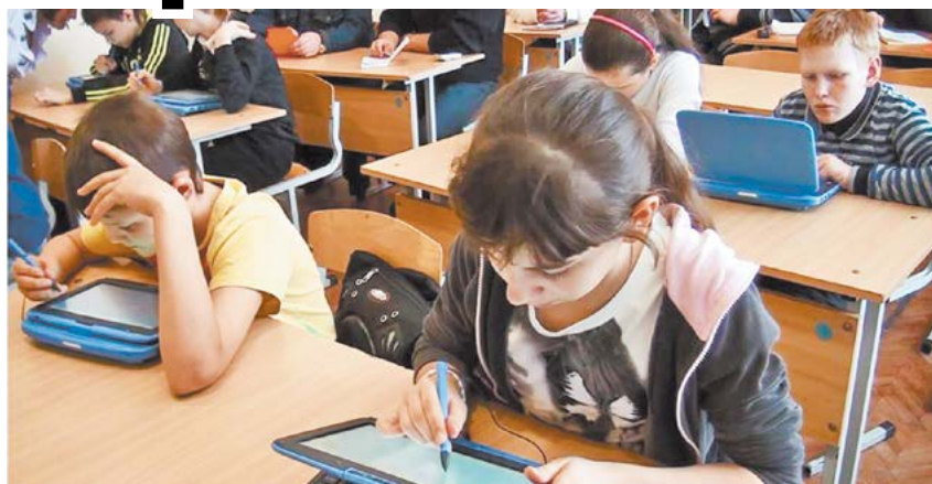
Школа №12. Мобильный класс

В современной системе образования МО город Алапаевск остро стоит проблема разработки инновационных концепций и поиска эффективных технологий обучения, которые позволили бы обеспечить гарантированное качество обучения и повышение уровня конкурентоспособности алапаевских школьников на следующей, выбранной ими ступени образования. Образование XXI века ориентирует человека на свободное развитие, творческую инициативу, самостоятельность и конкурентоспособность. Справиться с решением задач, обозначенных современным обществом, может только учитель, обладающий необходимым уровнем профессиональной компетентности и профессионализма. Сегодня система образования МО город Алапаевск сделала шаг вперед по освоению новых технологий.