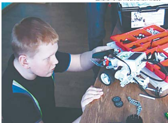
Школа №12. Робототехника