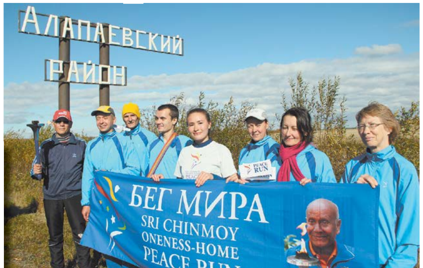
«Бег мира» прибежал в Алапаевский район