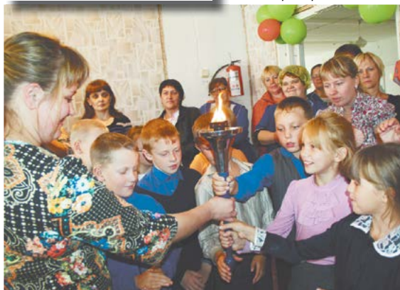
В эстафете приняли участие учащиеся голубковской средней школы...