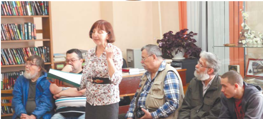
День православной книги в библиотеке-отделение №12