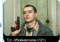
Т/с «Убойная сила» (12+)