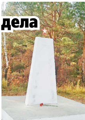
Новый памятник Героям гражданской войны