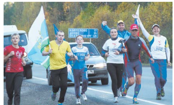
«Бег мира» вбегает в Алапаевск

вом зале школы - так мальчишки и девчонки из Голубковского тоже станут участниками «Бега мира».