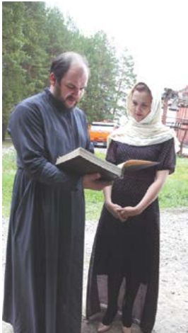
Книга - неизменный спутник священнослужителей и прихожан