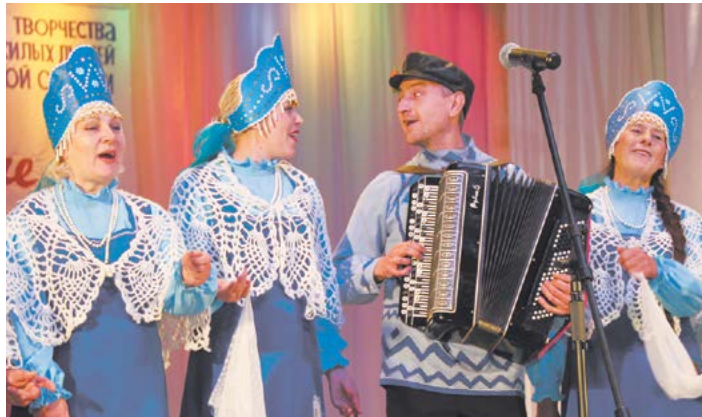
Поёт хор "Зыряночка"

- Златая Русь, звони, звони, От деревень и городов, Святая Русь, храни, храни, Надежду, веру и любовь... Или глубоко личное, как в песне «Россиюшка моя» ансамбля русской песни «Веселая семейка»: - Еду ли проселком, или лесом еду По дороге колкой, где одни лишь беды, Как же изменился весь крестьянский быт, Дом мой покосился, досками забит... Моя Рязанщина, моя Смоленщина, Милые орловские края, За кого сосватана, с кем же ты повенчана Древняя Россиюшка моя?