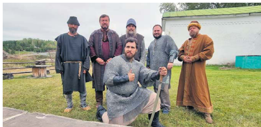
▲ На съёмках «Смуты» засветились многие алапаевские красавцы