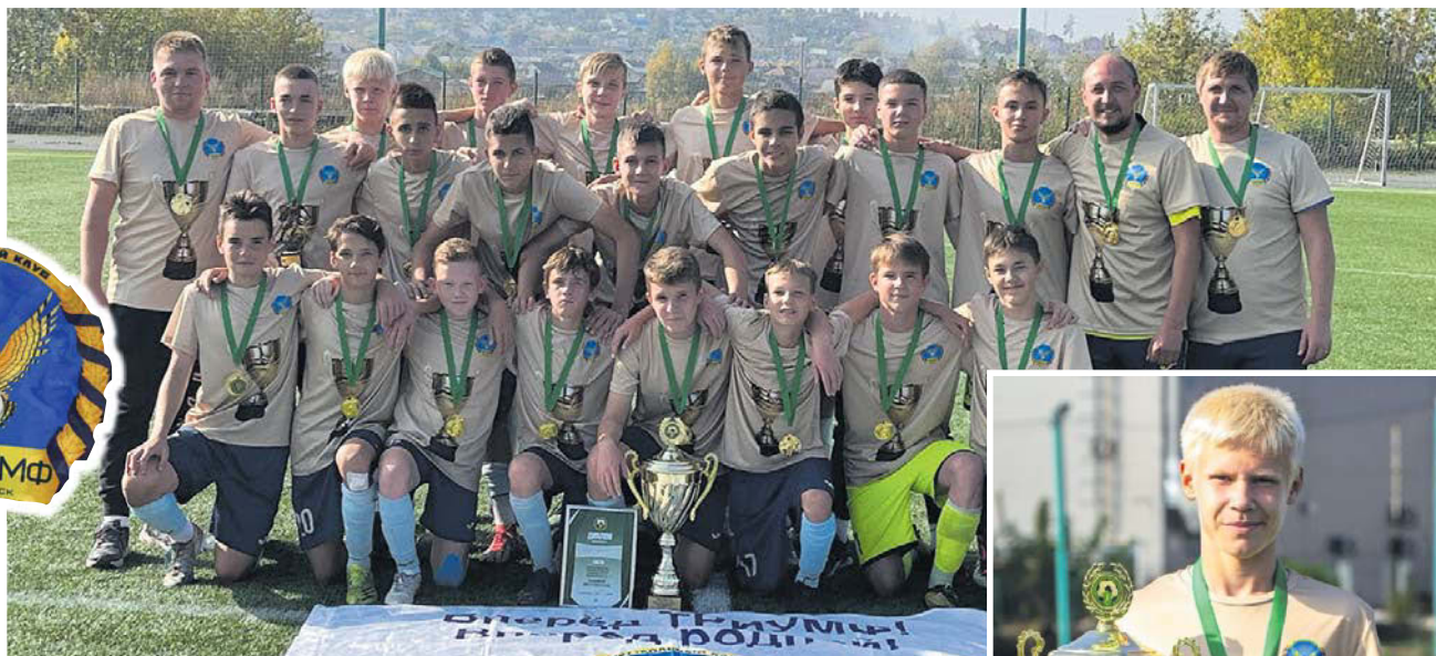
▲ Молодежная команда «Триумф» – победитель первенства России среди юношей