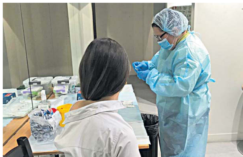
По информации Департамента информационной политики Свердловской области

Обращаем внимание, что всем пришедшим на вакцинацию при себе необходимо иметь паспорт, медицинский полис и СНИЛС.