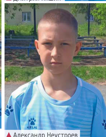
▲ Александр Неустроев