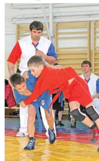
Никто не хотел уступить!

В командном зачете в этом турнире оказались сильнее ирбитские борцы: Алапаевск на второй ступеньке пьедестала, после нас - Нижний Тагил.