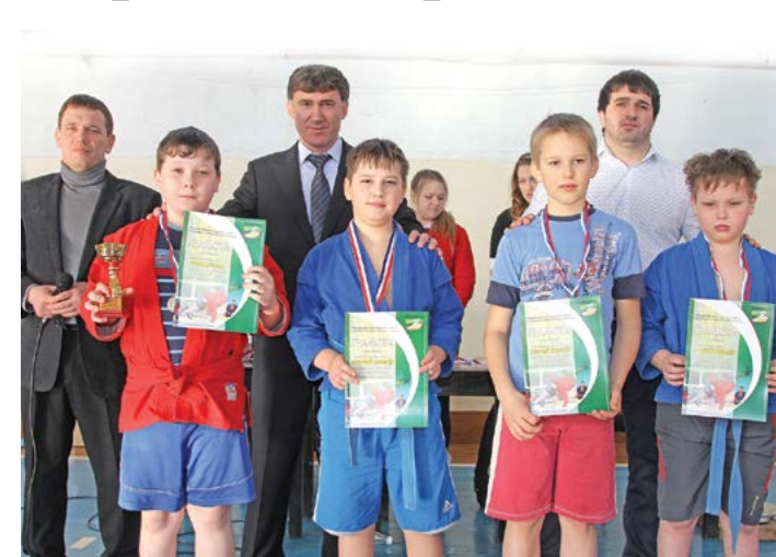
Победители и их учителя

Всего здесь выступили 42 спортсмена, половина из них - гости. Побед добились четве-