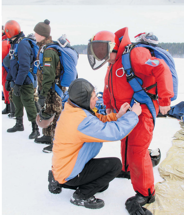
▲ Правильная экипировка - основа безопасности