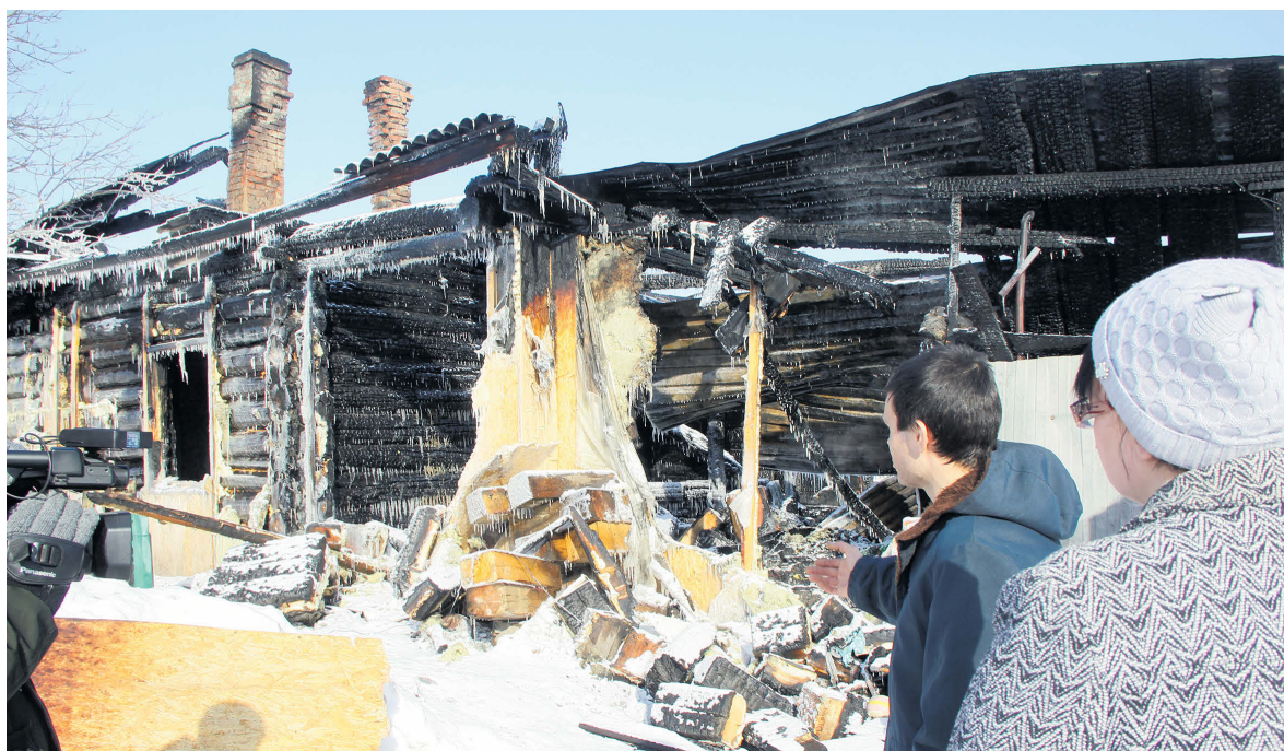
▲ Село Невьянское. Родители пятерых малышей у дома на следующий день после пожара

За последние две недели в Алапаевске и Алапаевском районе из-за страшных пожаров семь семей, в том числе и три многодетных, лишились жилья и всего нажитого имущества.