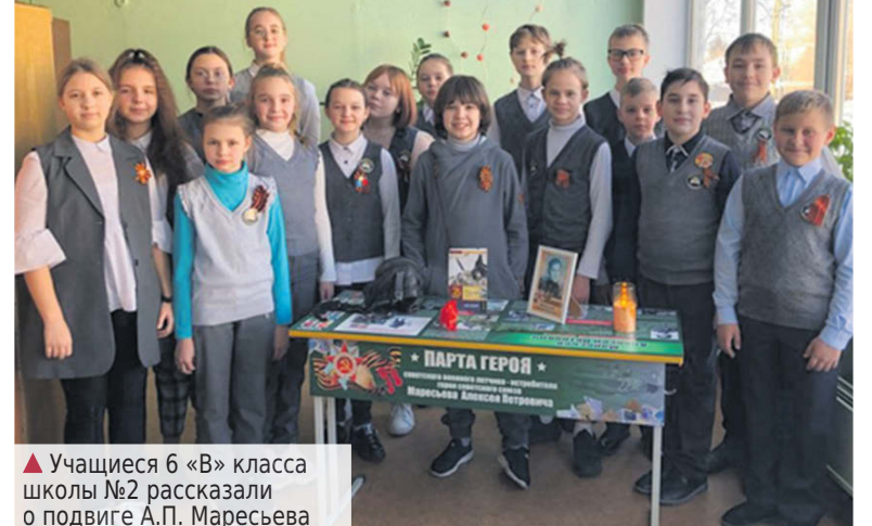
▲ Учащиеся 6 «В» класса школы №2 рассказали о подвиге А.П. Маресьева

19 февраля в преддверии Дня защитника Отечества, праздника героизма, мужества и отваги, в 6 «В» школы №2 прошёл классный час на тему «Маресьев – наш Герой».