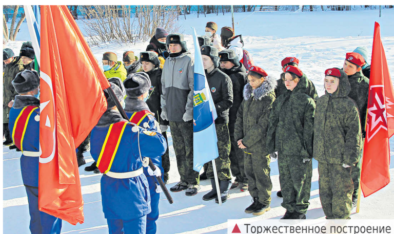
▲ Торжественное построение

Учащиеся 6 «В» класса школы №2