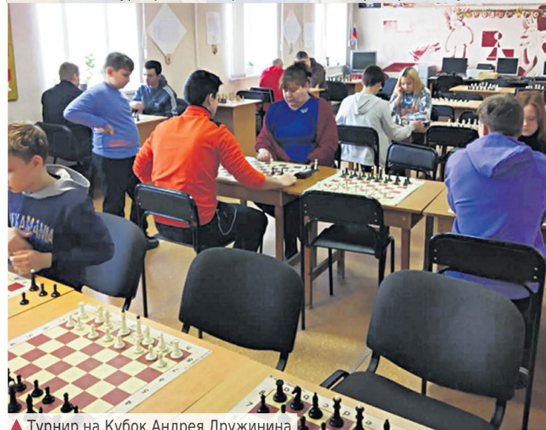
▲ Турнир на Кубок Андрея Дружинина. Подготовили Д. КЛЕЩЕВ, В. ФОМИН .