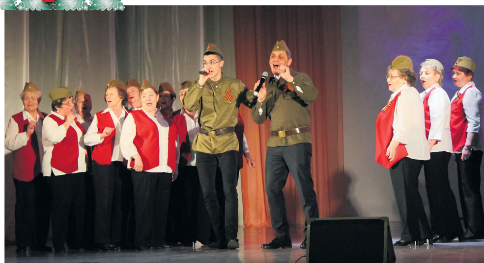
▲ Ветеранская организация Управления образования МО город Алапаевск