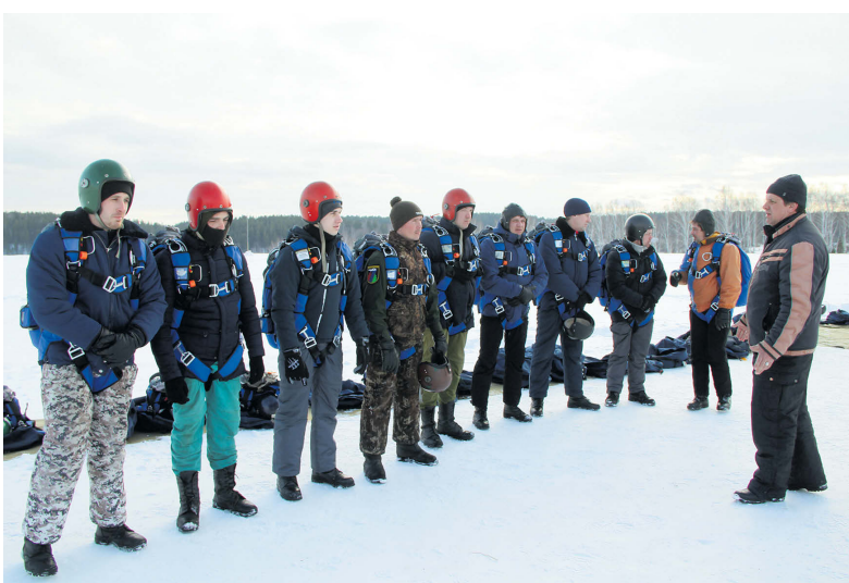
▲ Инструктаж перед посадкой