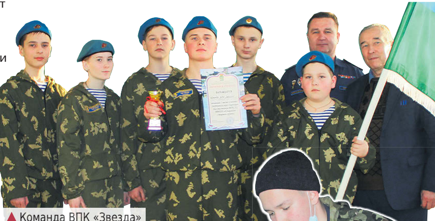
▲ Команда ВПК «Звезда»