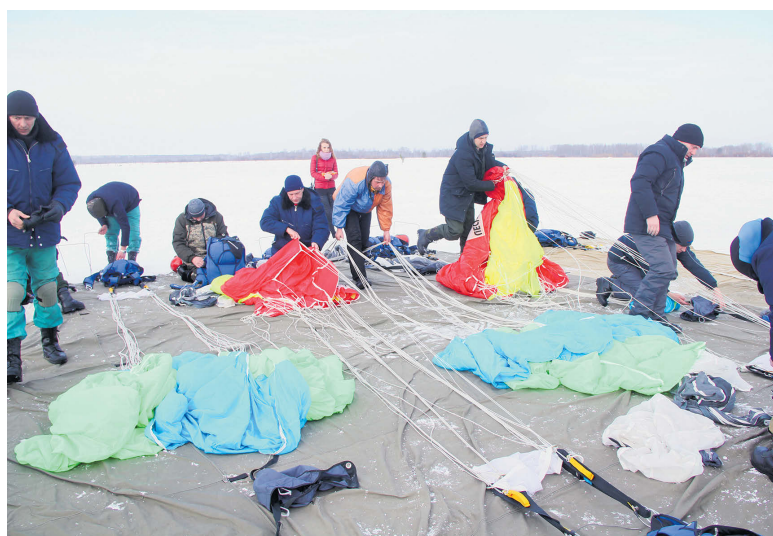
▲ На укладочной площадке