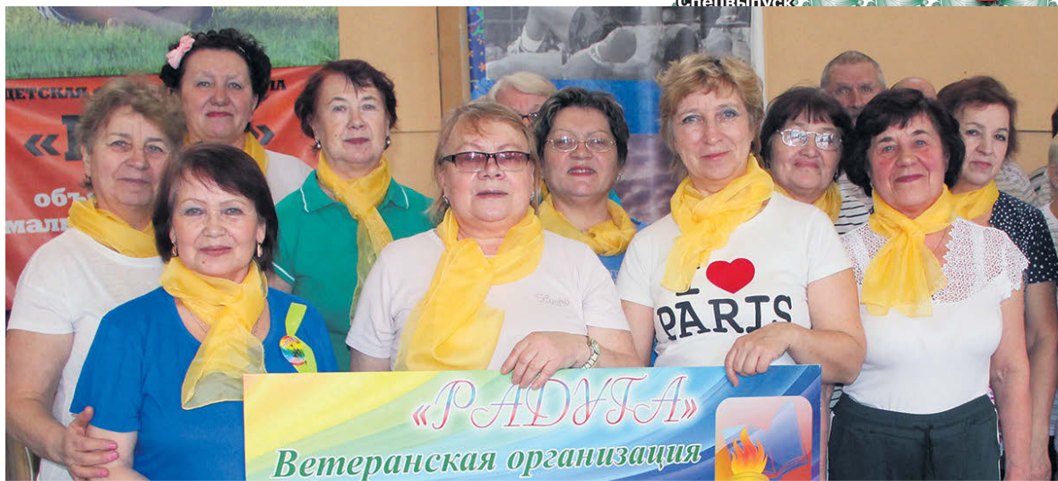
▲ Команда Управления образования