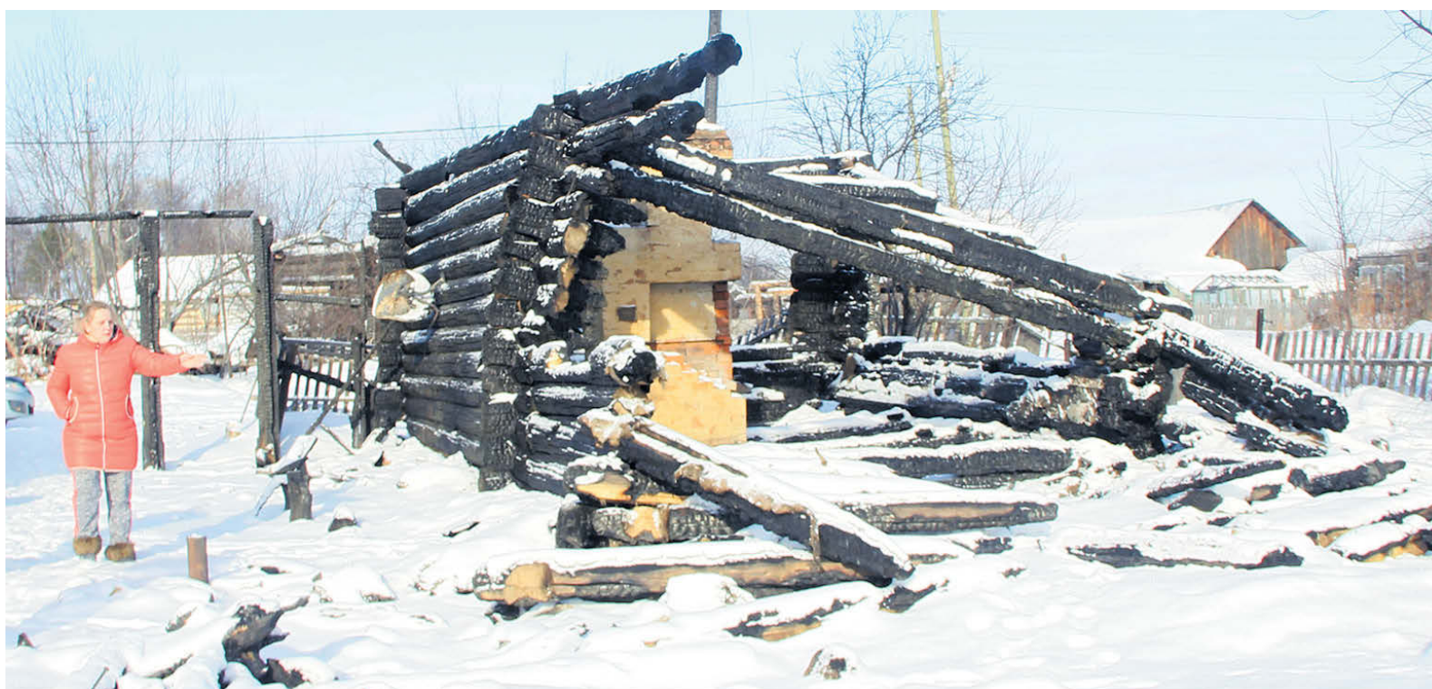
▲ Поселок Нейво-Шайтанский. Развалины дома после пожара