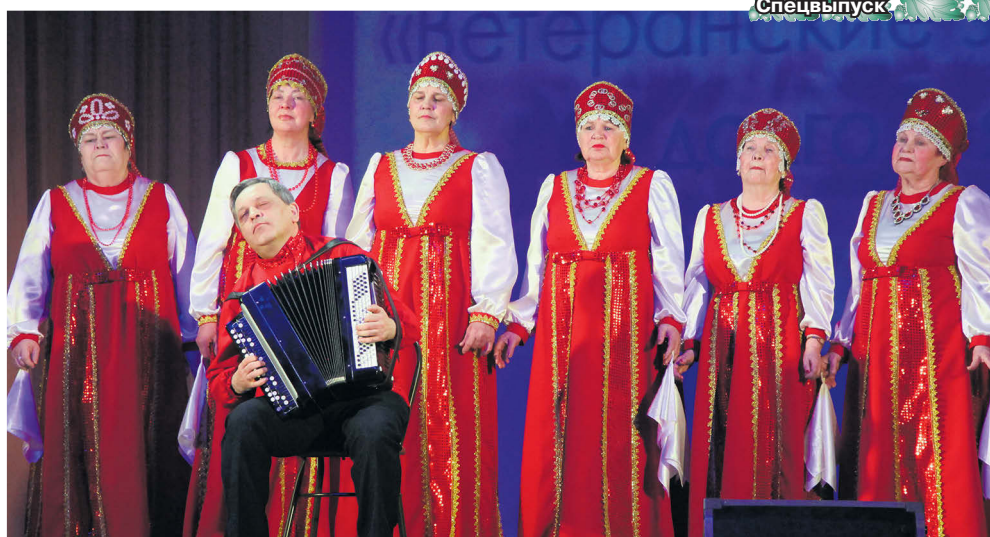
▲ Участники фестиваля