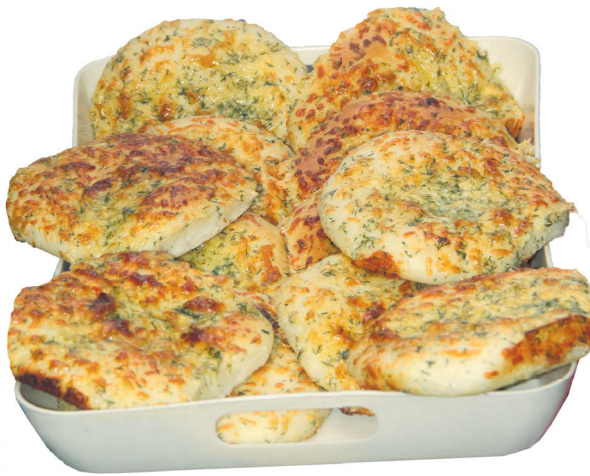
▲ Вот такую вкуснятину можно приобрести в сети магазинов «Рубин»

Вся продукция периодически проходит сертификацию и декларирова-