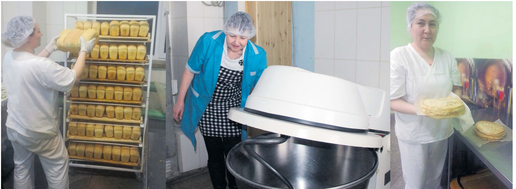
▲ Женщины этой хлебопекарни уже с самого утра встречают горячей выпечкой

Основными потребителями продукции являются жители поселка Нейво-Шайтанский. Наша продукция продается в 6 магазинах сети «Рубин» (ИП Балакин В.Н.), а также мы обеспечиваем своей продукцией (в основном хлебопекарной) детский сад и школу в поселке. Наша продукция пользуется спросом и в ближайших населенных пунктах: село Южаково, село Мурзинка, деревня Луговая Пригородного района Горноуральского городского округа.