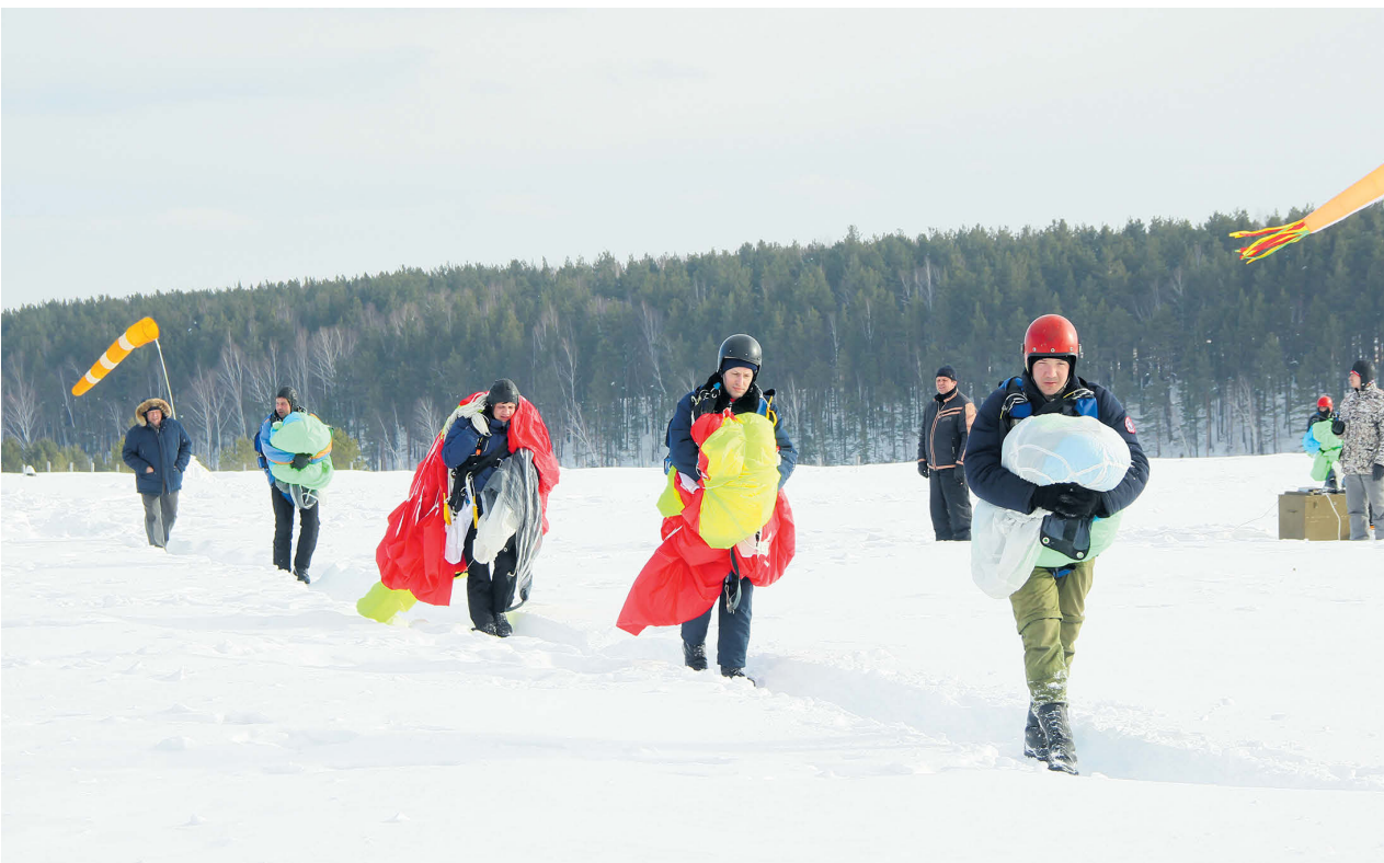
▲ Задание выполнено!