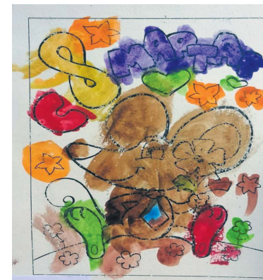
▲ Алиса Зенкова, 2,5 года