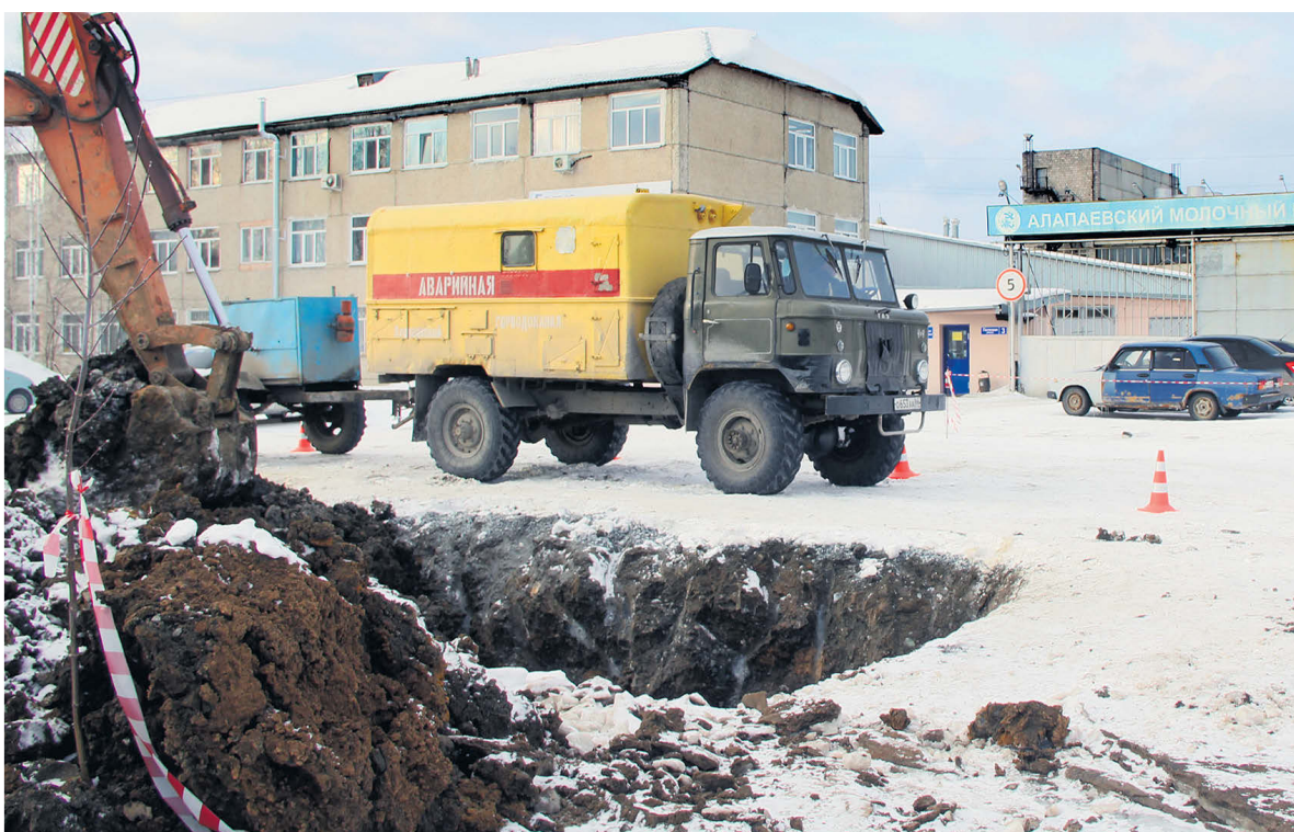
▲ Аварийная ситуация на сетях водоснабжения в Северном микрорайоне