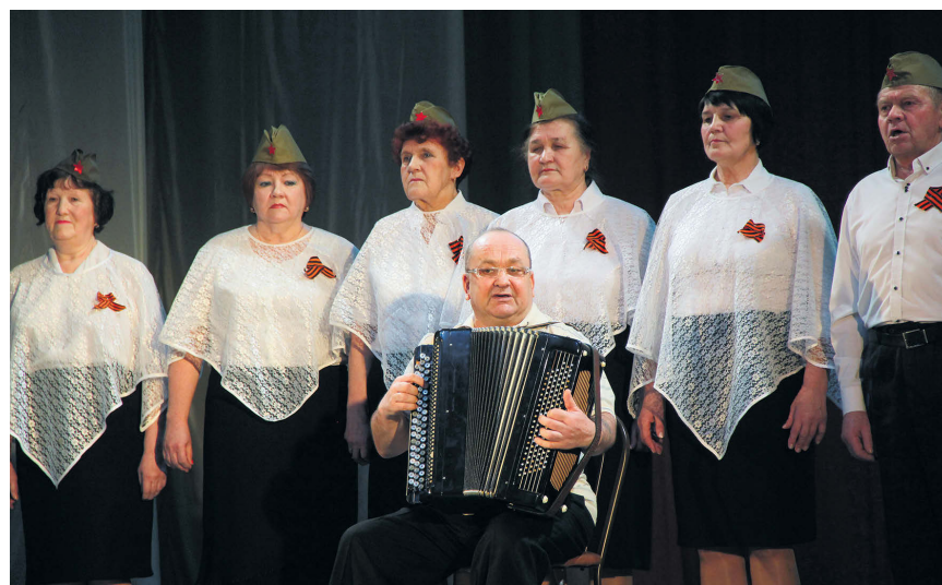
▲ Ансамбль Рабочего городка

• привлечение внимания общественности, деятелей культуры, государственных, муниципальных и коммерческих