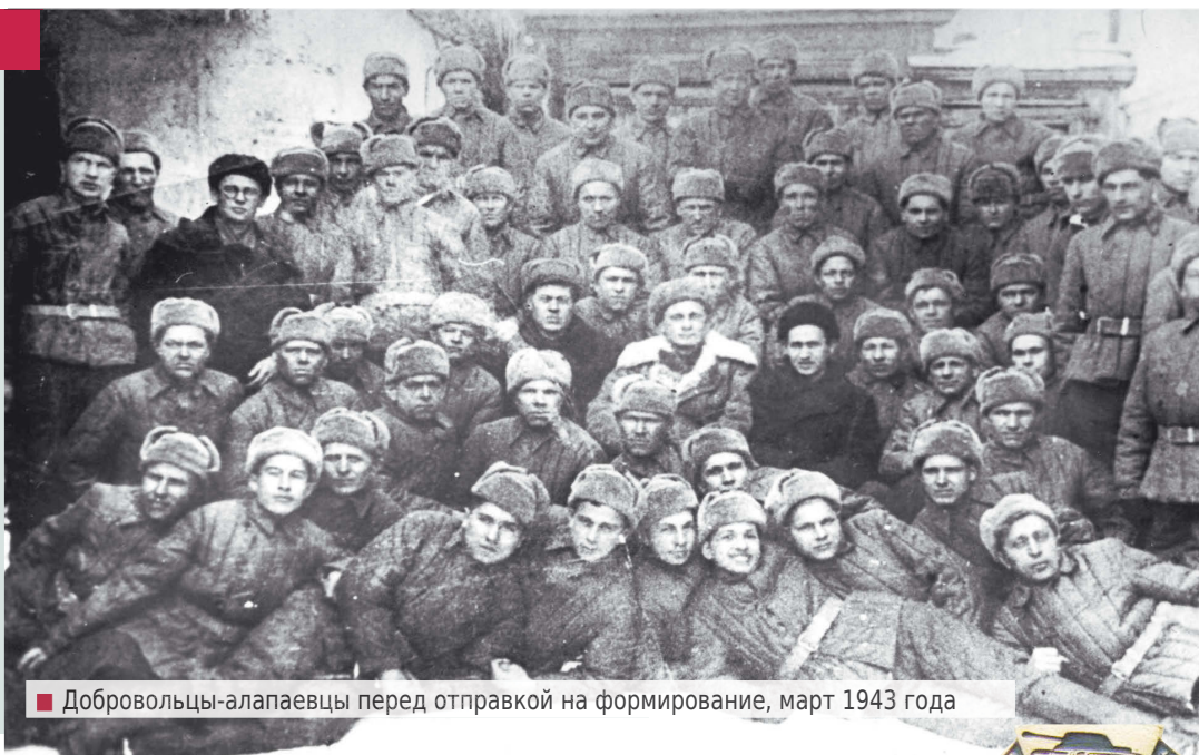
■ Добровольцы-алапаевцы перед отправкой на формирование, март 1943 года