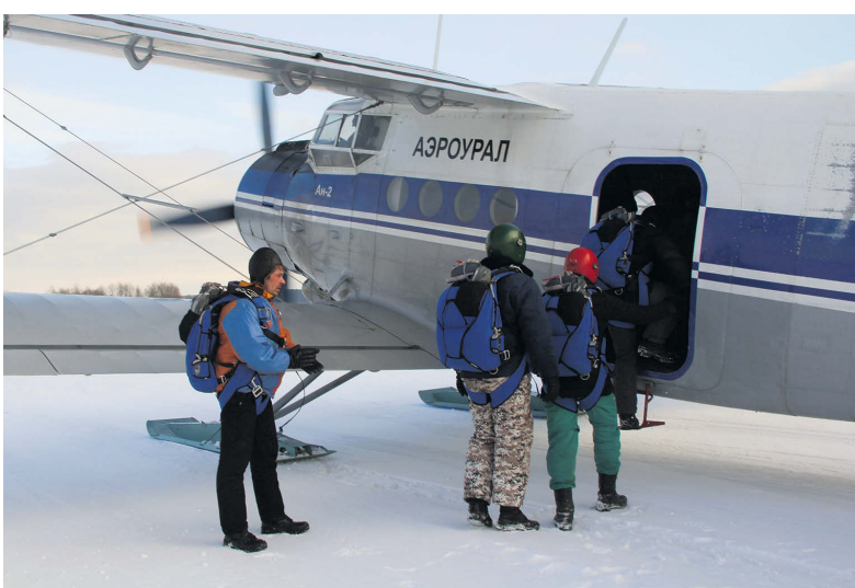
▲ Посадка на борт, через несколько минут прыжок