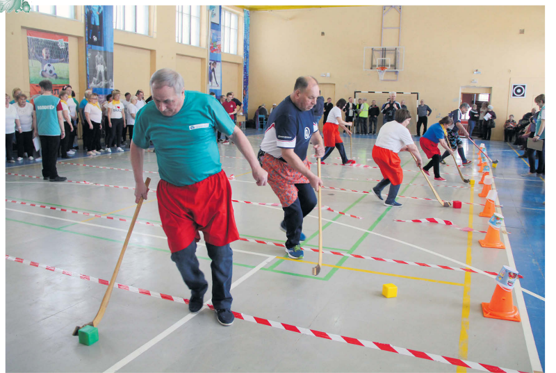
▲ Спартакиада пенсионеров

2020 год был менее насыщенным на мероприятия по сравнению с 2019 годом по ряду объективных причин, менее эффективным на общение ветеранов. Тем не менее даже в этих условиях городскому совету ветеранов удалось провести немало мероприятий. И в условиях удаленки продолжали работать и помогать друг другу.