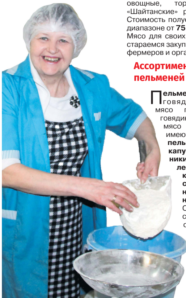
▲ Технолог внимательно следит за всем процессом

Наша пекарня принимает заявки на изготовление любой продукции нашего ассортимента, также по индивидуальному запросу имеется возможность изготовить продукцию по желанию клиента. Заявки принимаются по телефону: 8 (34346) 74-5-88 и e-mail: Granit-bereg@mail.ru .