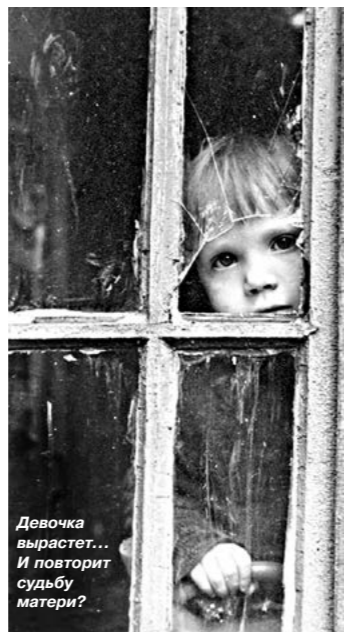
Девочка вырастет... И повторит судьбу матери?

В доме стоял смог, пахло алкогольным перегаром, было холодно. Посередине комнаты стояла коляска. Рядом еле-еле державшаяся на ногах пьяная мать. Еще чуть дальше сидел муж хозяйки. Все были пьяны, но молодая мамаша особенно. Она попыталась закрыть собой коляску и, выражаясь нецензурно, бранью, отказывалась подпускать кого-либо к ребенку.