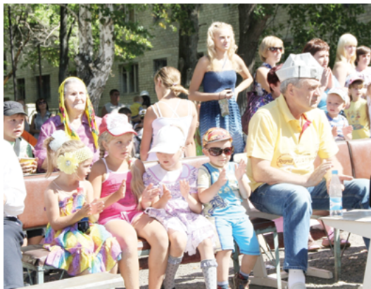
Зырянковцы в праздничный день