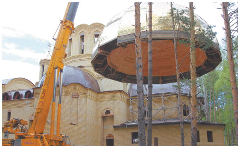
Подъем центрального купола начал