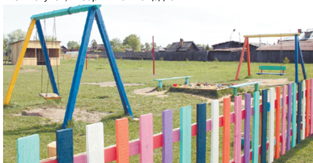
Площадка цвета радуги