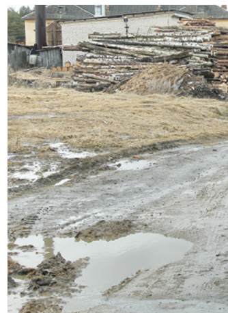
Такие дороги в зырянковском сегодня

Известный предприниматель и депутат городской думы Кирилл Александрович Некрасов купил бывший Алапаевский завод погонных изделий. Точнее, стены, что остались от этого завода после того, как он прекратил тут свою деятельность. Теперь в этих стенах он намерен открыть новое производство - планирует создать первоначально 50 рабочих мест, а в перспективе увеличить их количество до 150. Для Зырянковского - это даже очень прилично.