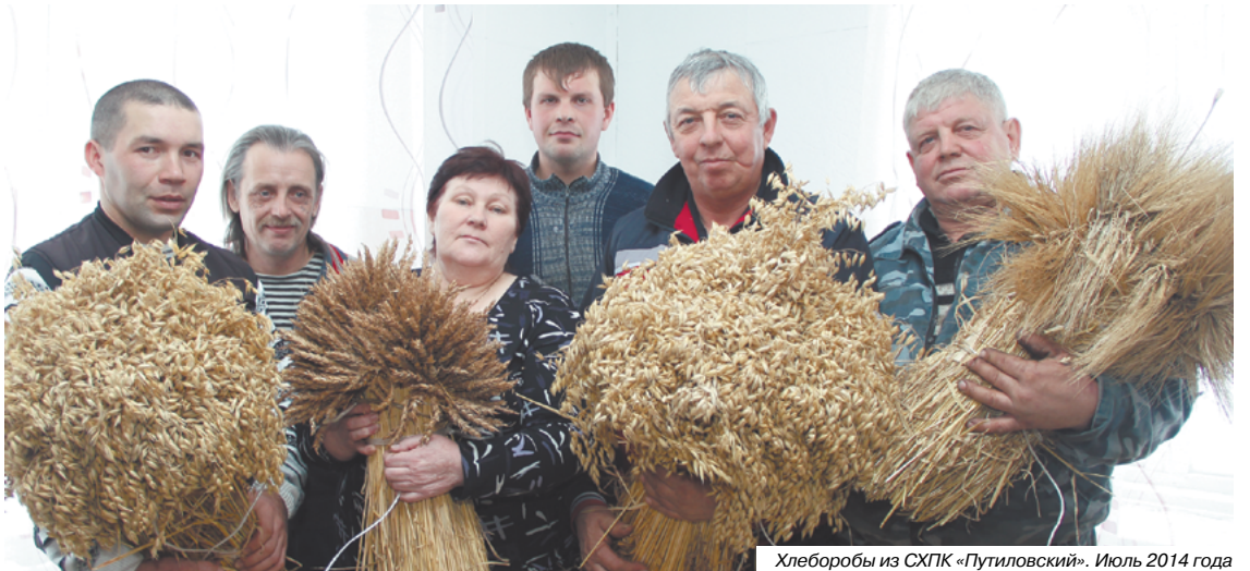
Хлебоборобы из СХПК «Путиловский». Июль 2014 года