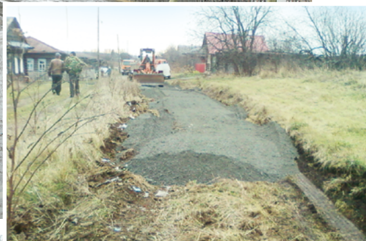
Вот так колеи превращаются в дорогу