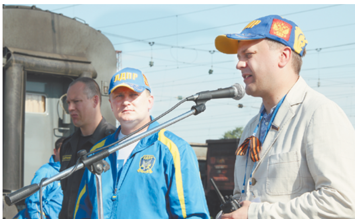
Депутат Государственной думы Федерального собрания Российской Федерации от ЛДПР Александр Николаевич ШЕРИН

Двадцать лет он водил эти поезда от Калининграда и до Владивостока и от Мурманска до Махачкалы. Везде выходил, везде общался, слушал просьбы, мольбы, столько видел горя, человеческих трагедий, изломанных судеб, слез, что лучше любого писателя может написать роман о