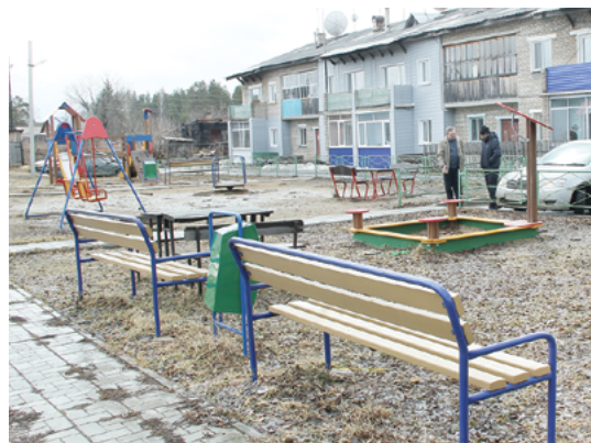
Детская площадка, построенная по программе «Тысяча дворов»