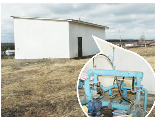
Насосная станция после реконструкции.