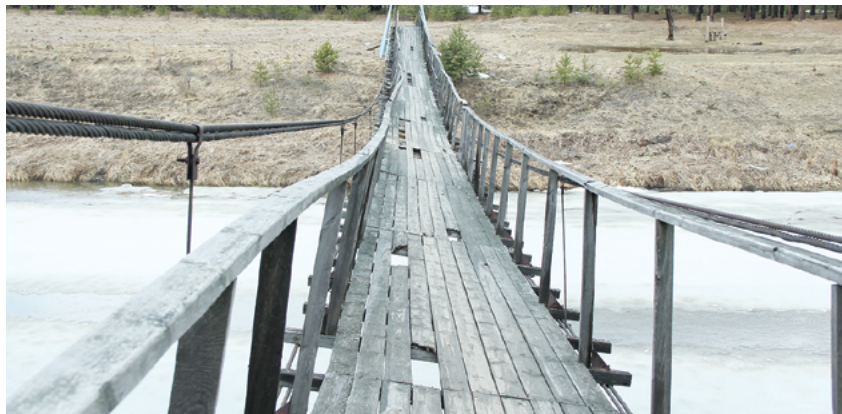
Аварийный подвесной мост в Зырянском