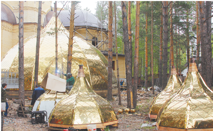
Купола. Последние мгновения перед «взлетом»