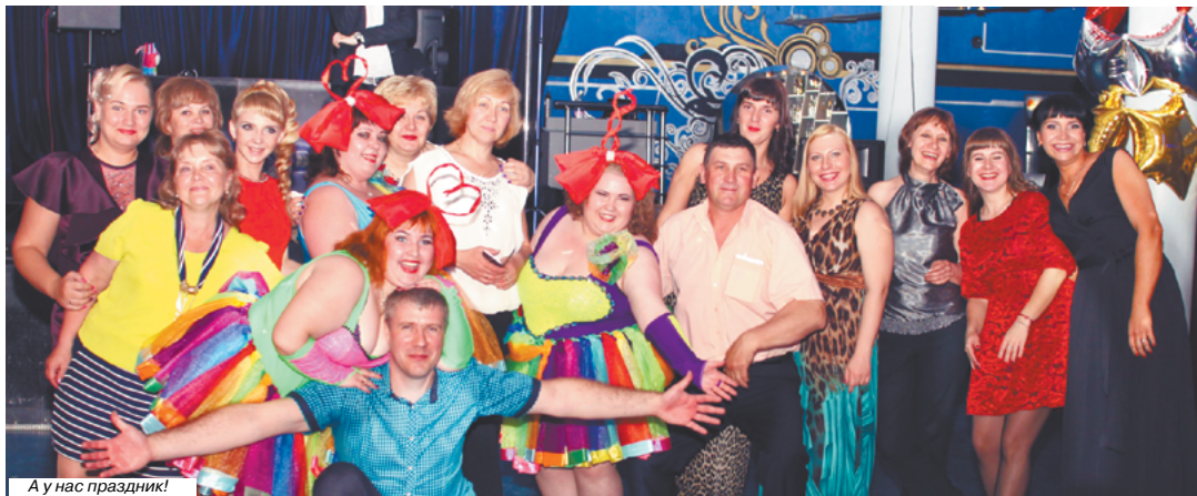
А у нас праздник!