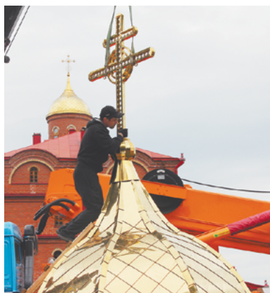
Кресты малых куполов