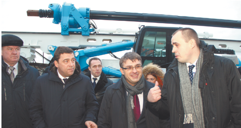
Ноябрь 2014 года. Губернатор Е.Куйвашев (второй слева) знакомится с производством завода Стройдормаш