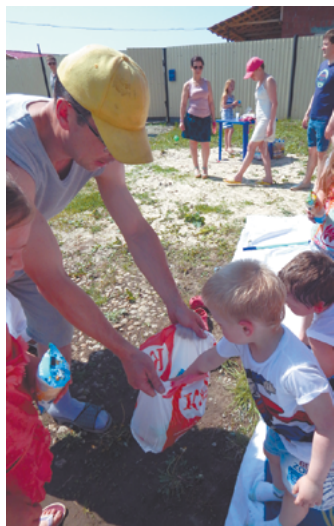
Детям - мороженое!