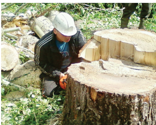
Одним старым и опасным тополем на улице Революции стало меньше