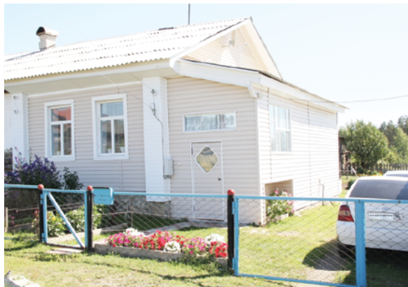
И вот так можно жить в Зырянковском