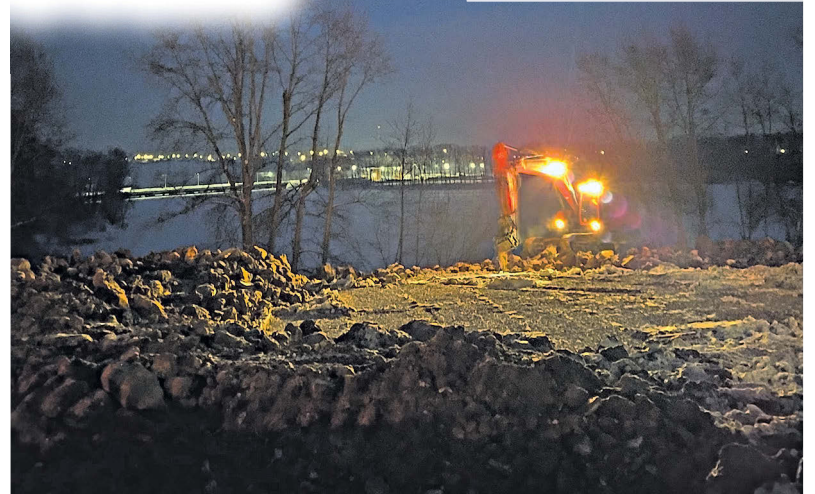
▼ Подготовительные работы на месте строительства храма не прекращаются даже в вечернее время

По поводу перекрытия автодороги – придется потерпеть. В целях безопасности (строительство ведется в непосредственной близости от дороги) движение автотранспорта на отрезке возле сквера памяти воинов-интернационалистов по улице Береговой будет перекрыто до окончания основных работ по возведению архитектурного сооружения. Что касается плит, которые укладываются на крупный щебень и камни, то это один из подготовитель-