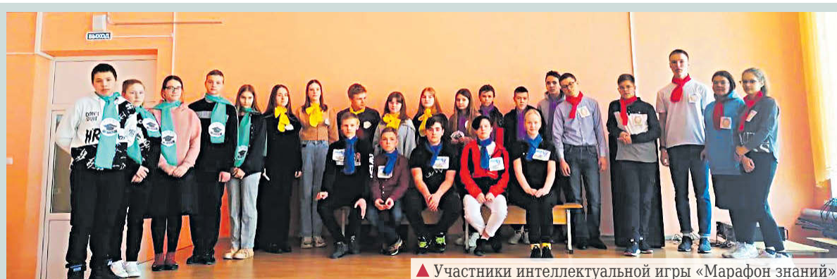
▲ Участники интеллектуальной игры «Марафон знаний»

Кристина МОСКОВКИНА Снимки предоставлены автором