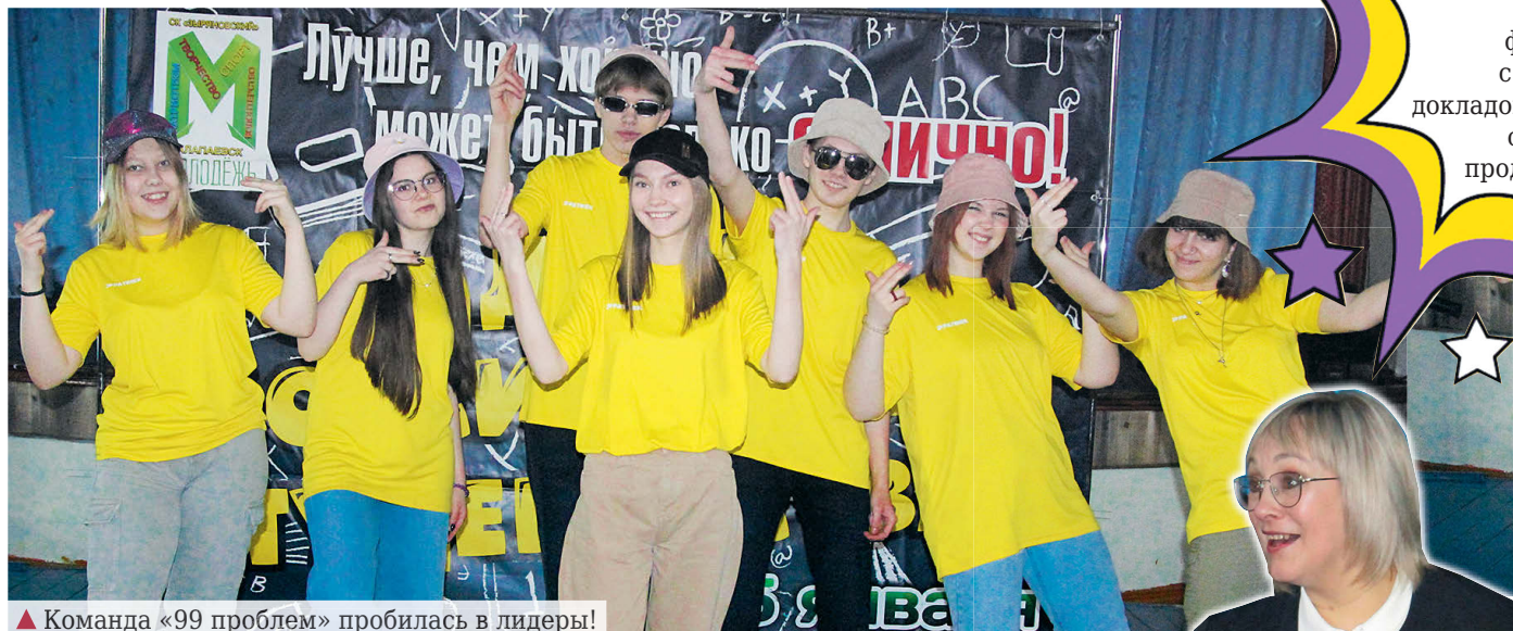
▲ Команда «99 проблем» пробилась в лидеры!