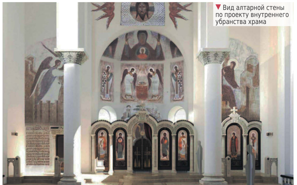
▼ Вид алтарной стены по проекту внутреннего убранства храма