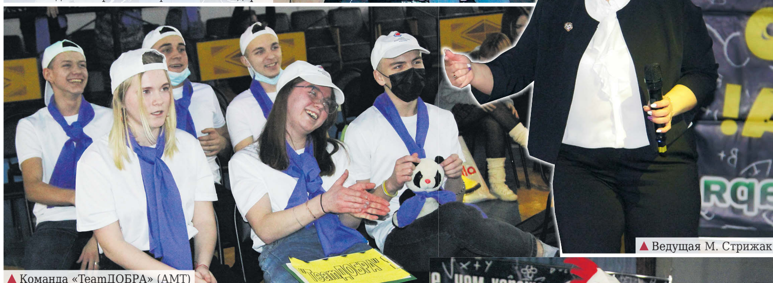
▲ Команда «TeamДОБРА» (АМТ)