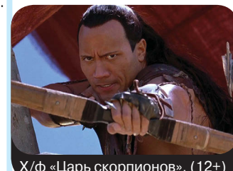
X/ф «Царь скорпионов». (12+)