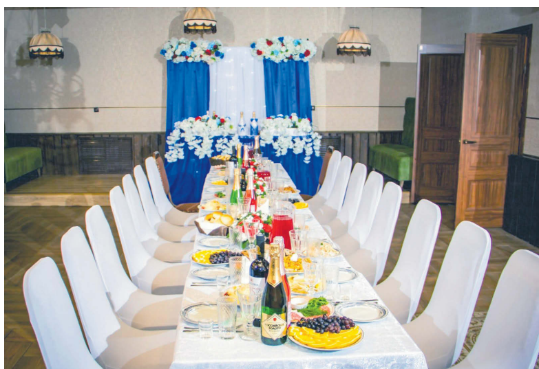
▲ Изысканная сервировка

ГРИЛЬ & КАФЕ «КАСПИЙ» г. Алапаевск, ул. Пугачева, 11, тел. 8-962-317-6962