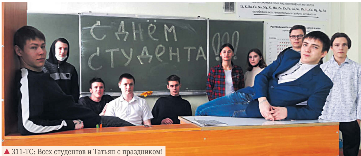
▲ 311-ТС: Всех студентов и Татьян с праздником!