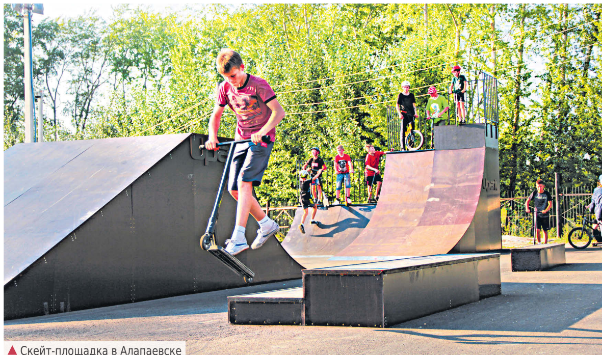
▲ Скейт-площадка в Алапаевске

Наиболее масштабными по территориальному охвату и