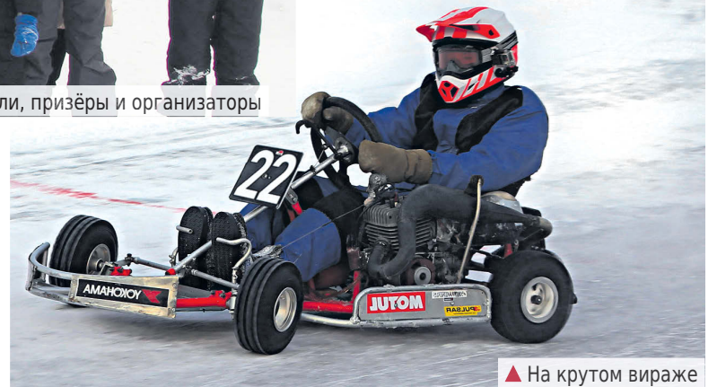
▲ На крутом вираже