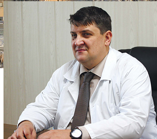
▲ А. Красилов

Для вакцинации детей есть два условия: письменное заявление одного из родителей (или иного законного представителя), составленное в произвольной форме на имя главного врача, и информированное добровольное согласие на вакцинацию.