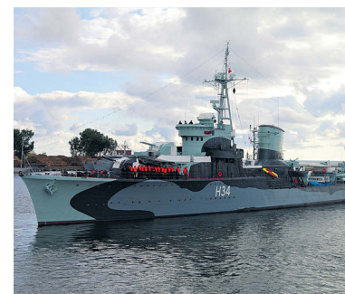
▲ Эсминец Blyskawica

Хочется подчеркнуть, что подросток очень высокого мнения о современном оснащении российской техники, в частности о танковом вооружении. Этот аспект им проработан досконально: Российская армия самая сильная в мире по танковому вооружению. Этой военной технике нет равных. Наша страна обладает 22,5 тысячи танков, большинство из которых – современные танки «Т-72». Уже появляется их улучшенная версия: «Т-72Б3». На втором месте по количеству танкового вооружения Китай – 13 тысяч единиц, на третьем США – 11 тысяч танков. Делайте выводы, господа!