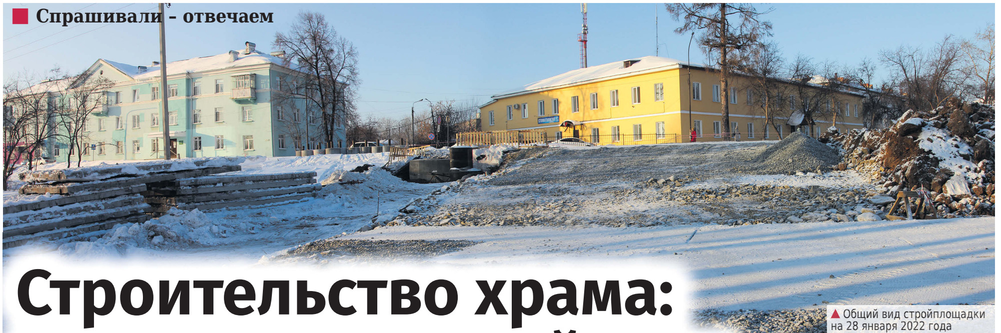
▲ Общий вид стройплощадки на 28 января 2022 года