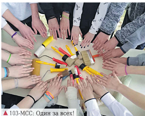
▲ 103-МСС: Один за всех!