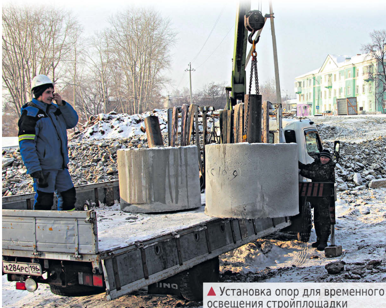
▲ Установка опор для временного освещения стройплощадки

Пожалуй, самые распространенные вопросы, которые задают сегодня алапаевцы по поводу строительства храма: как долго будет перекрыта дорога для движения автотранспорта по ул. Береговой и что за плиты выгружены на строительной площадке?