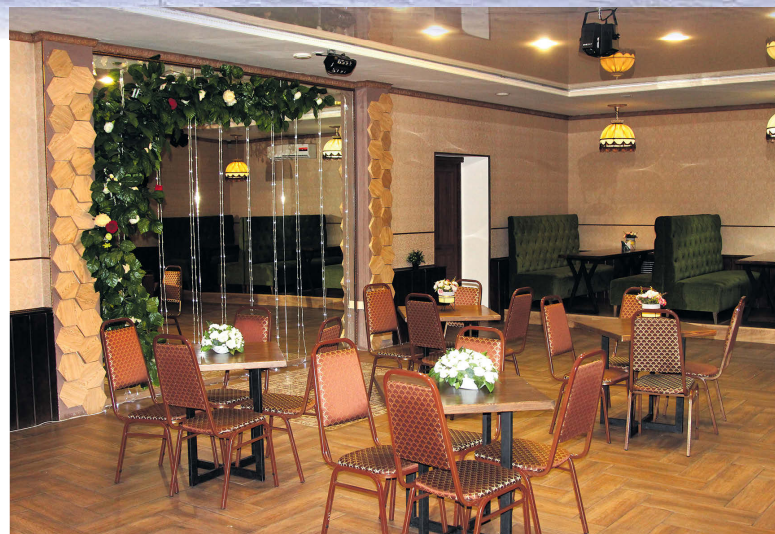
▲ Банкетный зал