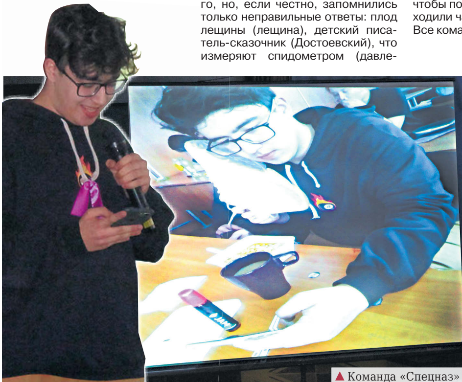
▲ Команда «Спецназ» покорила по-настоящему студенческой «печей-кучей»