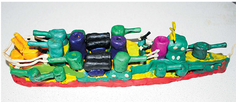
▲ Прочитать о военной технике – это одно, а воплотить в модели – это другое!