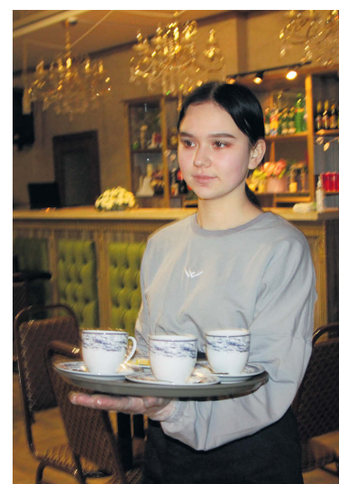
▲ Отличное обслуживание