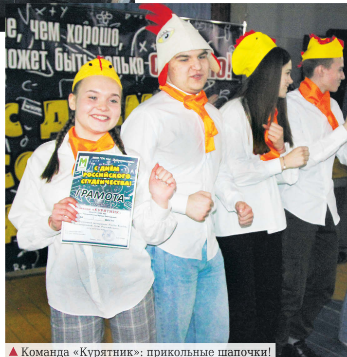
▲ Команда «Курятник»: прикольные шапочки!