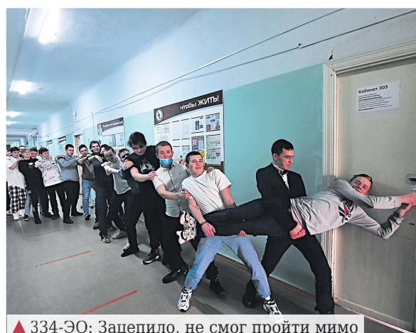
▲ 334-ЭО: Зацепило, не смог пройти мимо