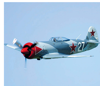
▲ Истребитель ЯК-1