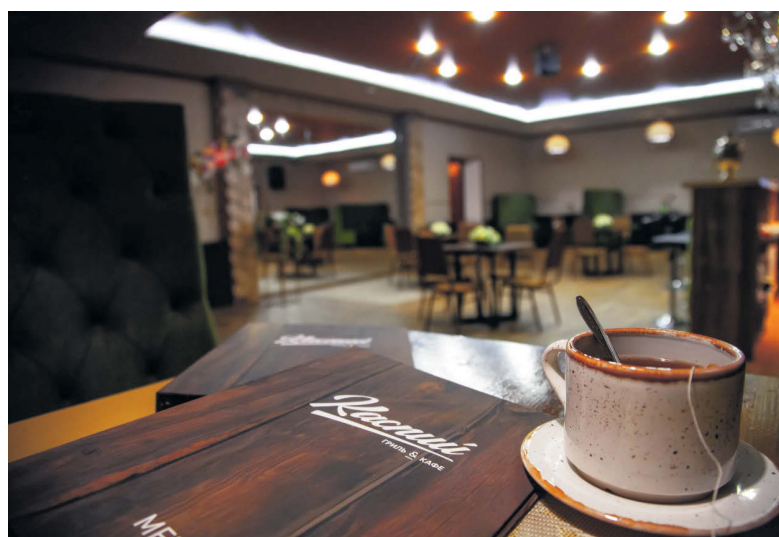
▲ Уютная атмосфера