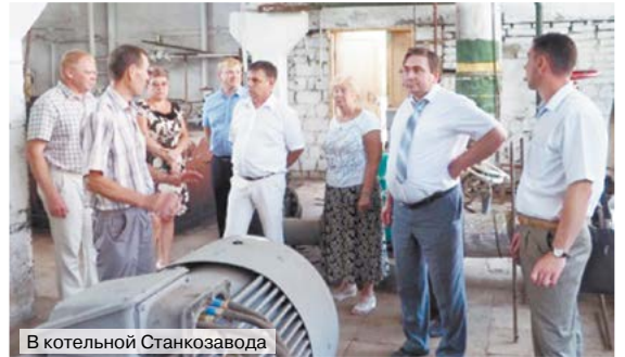
В котельной Станкозавода