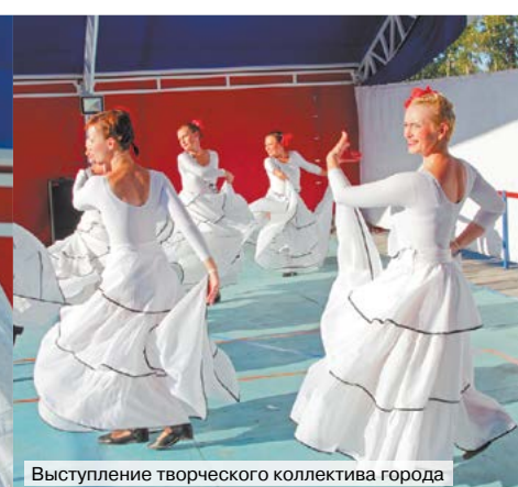
Выступление творческого коллектива города