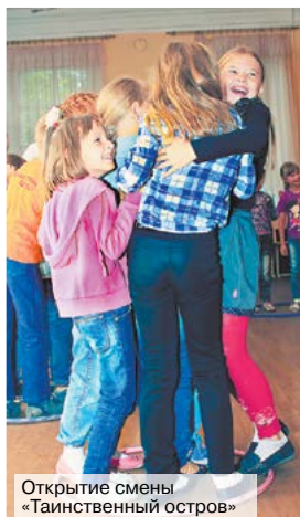
Открытие смены «Таинственный остров»

Название программы летнего отдыха детей в Доме детского творчества города Алапаевска – «Таинственный остров». Тот самый таинственный остров, на котором волею судеб очутились 2 «племени» (2 отряда): «Кассиопея» и «Акуловцы». Каждые 3 дня ребят ожидала борьба за тотем – приз «племени»-победителю в соревновательном мероприятии.