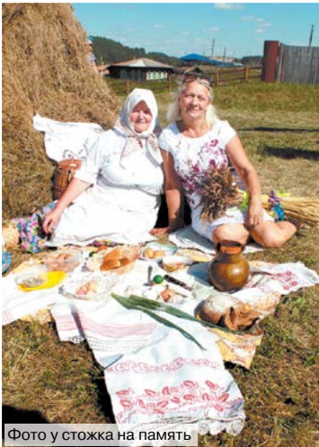
Фото ужошка на память

Традиционно в третью субботу августа в уральском селе Нижняя Синячиха прошли народные гуляния «Яблочный Спас всем народам веселье припас!». За несколько десятилетий своего существования праздник приобрёл известность среди ценителей народной культуры не только земли алапаевской, но и далеко за пределами Свердловской области.