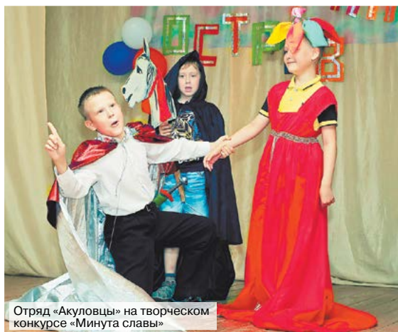
Отряд «Акуловцы» на творческом конкурсе «Минута славы»

За время отдыха ребята проявили себя в интеллектуальных, спортивных и творческих конкурсах детского оздоровительного лагеря: «Мисс Грация», «Мистер Эрудит», «Величие России», «Минута славы», «Поиски клада», в весёлых стартах, футбольном марафоне и многих других.