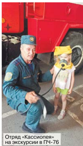
Отряд «Кассиопея» на экскурсии в ПЧ-76