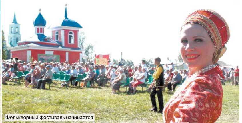
Фольклорный фестиваль начинается