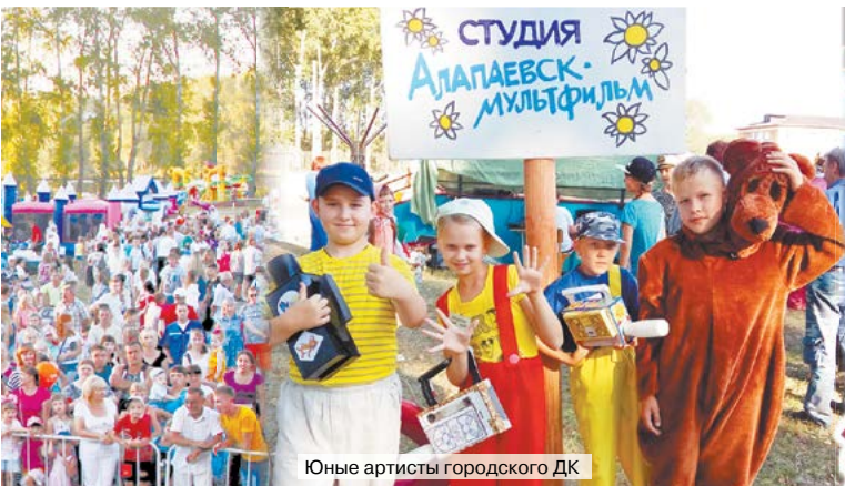
Юные артисты городского ДК