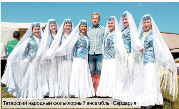
Татарский народный фольклорный ансамбль «Сардария»

К. ПОДОЙНИКОВА, научный сотрудник музея