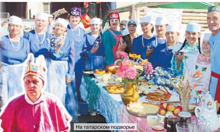
На татарском подворье