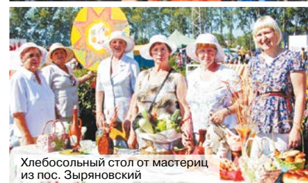
Хлебосольный стол от мастериц из пос. Зырянский

(г. Челябинск). Как сработали? Отлично! Уже на третьей песне большая часть зрителей подпевала артистам. Если вы находились в самой гуще активных зрителей и слушателей, то знаете, что артистов почти не было слышно, потому что их заглушал дружный хор алапаевцев. Знакомые и любимые песни, оригинальная авторская обработка, живое исполнение, изобилие сахарных сушек – аля бубликов, полное включение в программу алапаевцев, море рук, светящиеся экраны телефонов, взаимные поздравления с днем рождения города и объединяющая всех песня «Самый лучший день».