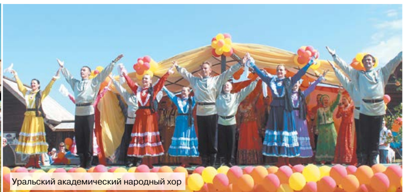
Уральский академический народный хор