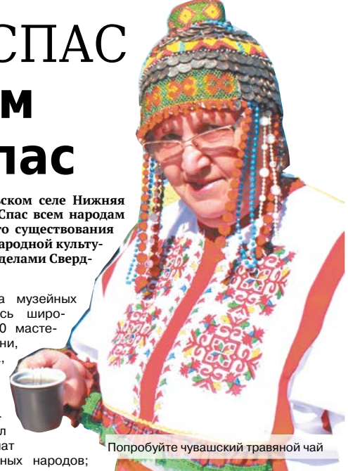
Попробуйте чувашский травяной чай

А тем временем на музейных просторах развернулась широкая ярмарка. Более 70 мастеров-умельцев из Тюмени, Перми, Новосибирска, Ханты-Мансийского АО и других территорий демонстрировали свои творения. Над продуктовыми лавками витал неповторимый аромат вкуснейших блюд разных народов; неподалеку проходило выступление борцов, работали разнообразие аттракционы для детей. В крестьянских усадьбах гостей радовали воспронизведением сенок из крестьянской жизни, погружая зрителя в атмосферу глубокой старины: в усадьбе XVII века желающие участвовали в обряде крестин, в усадьбе XVIII века хозяйка приглашала поучаствовать в интерактиве «Яблоки мочить – не квашню заводить» и потчевала малосольными огурчиками. В доме XIX века можно было услышать старинную казачью колыбельную, а во дворе гости участвовали в мастер-классе «Оттиск по бересте». В музейной кузнице любой желающий мог изготовить себе на память монету-сувенир, а на противоположном берегу реки мельник показывал всем интересующимся работу