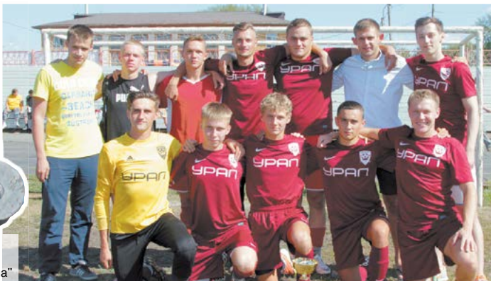
Победители Кубка города по футболу