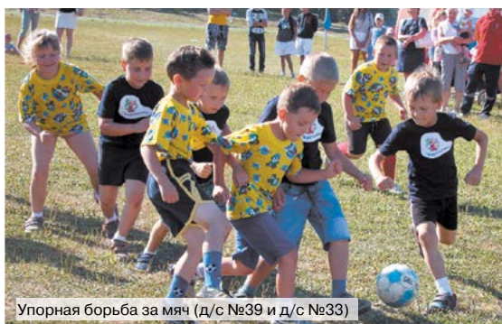
Упорная борьба за мяч (д/с №39 и д/с №33)

сама вежливость». А награжденные силовиков проходило под звуки оркестра под руководством С.Д.Стяжкина - такого в городе у нас еще не было.